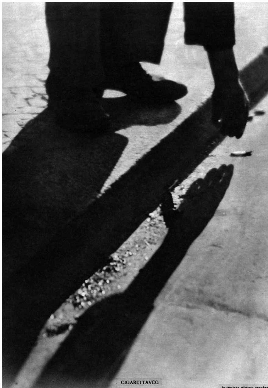
Munkácsi Márton: Cigarettavég, 1931.

Pesti Napló Képes Melléklete, 1931. 03. 08. 8.