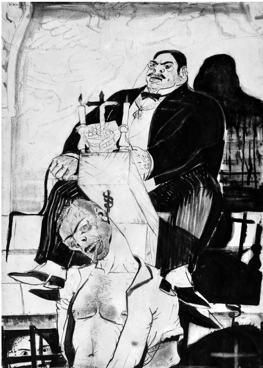
Derkovits Gyula: Az ítéletvégrehajtó, 1930.

Papír, tus, 515 x 363 mm. MNG Iksz.: F 56. 36.