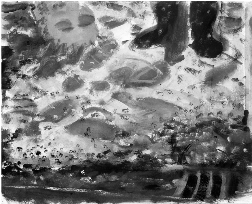
Derkovits Gyula: Vázlat a kenyérért I.-hez (Terror), 1930. Gouache, papír, 250 x 310 mm. MNG Ists.: 1936-3021.

rántotta, magához ölelte a szidalmazásban. Ekkor az „abszolút festőiség” terén még nem tartotta olyan jónak, olyan kiérleltnek, mint Egry Józsefet, Berény Róbertet vagy Bernáth Aurélt. El kellett telnie tizenhárom szörnyű évnek, mire odaállította magában a legnagyobbak, köztük Nagy István mellé, akinek művészetével ritkán vetjük össze Derkovitsét, pedig érdemes lenne. A „parasztfestő” és a „proletárfestő”, akik, miközben egy éppen letűnő és egy éppen feltűnő világot festenek, mindketten ritmust és figurát ötvöznek, retorikai értelemben is új szintaxist keresnek egy olyan festészetnek, mely a nagy, közös európai stílusterkvések és stíluskeresések polgári nyelvét lokális, feudális akcentusokkal beszéli.