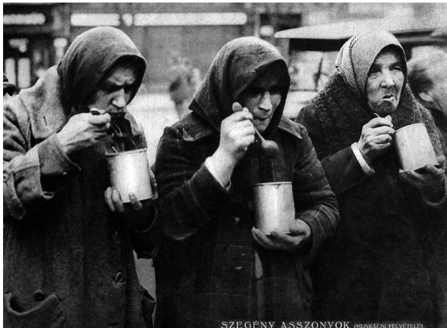
Munkácsi Márton: Szegény asszonyok, 1926. Repr. Pesti Napló Képes Melléklete, 1926. 12. 25. 117.