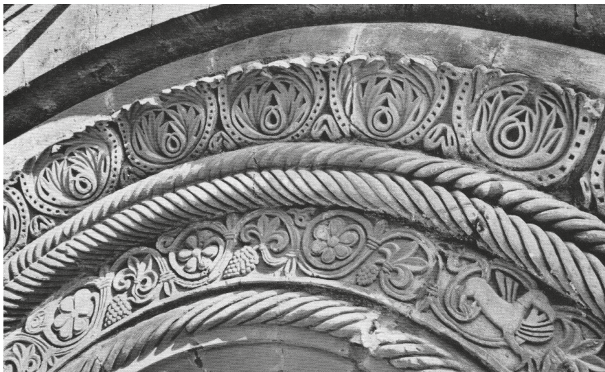
9. Speyer, székesegyház, déli kereszthajóhomlokzat. Részelt a felső nyugati ablak keretéről. Repr. Kubach-Haas 1972. II. Abb. 676. nyomán

nagyon komolyan elmélyedt a téma, 12. századi román kori szobrászat egyetemes kérdéseiben, mindeerre a tudásra magyarországi anyag feldolgozásának előfeltételeként is tekintett, a nemzetközi kutatás kérdéseire megjelent és sajnos kéziratban maradt munkákban egyaránt hozzászólvá. 90 Az óbudán feltűnő stílus „provinciális változatának” tekintette a somogyvári bencés apátsági templom „szentélyrekesztőjének” töredékét (5. kép), időrendileg is Óbuda mögé rendelve – szemben Dercsényi álláspontjával, aki 11. század végi fejleményekbe illeszthetőnek nek gondolta. 91 Később ő maga mutatott rá a somogyvári (és részben óbudai) ornamentális stílus (növényi indás, állatalakos jeleneinek és figurális részleteinek) közvetlen forrására milánói San Ambrogio szószékének faragványában. 92