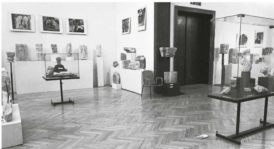
5. Székesfehérvár, 1978. Árpád-kori kőfaragványok című kiállítás részlete (Csók István Képtár emeleti tér) a pécsi székesegyház (balra), az óbudai prépostság (jobbra hátul) és Esztergom (balra vitrinben) 12. századi faragványaiival, a falon pécsi román kori faragványok reprodukciója látható. neg. ltsz. 21440.

anyag mentén – valóban két-három évszázad kőfaragásának emlékenyagát tekinti át, az abban kirajzolódó stílustendenciák, egy-egy műben megjelenő hatások szétbogozásával, eredetük és magyarországi utóéletük feltérképezésével foglalkozik. A kezdetéknél két olyan, részben a megelőző generációtól (Gerevich Tibor, Horváth Henrik, Dercsényi Dezső) örökölt kérdésre reflektál, amelyek az Árpád-kori kézikönyv előkészületeit jelző tanulmányban már Kovács Évánál is terítékre került, 62 és amelyek akkoriban a „kőfaragóművészet” 11. századi kezdeteinek (stíluseredet, előzmények) megítélésénél kikerülhetetlenül tornyosultak. Az egyiket – a provinciális római művészeti hagyaték kérdése, vagyis, hogy a „helyi római művészet évszázadokkal korábbi gyakorlata” játszhatott-e szerepet a kezdeteknél – inkább elutasította. A másik esetben, a 11. századi kőfaragványok ornamentikája („palmattás stílus”) és a honfoglaló magyarság ötvösművészeti produkcióját meghatározó palmattás motívumkincs közötti kapcsolat terén némileg megengedőbb volt. Elsősorban ízlésszerű preferenciákat feltételezve: „E kőfaragói stílus nem állhat genetikai összefüggésben, mint feltételezték, az egy évszázaddal korábbi honfoglaláskori ötvösséggel. A jellegzetes formájú palmattát egyik főmotívumául választó,