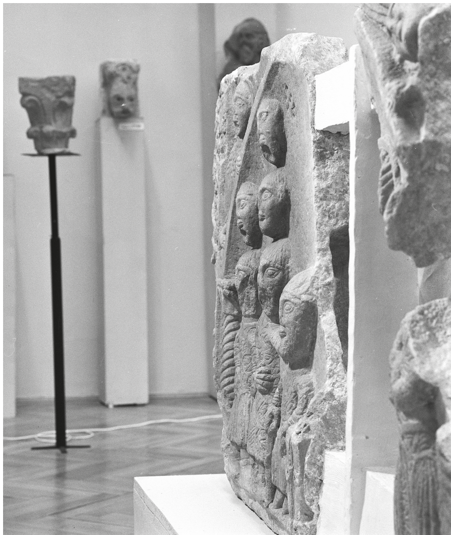
6. Székesfehérvár, 1978. Árpád-kori kőfaragványok című kiállítás részlete (Csók István Képtár emeleti tér) a somogyvári domborműtöredékekkel és a háttérben a pécsi székesegyház faragványaival. © ELKH BTK MI Fényképtár, neg. ltsz. 21277.

végtelen dekoratív mustrákat kedvelő korai magyar ötvösművészet példája mindenesetre arra figyelmeztet, hogy számolni kell a 11. századi magyarság körében egy meghatározott művészeti ízlés tradíciójával, amely a lehetséges bizánci kőfaragóstílusok közül a már ismerthez közelebb álló irányzathoz vonzódott”. 63