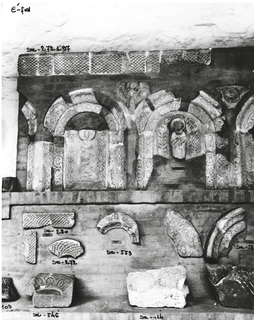
2. Pécs, a régi Kőtár a lebontása előtt 1975/1976-ban. Részlet a Kőtár „északi faláról: apostolalakos vakfülkék sora („szentélyrekesztő”) és párkánytöredékek a faragványok bontás előtti azonosító számával.