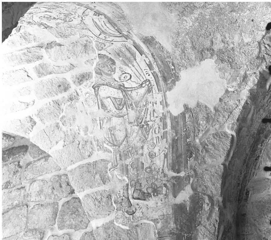
12. Feldebrő, volt bencés apátsági templom, Káin és Ábel áldozata, MÉM MDK, Fotótár, ltsz. 008.122N © Magyar Építészeti Múzeum, Budapest

sorozat Árpád-kori kötetének előkészítésébe, egyaránt vállalva szerzői és – a teljes képanyag összegyűjtését, rendszerezését magában foglaló – szerkesztői feladatokat. 119 Ez a tevékenység már szorosan összefüggött a korabeli falfestészet kutatásával, ami meghatározta pályafutása első harmadát.