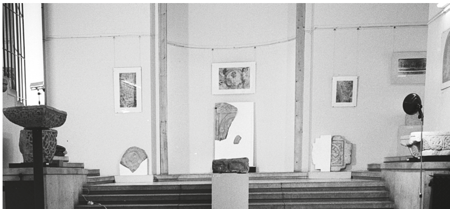
4. Székesfehérvár, 1978. Árpád-kori-kőfaragványok című kiállítás részlete. Balról a székesvárdi fejezetek, jobbról a zselicszentjakabi vállkő, középen az „aracsi kő” a hátfalon az „apszisban” a pécsváradai Madonna, két oldalán zalavári kőlapok láthatók.

© ELKH BTK MI Fényképtára, neg. ltsz. 21437. (részlet)