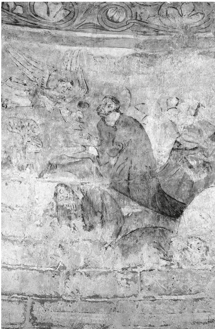
14. Hidegség, egykori körtemplom, Krisztus az Olajfák hegyén. Galacanu Efstatia felvétele, 2001 - MÉM MDK, Fotótár, ltsz. 204.530N. © Magyar Építészeti Múzeum, Budapest