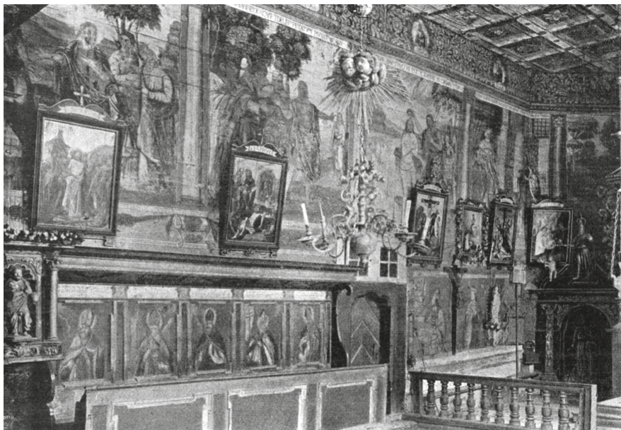
6. Az oravkai templom belseje. Divald Kornél: Pusztuló fatemplomok. Élet , 1918. május 26. 522.

fordul elő, ehelyett a „szerb” szerepel. A „katholikus” írásmód is már archaizmus a huszadik század előrehaladtával. Stoss keresztnevének állandóan használt magyar változata tekinthető tudatos állásfoglalásnak, viszont a „Donner Ráfael György” és a „Kracker Lukács János” már egyszerűen képtelenség, a 19. században megjelent könyveken olvasható „Hugo Viktort” és „Verne Gyulát” juttatja eszünkbe.