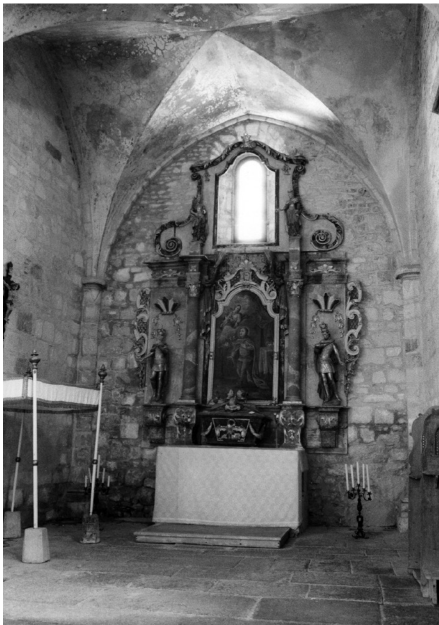
3. A belpátfalvi ciszterci templom Szent Imre-mellékoltára © MÉM MDK, Fotótár, ltsz. 235.079P