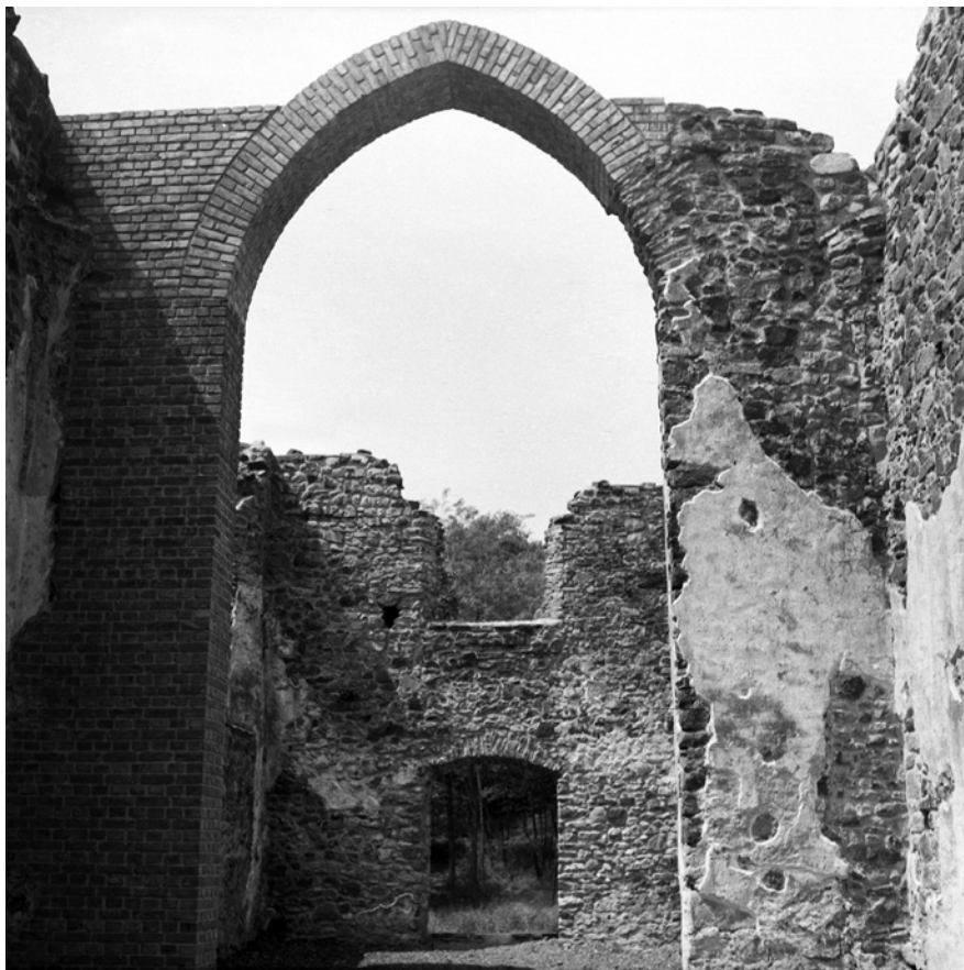
8. A salföldi pálos templomrom diadalíve, 1964