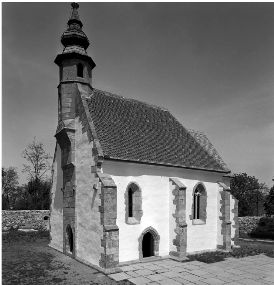
10. Nógrádsáp helyreállított római katolikus temploma délnyugat felől, 1965