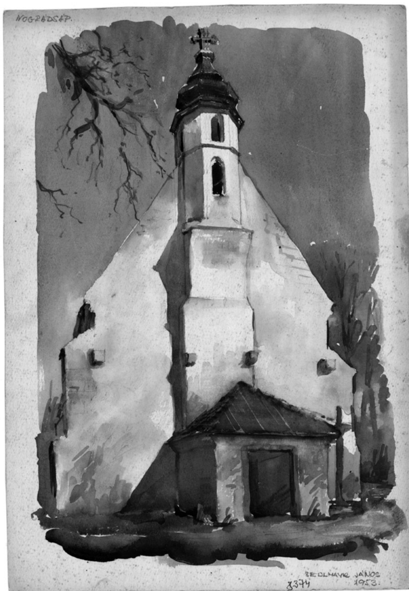
9. Nógrádsáp, római katolikus templom, Sedlmayr János akvarellje, 1953 © MÉM MDK, Tervtár, ltsz. R 8374

mást nem, évente egy-egy kisebb templom helyreállítását csak megcsináltam. Nagyon szerettem a kis templomok helyreállítási munkáit, de olyan volumenben, mint korábban, nem tudtam dolgozni. Ezért is siettem nyugdíjba, mert aztán nyugdíjasként (akkor alakultak ki az új, szabad tervezési adózási rendszerek) megint legalább annyit dolgoztam, mint amennyit korábban.