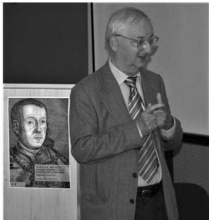
Előadás közben a kőszegi Esterházy Pál-konferencián, 2013. május 22–23.