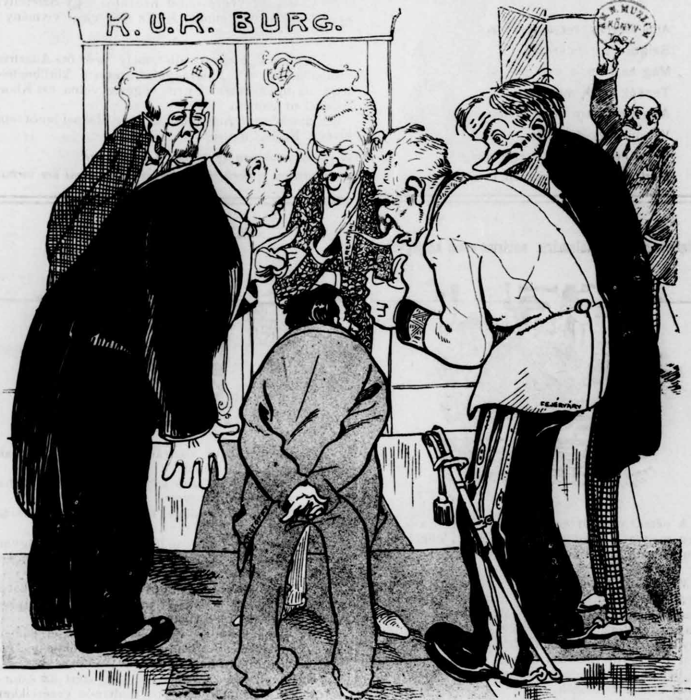
Tessék látni! Itt van im lá.