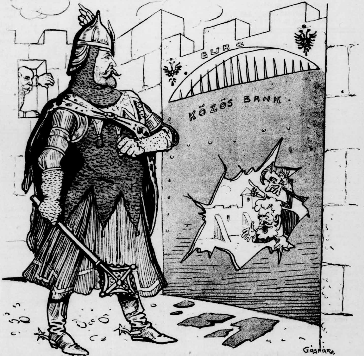
Bevágja a közös bank érckapuját, Es növeli az osztrákok baját, búját.