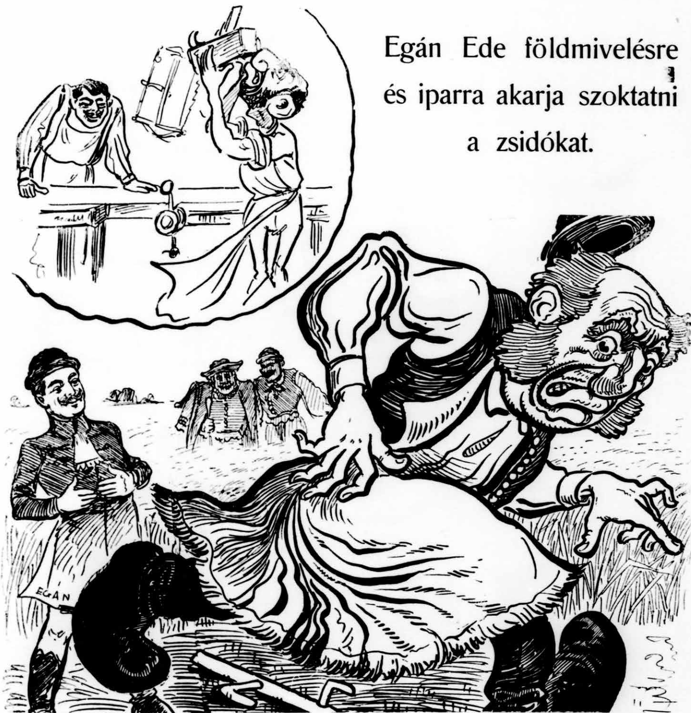
De munkától zsidó meg nem szakad, — Belzebub, te hamis, ugyan már ne kacagj.

Egán Ede földmivelésre és iparra akarja szoktatni a zsidókat.