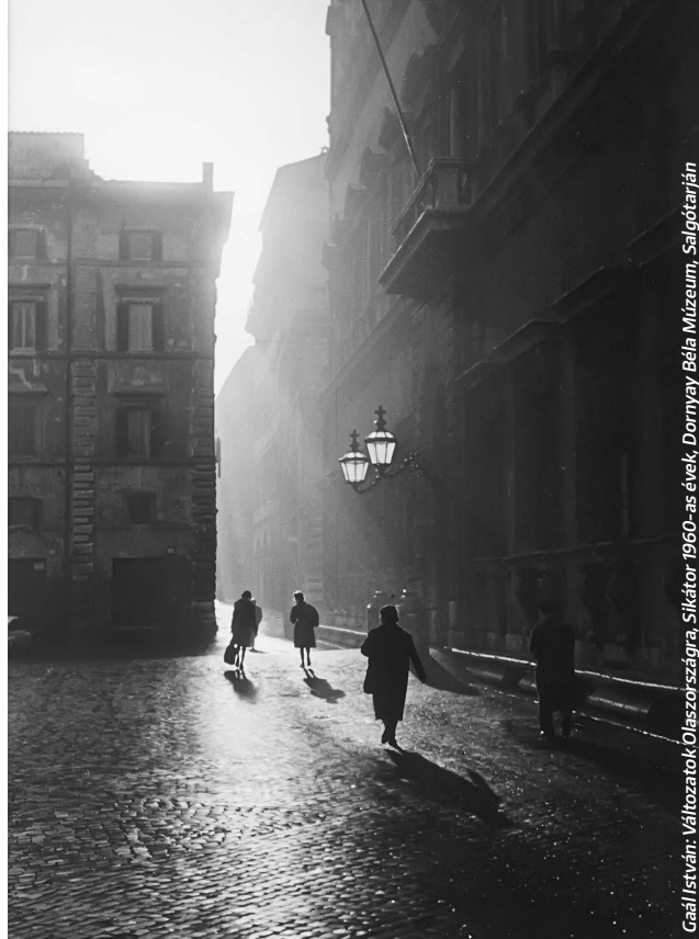
Gaál István: Választatok, Olaszországra, Sikkátor 1960-as évek, Dornyay Béla Múzeum, Salgótarján

📍 Szépművészeti Múzeum 📅 ÁPRILIS 8. – JÚLIUS 17., k–v: 10.00–18.00 💰 4400 Ft 🔗 szepmuveszeti.hu