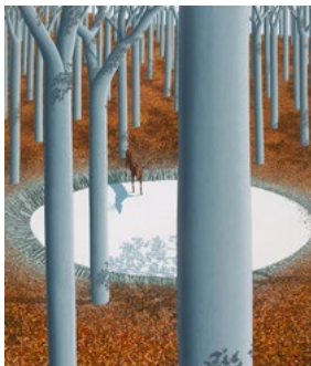
Kép: Losonczy 4_Forest-3. (2005) oil on canvas, 1 80x140 cm

📍 Godot Kortárs Művészeti Intézet 📅 OKTÓBER 6–17. 📄 INGYENES 🌐 www.gica.hu