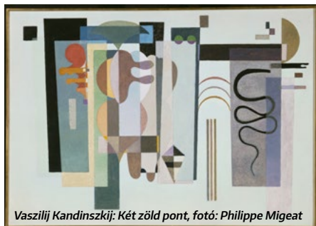
Vaszilij Kandinszkij: Két zöld pont