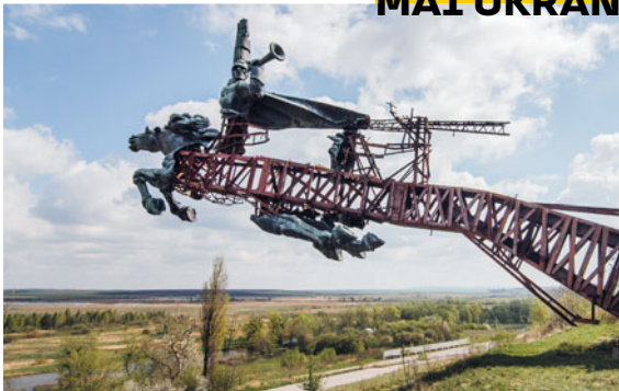
Részlet Yevgen Nikoforov: A Köztársaság emlékművei fotósorozatból, 2015–2017

A kiállítás a Budapesti Tavasz Fesztivállal közös program. ludwigmuseum.hu | facebook.com/ludwigmuseum | ludwigmuseum.blog.hu