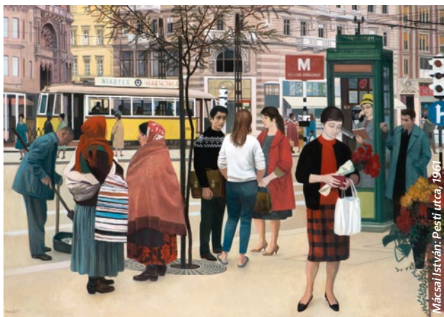
Mácsai István: Pesti utca, 1961

– A HATVANAS ÉVEK MŰVÉSZETE MAGYARORSZÁGON (1958–1968)