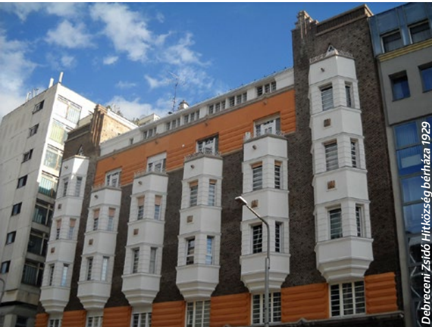
Debreceni Zsidó Hitközség bértáza 1929

M ár megint egy epizód a „mi lett volna, ha...” sorozatból? Nem egészen. Igaz, Sajó István olyasmit művelt, ami épp csak gyökeret vert a magyar ugaron, de egyes házaik most is állnak. És az is igaz, hogy oly korban élt itt, amikor lehetetlen volt egy életmű ívét végigvinni, végighúzni egy vonalat megszakítás nélkül. Minálunk minden történet szakadozott – megszoktuk, mégis megszokhatatlan.