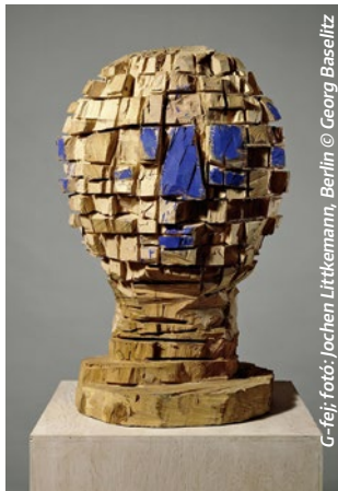
G-Fej; © Georg Baselitz

A z egyik, ha nem „a” legnagyobb élő német képzőművész. Ezt nehéz fokozni. Nagy hatású alkotó, akinek nyolcvan művét most a régió eddigi legnagyobb Baselitz-retrospektívájén láthatjuk.