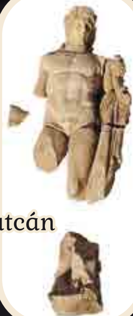
Ókori szobor a középkori utcán

Görögország északi részén, Filippinél a város Kr. u. 8–9. századra keltezhető részén dolgoznak jelenleg a régészek. Az egyik korabeli útkereszteszűdésben egy meglepő szoborleletre bukkantak. Egy jóval korábbi, a Kr. e. 2. századra keltezhető, életnagyságúnál nagyobb szobor töredékei kerültek elő. A töredékek alapján valószínűleg Héraklészre ábrázolta az alkotás. A Kr. e. 4. században alapított, majd Filipposzról, Nagy Sándor apjáról elnevezett város jelentőségét az is jelzi, hogy 2016-ban a világörökség részévé nyilvánították.