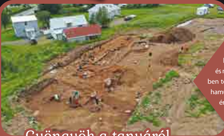
Gyöngyök a tanyáról

Izlandon egy viking kori tanyát találtak a régészek. A 10. századra keltezhető épületet folyamatosan bővítették és még a 14. században is használták. 1362-ben tört ki az Öräfajökull-vulkán, melynek hamuja elfedte a tanyát. A leletek közt a legérdekesebbek azok a gyöngyök, melyek színei a mai izlandi zászlóra hasonlítanak, melyet 1915 óta használnak.