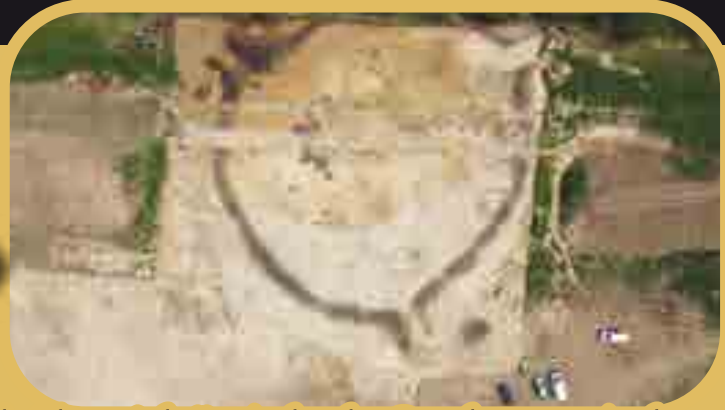
Újkőkori körárkok Csehországban

Prága közelében egy újkőkori, többszörös körárokmal ellátott lelőhelyen végeznek feltárást a régészek. A kb. 55 méter átmérőjű külső árkon három bejáratot találtak, és sikerült megtalálni a belső paliszádfal alapozásait is. A régészek a lelőhely korát Kr. e. 4900 és Kr. e. 4600 környékére keltezik. Európában, köztük Magyarországon is, eddig közel 200 hasonló szerkezetű körárkot figyeltek meg, melyek funkciójáról több elmélet is született.