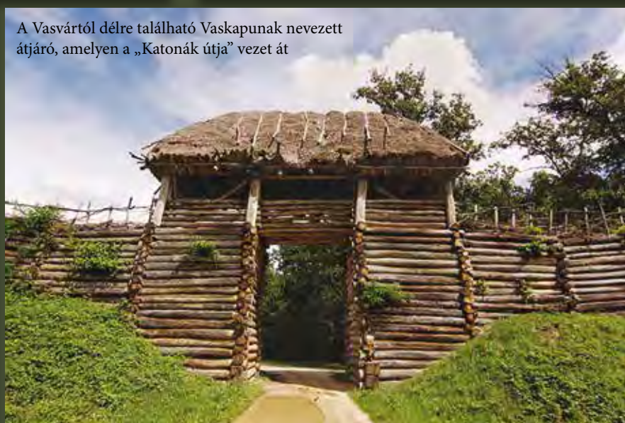
A Vasvártól délre található Vaskapunak nevezett átjáró, amelyen a „Katonák útja” vezet át

Az Esztergomból nyugat felé vezető, Sopronba tartó országúton fekvő Kapuvár neve az Árpád-korban csak Kapu volt. Az itt húzódó töltés a Hanság mocsaraitól vezet dél felé, Kapu(vár) irányába, és a vá-