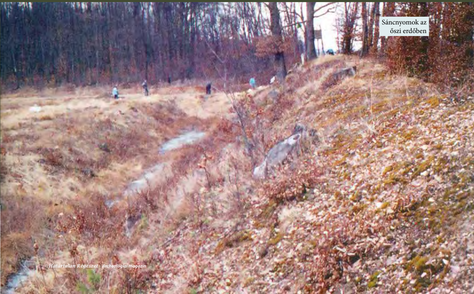
Sáncnyomok az őszi erdőben