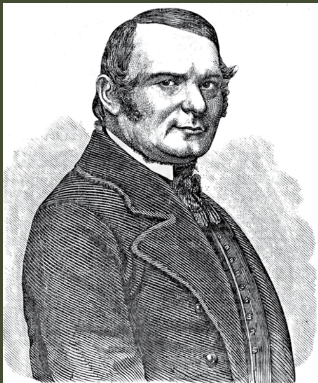
Rómer Flóris (1815–1889), a magyar régészet atyja

A dunántúli sáncok árka a töltés nyugati és délnyugati oldalán van, tehát az onnan érkező behatolás ellen jelentettek védelmi vonalat. A védekezés iránya azonban szükségszerűen leszűkíti és meghatározza a készítésük idejét is. Sem a római korban, sem előtte és utána, tehát a hun és az avar korban védelmi vonal készítésére nem volt szükség, mert nyugat felől nem kellett védekezni. Egyúttal a sáncokkal kapcsolatos forrás- és okleveles adatok a sánc használatát a kora Árpád-korra datálják, védelemre ugyanis csak a honfoglalás után volt szükség. Az augsburgi csatavesztést (955) követő néhány évtizedben lehetett leginkább szükség a védelmi vonalak felállítására. A sáncok föld-