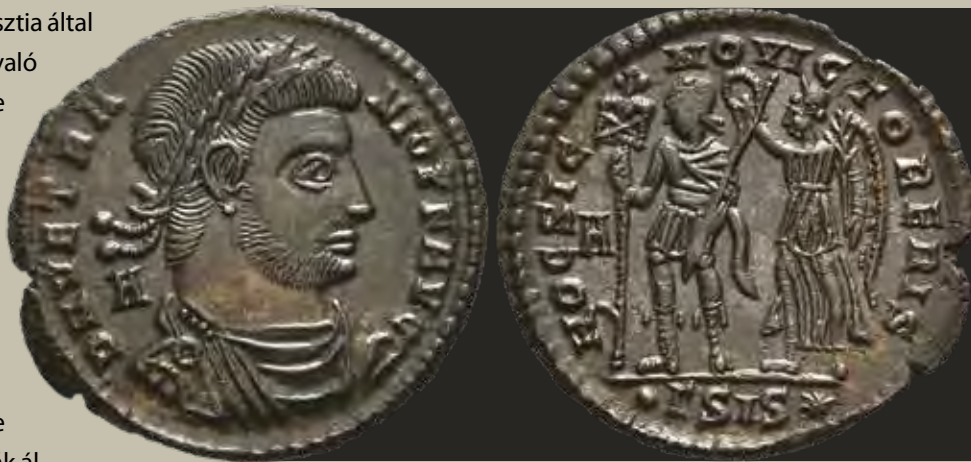
Az idős Vetrano sisciai „HOC SIG – NO VICTOR ERIS” hátlapi köriratú rézerméje a Victoria által koronázott császár alakjával

jelvények lecserlését tagadták meg, így hitüket megvallva keserves halál várt rájuk. A császár egyértelmű üzenete a „pogány” valláshoz való visszatéréséről a nagy méretű rézermeken feltűnő Apis bika alakja, mely fölött két csillag látható.