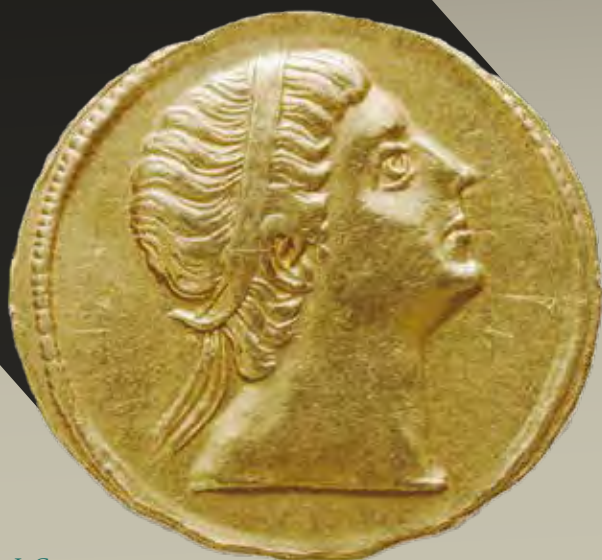
I. Constantinus solidusa a thessalonikai verdéből, felfelé tekintő portréval

Az ambíciótlannak éppen nem nevezhető ellencsászár ( usurpator ) komoly veszélyt jelentett a keleti birodalomrészt uraló testvér, azaz II. Constantius számára. Az egykor Constans alá tartozó területek hamar az új császár kezére kerültek, aki jelentős erővel és viszonylag gyorsan haladt keleti irányba. Az ekkoriban vert érmék hátlapjain pedig követhetjük a polgárháborús propaganda eszköztárának alakulását.