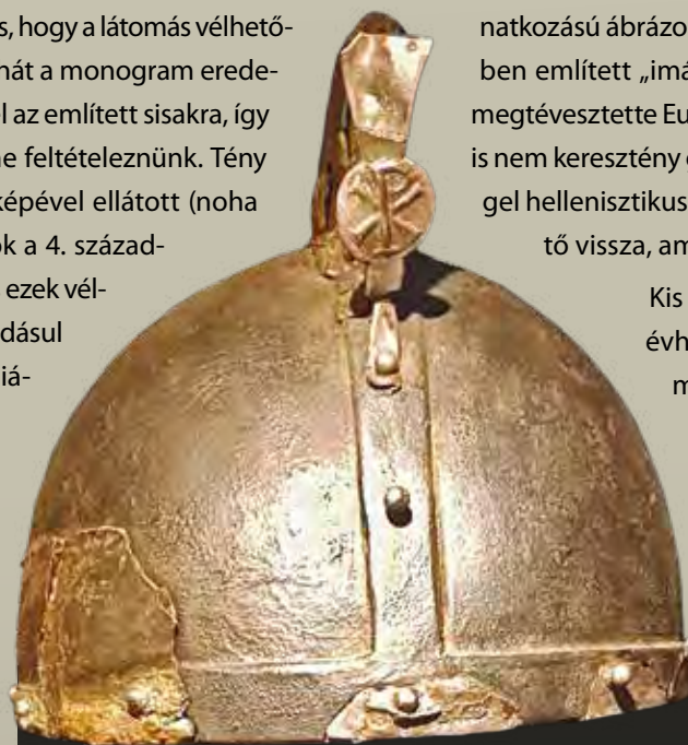
Krisztus-monogramos sisaktaréjveret a hollandiai Kesselből

Kis ugrással érdemes most a 350. évhez kanyarodunk, mely év eseményei az éremverésben is figyelemreméltó változásokat hoztak. Flavius Magnus Magnentius, a császári testőrség parancsnoka ragadta a nyugati tartományokban magához a hatalmat ebben az esztendőben, amikor is Constantinus fiát, a Pireneusokban vadászó Constantst az év januárjában meggyilkoltatta.