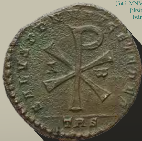
Decentius caesar trieri „SALVS DD NN AVG ET CAES” hátlapú köriratú rézérme Krisztus-monogrammal

A körirat: „HOC SIGNO VICTOR ERIS”, azaz „Ejelenben győzni fogsz!”. A történeti forrásokban több formában is megjelenő constantinusi jelmondat egyértelmű hivatkozás a legitim dinasztiára. Érdekesség, hogy a Pannoniát fenyegető Magnentiusszal szemben, az újperzsa fronton is lekötött II. Constantius kényszerű kompromisszumot vállalt. Félhivatalosan elismert egy „újabb”