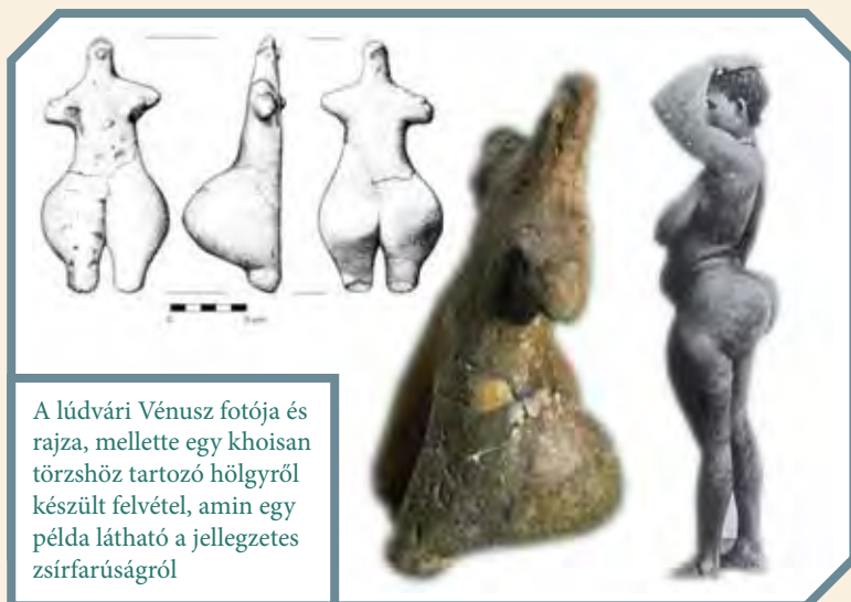
A lúdvári Vénusz fotója és rajza, mellette egy khoisan törzshöz tartozó hölgyről készült felvétel, amin egy példa látható a jellegzetes zsírfarúságról

Ezek a kis szobrocskán szinte kivétel nélkül mindig töredékesen kerültek elő. A lúdvári Vénusz is nagyon hasonló kivitelű, hiszen a fényezett és kopott felületű alkotás felső teste és az egész has felőli oldala teljesen lapos. Az orrot, a karokat – és enyhén a melleket is – plasztikusan jelenítették meg. A fenék viszont oldalra és a hátfelőli rész felé is erőteljesen kialakított, olyanynira, hogy az idolt nem is lehet a lábára támasztva felállítani. Kizárólag a jókora tomporra lehet leültetni, így felmerül, hogy valójában ez lehetett az eredeti pozíciója a tárgynak, ami három részbe (felsőtest és a két fenék-láb rész) törve került elő.