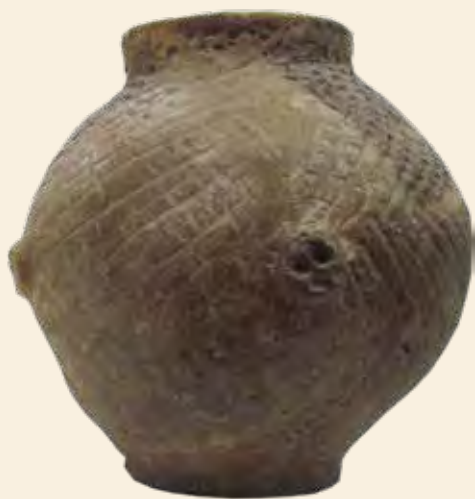
Jellegzetes körömbevagdolásos, ujjbenyomásos és a nádvég benyomásával kialakított díszítések az edények felületén