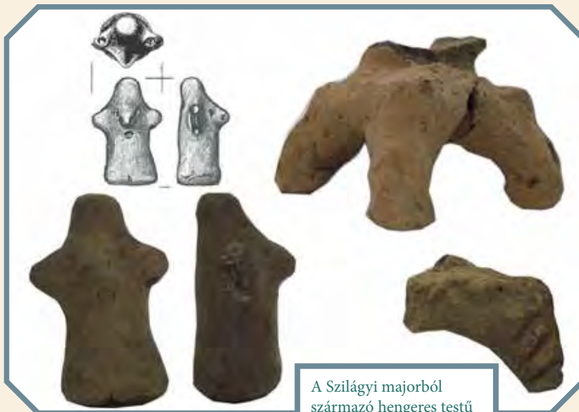
A Szilágyi majorból származó hengeres testű agyagidol, egy mécses- vagy oltártöredék

A művészettörténet különböző korszakaiban számos Vénusz-értelmezést találunk, amelyek kizárólag nőket ábrázolnak, és valószínűleg jól tükrözik az adott korszak nőideálját. Az élelemtermelő életmód korai időszakában nagy mennyiségben jelentek meg, és a Közel-Keleten, valamint Közép- és Délkelet-Európában széles körben terjedtek a nőket ábrázoló apró szobrok. Nyugat-Európa területéről ugyanakkor nem ismerünk agyagból készült idolt. Ezen okból az idolok megjelenését és elterjedését a neolitizáció közvetett velejárójaként értelmezik. Julian Thomas brit régész megjegyzi, hogy a Délkelet-Európára nagy mennyiségben jellemző idolok vélhetően az egyéni identitás kifejezéséhez is kapcsolódhattak, így akár egy konkrét személyt is megjeleníthettek, de mindenképpen egy sajátos társadalmi helyzethez, rituális cselekedethez kapcsolódhattak.