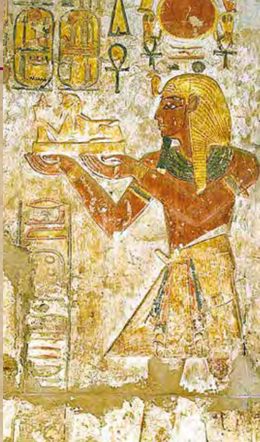
III. Ramszesz fáraót ábrázoló dombormű, melyen a fáraó egy szfinxet ajánl fel (Karnak)

szerepe ugyanis a terhes nők megsegítése és az újszülöttek védelmezése lett. Hathor istennővel is azonosították, és ebben a minőségében saját szentélllyel rendelkezett a karnaki Amon-Ré-templom körzetében. Népszerűségét jól mutatja, hogy a fáraókor egész története során nagy számban kerülnek elő figurái az amulettek között, voltak alakjában megformált kis edénykéek kenőcsök vagy anyatej számára is, de bútorokon is szívesen ábrázolták alakját.