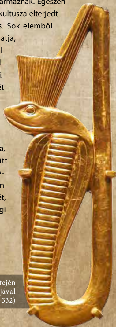
Arany ureusz kígyó, fején Alsó-Egyiptom koronájával (Kr. e. 664–332)