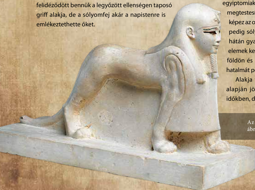
Az oroszlántestű Tutu istenséget ábrázoló szobrocška

Alakja feltehetően elő-ázsiai előképek alapján jött létre, az államalapítás előtti időkben, de időközben tovább változott, pl.