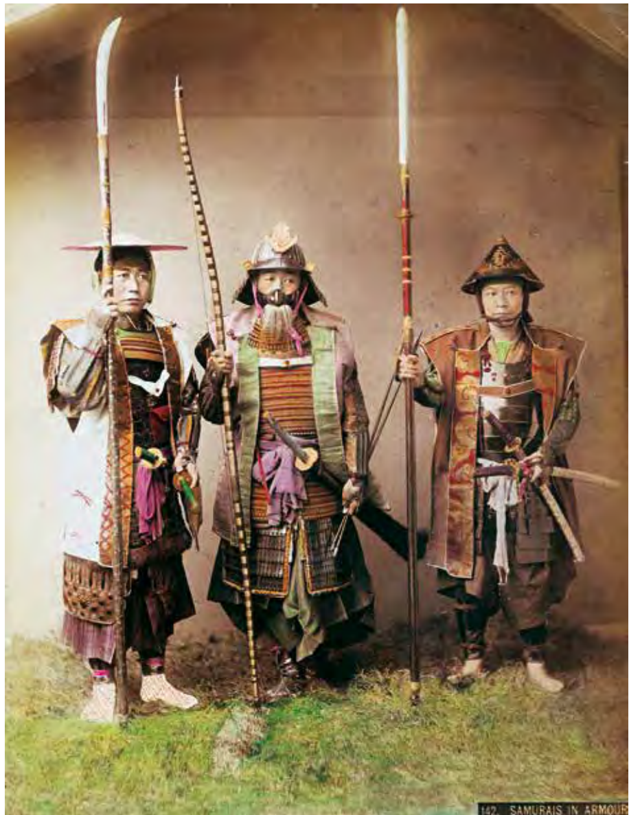
Szamurájpáncélba öltözött férfiakat ábrázoló korai fénykép

egy többségében nőkből álló csapattest, és olyan szamurájpáncélok is fennmaradtak, amik a női test vonalaihoz igazodtak), másrészt a harcterek látványa korántsem volt annyira dinamikus, mint azt a filmekben ábrázolják mostanság. A meglehetősen lassan ügető, a nehéz páncélos férfiaktól görnyedő pónik látványa meglehetősen messze állhatott a mozik mai lendületes képsoraitól. A japán lovakat végül csak a szigetország 19. századi átfogó modernizációjának időszakában cserélték le jóval magasabb, testesebb, nagyobb teherbírású és gyorsabb közel-keleti és európai hatásokra.