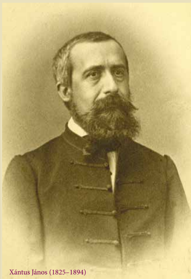
Xántus János (1825–1894)