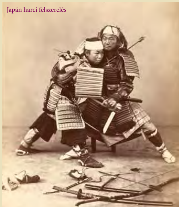
Japán harci felszerelés

számára. Ransonnet 1864 és 1865 között Ceylonon töltött néhány hónapot. Az ott készített, részben a tenger alatti korallzátonyokat bemutató vázslatait 1867-ben Bécsben jelentette meg.