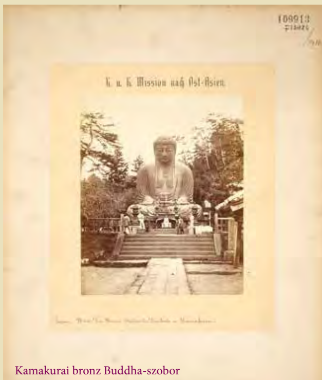
Kamakurai bronz Buddha-szobor