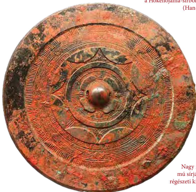
Nagy méretű japán bronztükrő az Ivava Jarimizo lelőhely 17. számú sírjából, 2. század

Jelenlegi ismereteink szerint Japánban Észak-Kjúsú urnasírjaiból, valamint kisebb halomsírjaiból, illetve a honsúi Nara-síkság halomsírjaiból kerültek elő a legnagyobb számban kínai bronztükrök. A tükrök típusa mindkét régióban különböző, méretük is változatos, de a taoista kozmológia szimbólumai szinte mindegyiken megjelennek. Ezek a tárgyak a kínai krónikák feljegyzései alapján elsősorban