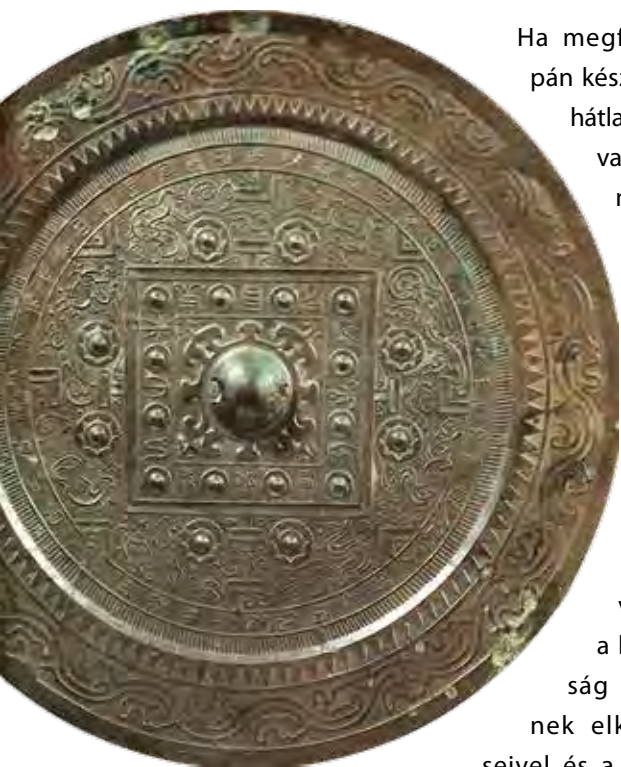
Kínai import „varázstükrő” a Szakuranobaba lelőhelyről (Han-kor)

általában simára csiszolt, hátoldala gazdagon díszített, 10–20 cm átmérőjű és néhány milliméter vastag, formájában és a hátlap-kialakításában egyaránt kifejezésre jut az ártó szellemek elleni mágikus védelem és a kozmikus harmóniára törekvés elve: a közepen elhelyezett fogógomb köré többnyire az égi és a földi vi-