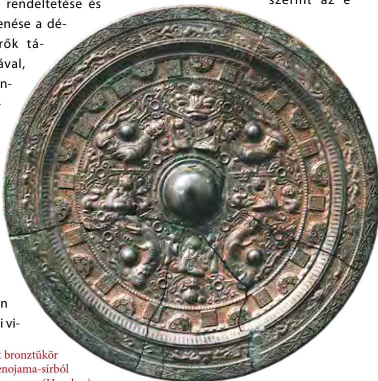
Kínai import bronztükrő a Hokenojama-sírból (Han-kor)

lágot (tehát az univerzumot) szimbolizáló, különböző négyzetmintákba és körökbe rendezett díszítés készült. E kozmikus, de örökké változó világgépet zömmel a forgó mozgást sugalló égtájór állatalakkal, ókori csillagképekkel, taoista halhatatlanokkal, a zodiákus állatalakjaival, geometrikus elemekkel, növényi ornamentikával, felhőmintával, vagy épp ősi kínai írásjegyek mintázatával próbálták megjeleníteni. A tükörfeliratok tanúsága szerint az e