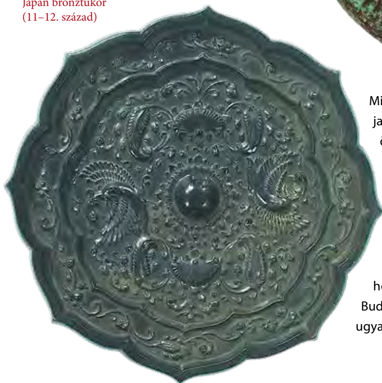
Japán bronztükör (11–12. század)

Mintázatukat és használatuk módját a 8. századi híres japán versantológia, a Manjósú több dalban is megőrökíti.