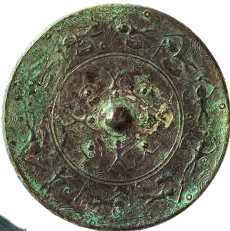
Vadászatot ábrázoló japán mintás bronztükör (3–4. század)

A legkülönlegesebb Tang-kori bronztükrök kialakítására a Selyemút művésze is hatott, ezekből a gyöngyház- és borostyánberakású, szőlőindával és palmettával is gyakran díszített műtárgyakból császári relikviaként a japán Sószojin kincstár is őriz néhány darabot.