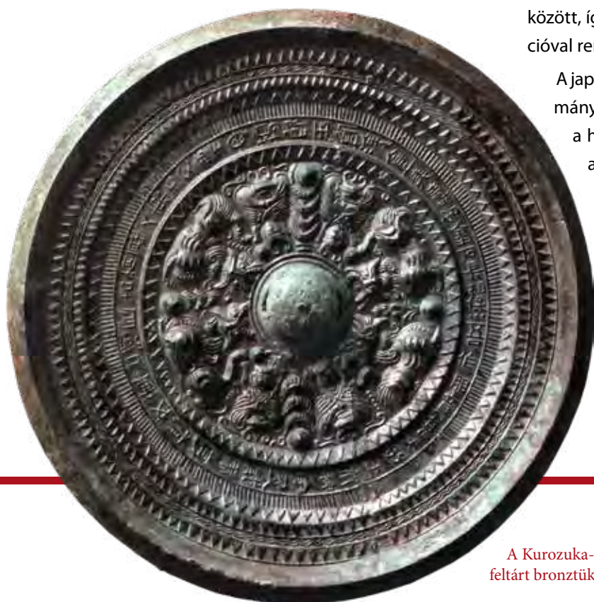
A Kurozuka-sírból feltárt bronztükrő

A japán uralkodó által a vidéki hatalmasságoknak adományozott bronztükrők a jó szövetségi viszony és a hatalmi legitimáció szimbólumai is voltak, ezért a császári család halomsírjain és szentélyein kívül gyakran kerültek vidéki nemzetségfők sírjaiba is.