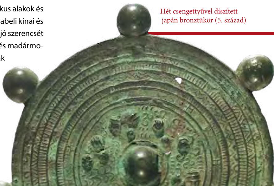
Hét csengettyűvel díszített japán bronztükör (5. század)

A japán készítésű Nara-kori (710–794) tükrökön azonban nemcsak a „klasszikusnak” számító mitikus alakok és taoista szimbólumok jelennek meg, de a korabeli kínai és koreai udvari hagyomány és „divat” hatására jó szerencsét és bőséget hozó minták (pl. bizonyos virág- és madármotívumok) is előtérbe kerülnek. Ezek a tárgyak viszont általában kis méretűek (kb. 7–16 cm), és valódi használati tárgyként, dísz-tárgyként és szertartási kellékként is funkcionáltak, többnyire a császári udvarban.