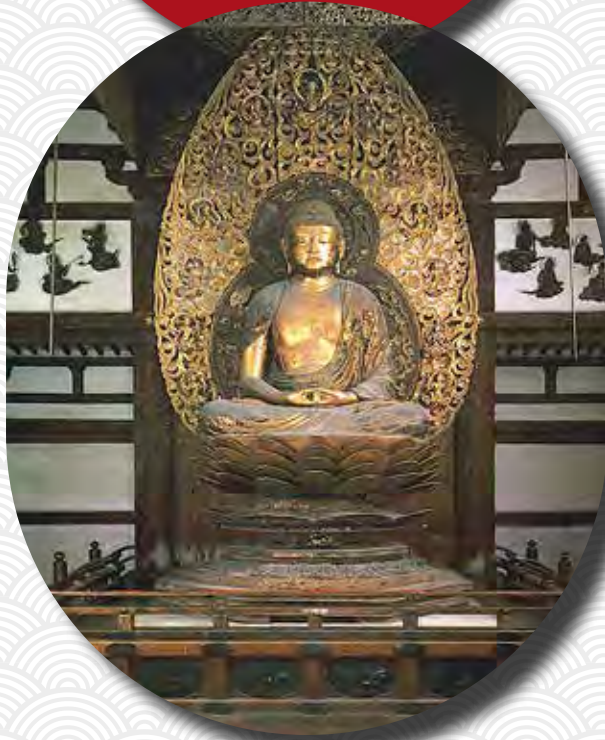
Dzsócsó: Amida Buddha, Udzsi, Bjódóin

közelebb álló, kevésbé intellektuális jellegű tiszta föld irányzat hódított, megjelenítve a Nyugati Paradisom Buddháját, Amida Buddhát. Az akkori fővároshoz közeli Udzsiban felépült Főnix-csarnokban, a Bjódóinban látható Amida-szobor a korszak híres szobrászának, Dzsócsónak kiemelkedő remekműve. A különálló fadarabokból összeállított szobor arányaiban is harmonikus, kifejezetten alulnézetre komponált.