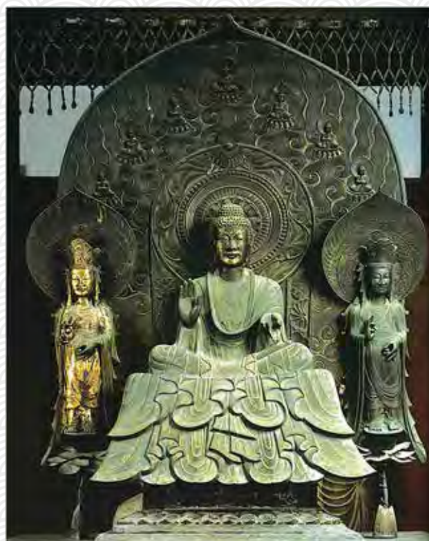
Sákjamuni triád, Hórijú-dzsi

A korszak egyik kiemelkedő alakja, Sótoku herceg (574–622) tudatosan támogatta a buddhizmust, átvette a kontinensről a kínai államrendszert és az írást (a korabeli japán krónikákat még kínai írásjegyekkel írták). Természetesen az új vallás és kultúra bevezetésével a buddhista művészet kontinensről érkező formái is megjelentek Japánban, eleinte Koreából érkeztek tanítók és mesterekből. Közülük való a híres Hórijú-dzsi nevű templom főcsarnokában Sákjamuni Buddhát két bódhiszattvával ábrázoló aranyozott bronzszobor alkotója, Tori Bussi is.