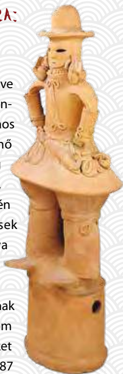
Haniva (Tokiói Nemzeti Múzeum)

A régi sírhalmok kora – amint neve is mutatja – elsősorban a kontinensen már ekkor szokásos sírhalmas temetkezések Japánban történő elterjedésére utal. Földrajzilag elsősorban Japán legnagyobb, Honsú nevű szigetének déli részén találhatjuk meg e temetkezések nyomait, majd innen kiindulva terjedtek el Japán többi részén. Az Oszaka melletti Szakai város környékén Nintoku császár sírjának tartott kulcslyuk formájú sírhalom még ma is elkápráztat bennünket méreteivel: 28 méter magas, 487 méter hosszú, s három hatalmas árok veszi körül.