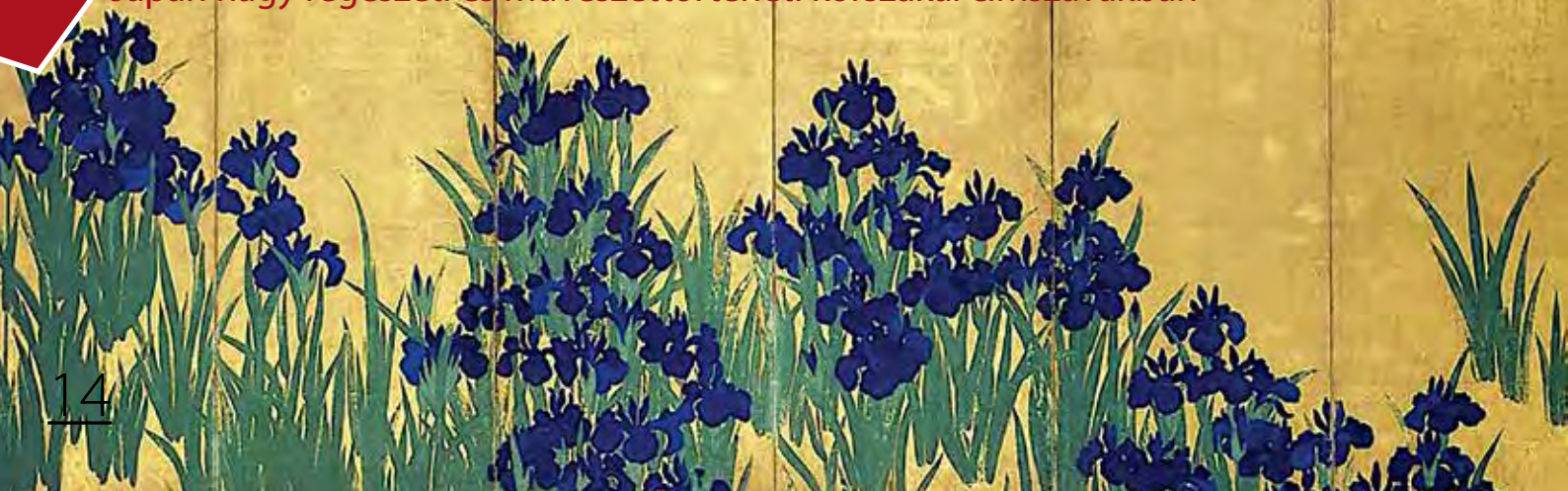
Ógata Kórin: Íriszek