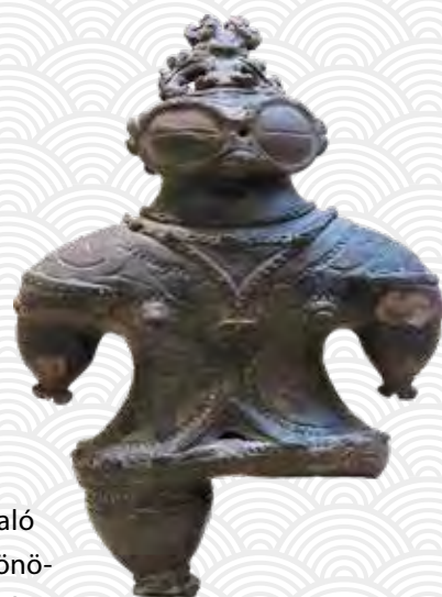
Dogú Kamegaoka lelőhelyről (Tokiói Nemzeti Múzeum)

A Dzsómon-kor jellemzői még a valószínűleg termékenységkultuszra utaló agyagfigurák, japánul dogúk , amelyek igen változatos formákat mutatnak. Különösen érdekes a találón „hószemüveges” elnevezéssel jellemzett típus, ami a sci-fi írók fantáziáját is megmozgatta.