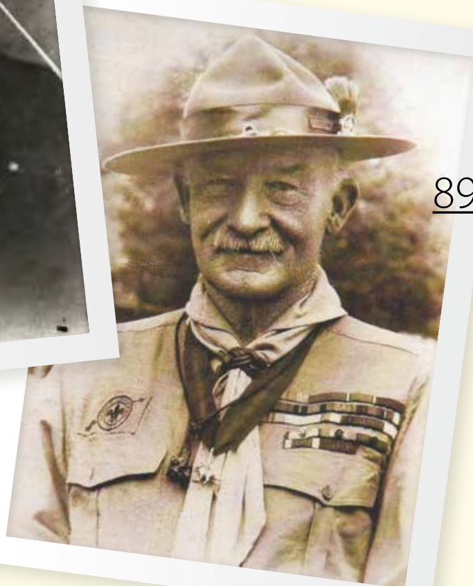
◊ Robert Baden Powell