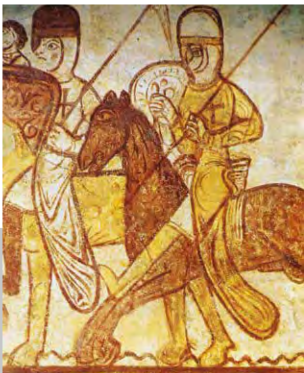
Ismeretlen festő templomoslovag-ábrázolása (12. század)