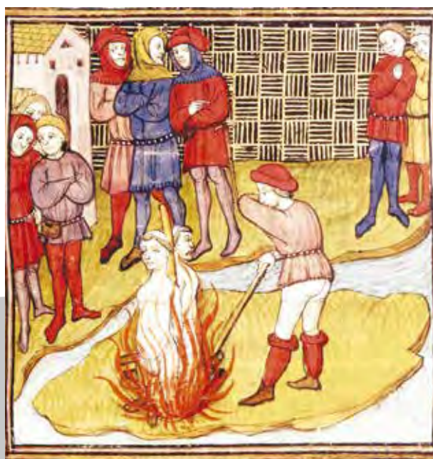
A templomosok megégetése Franciaország Nagy Krónikájában (14. század). Az ábrázolt sziget alakja pontosan megfelel a Szajna Île de la Cité nevű szigetének, ahol a kivégzések történtek