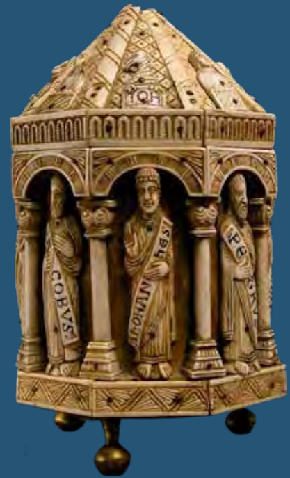
Csontlemezekkel borított ereklyetartó