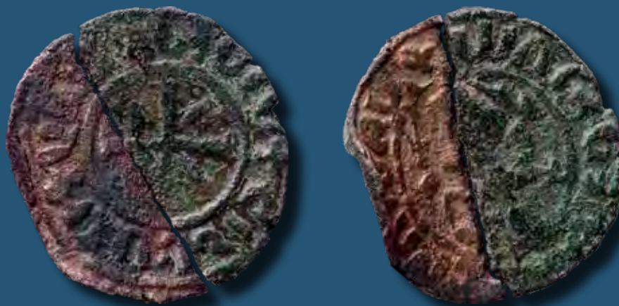
Hetum érme Bugacról

A bugaci Pétermonostora egyúttal feltűnően nagy mennyiségű értékes, kvalitásos műtárggyal gazdagította a magyar régészetet. Az ekkor kifejezetten szabadnak és biztonságosnak mondható kereskedelmi tevékenység következtében persze bármikor érkezhettek drága portékák szerte a nagyvilágból. Így például folyamatosan áramolhattak a zománcozott tömegtermékek a francia Limoges-ból vagy az agancsból faragott műreemek Köln környékéről. Mindamellet nem alaptalanul lehet felvetni, hogy az 1180–1200 környékére datálható utóbbi darabok, különösen a szintén a Felső-Rajna vidékén készült Szent Péter-ereklyetartó idekerülését Barbarossa Frigyes német császár 1189-es keresztes hadjáratához lehet kötni.