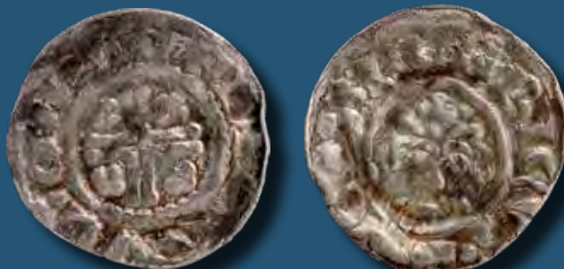
Oroszlánszívú Richárd (ur. 1189–1199) által kibocsátott penny

A kiskunsági Homokhátság Árpád-kori központjaként azonosított, a hatalmas kolostoregyüttes körül fekvő városias település nem az egykori zarándokút mentén feküdt. Mindazonáltal az Árpád-kori Magyarország egyik legfontosabb kereskedelmi és hadiútja, a Szeged és Pest közt haladó Királyi Út egyik fontos állomása volt. Arra, hogy a 13. század elején már kövezett főterét koptatták-e a nagyobb nyugati lovagseregek lovainak patkói, nemigen fogunk választ kapni. Csak gyaníthatjuk, hogy a frissen épült monostor 1147-ben a II. keresztes hadjárat német csapatai sarcolását talán nem szenvedte meg, bár a Képes Krónika leírása alapján ez nem is zárható ki: „ III. Konrád német király zsarnokként dühöngött, nem volt az országban egyetlen egyház vagy monostor sem, melytől ne zsarolt volna ki pénzt. ” Kézzel fogható bizonyítékok szintén nem adnak választ arra a kérdésre sem, hogy Jeruzsálemben tartó zarándokok választották-e alternatívaként ezen útvonalat. Az viszont kétségtelen, hogy legalább egy pétermonostorai polgár zarándokként járt Rómában, erre ékes bizonyítékul szolgál az itt nagy számban előkerült zarándokjelvények.