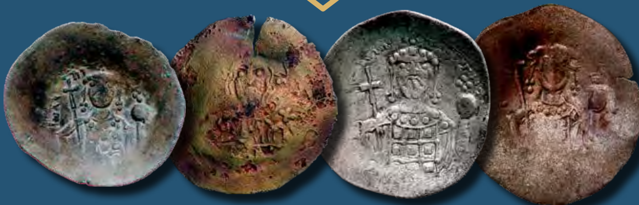
Bizánci pénz a keresztes háborúk korából