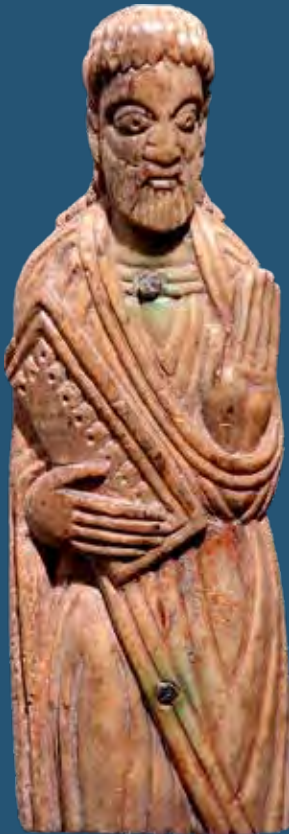
Agancsból faragott szentalak Bugacról