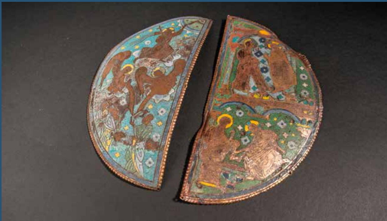
A Felső-Rajna vidékén készült Szent Péter-ereklyetartó

vagy keresztes hozta is magával e pénzermét, annak vagy érzelmi oka volt, vagy épp csak véletlenül (pl. a málhában) keveredett a Bugac melletti földbe. Az mindenesetre kétségtelen, hogy igencsak ritka darabról van szó, hiszen ezzel egyező érme Közép-Európában mindössze egy krakkói lelőhelyen került napvilágra.