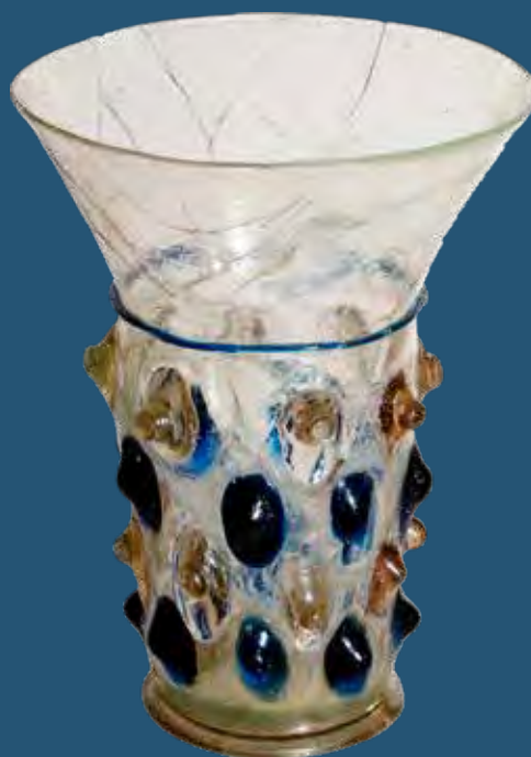
Szíriai cseppes pohár Bugacról