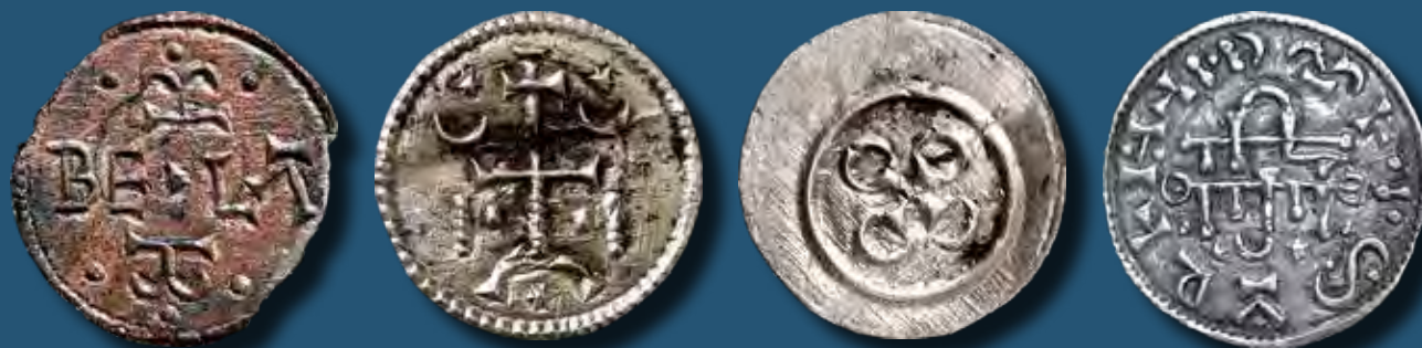
III. Béla (ur. 1172–1196) által kibocsátott dénár

A keresztes hadjáratok magyar vonatkozásai sok érdekességet tartogatnak, a korabeli krónikák alapján pedig elég jól rekonstruálható a magyar részvétel. Azonban a régész számára mégiscsak felmerül az a kérdés, hogy vajon milyen kézzel fogható nyomai maradhattak ezen eseményeknek és egyáltalán az egész izgalmas időszaknak. Hiszen a 13. század közepéig bizonyíthatóan több ezer, akár több tízezer hazánkfia is megfordult a Szentföld környékén, míg sok százezer külföldi haladt át ez idő alatt az országon, ami – legalábbis elméletileg – számtalan tárgyi emlékben kellene megnyilvánuljon.