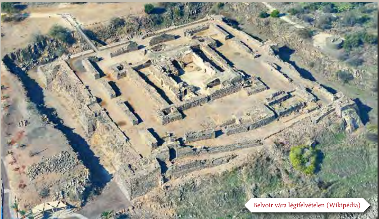
Belvoir vára légifelvételen

A 12. század második felére a muszlim világ megosztottsága csökkent, és egyre nagyobb fenyegetést jelentett a keresztények által ellenőrzött területekre. Ugyanakkor a haditechnika is gyorsan fejlődött a korábbiaknál sokkal hatékonyabb ellensúlyos hajtógépek elterjedésével. Erre a hadiépítészet részéről a koncentrikus várak megépítése volt a válasz. Az új erődítéseket dupla falgyűrűvel vették körül, melyek közül a belső a külső fölé magasodva fedezte azt, és a kettő együtt nagyobb védelmet biztosított