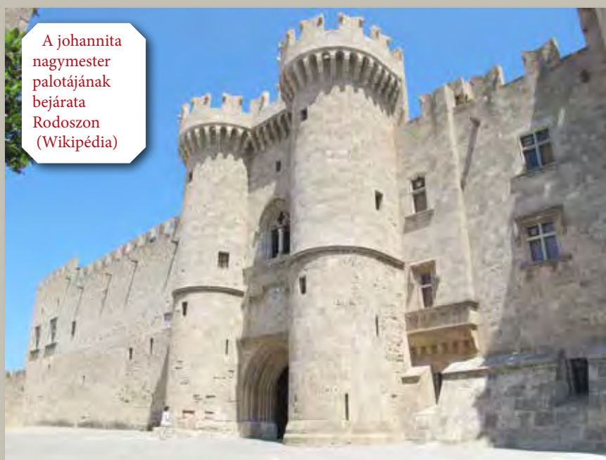
A johannita nagymester palotájának bejárata Rodoszon