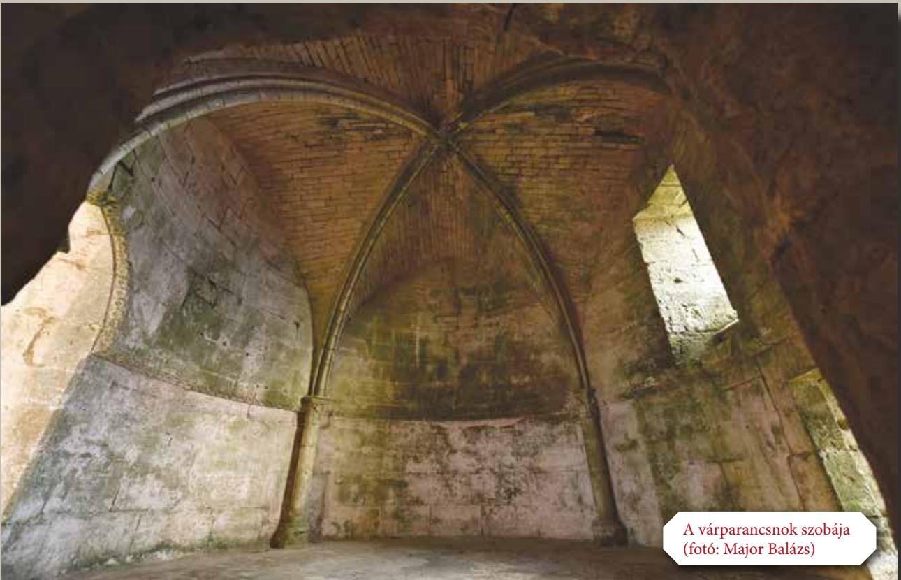
A várparancsnok szobája

A belső várfalgyűrű több mint 25 méterrel magasodott a külső udvar szintje fölé, de a legkönnyebben támadható déli oldal faltömbjeinek és tornyainak magassága meghaladta a 30 métert is. Ezeket az óriási falsíkokat gigantikus falrészűk támasztották meg. A déli és a nyugati falak előterébe épült úgynevezett glacis meredek rézsűi nemcsak az ostromgépek lövedékei, de a térségben gyakori földrengések ellen is hatékonyan védtek. Mivel ezekben is futott egy lőrésekkel ellátott védőfolyosó, és a bennük levő termekből is nyíltak további lőrések, a déli oldalon összesen hat szintről lehetett tűz alá venni az ellenséget. A lőrések egy része eleve messzirehordó dárdavető gépek kilövőnyílásának készült. A déli oldalon a külső és belső várfal között egy gigantikus, sziklába vágott ciszterna is helyet kapott, ami békeidőben elsősorban a vár állatállományának vízszükségleteit fedezte.