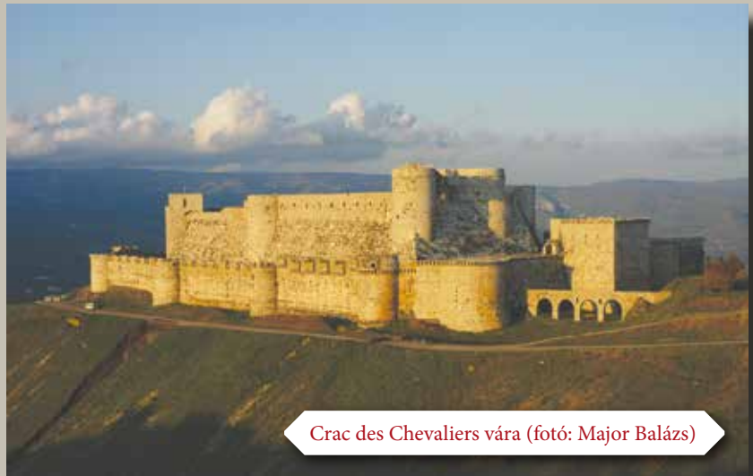
Crac des Chevaliers vára

A johannitának vagy ispotályosnak is nevezett rend első várai kezdetben igencsak vegyes képet mutattak. E képet nagyon sokszor meghatározták az általuk átvett korábbi erődítmények építészeti elemei és a terepviszonyok. Az egyik olyan korai erődítés, ahol a rend saját maga kezdte meg az építkezéseket, a mai Libanon területén fekvő Coliath (Qal'at Qulay'át) vára volt. Itt a 12. században egy szabályos négyzetes alaprajzú vár épült a kerítőfal vonalából alig kiemelkedő sarok- és oldalazótornyokkal. Ezek egy részét később korszerűsítették, és kijebbolták