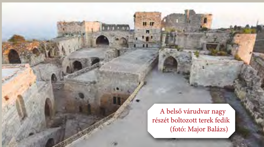
A belső várudvar nagy részét boltozott terek fedik

A 13. században a kereszties államok fennmaradásukat jórészt a lovagrendeknek (a johannitáknak, a templomosoknak és a teutonoknak) köszönhatték. Európai birtokállományaik és az adományok révén csak ők tudták finanszírozni az új típusú, monumentális védelmi rendszerek kiépítését és fenntartását. A johannita rend elsősorban az északi területekre koncentrálna erőforrásait, ahol a helyi lakosság többsége is még keresztény volt. Itt