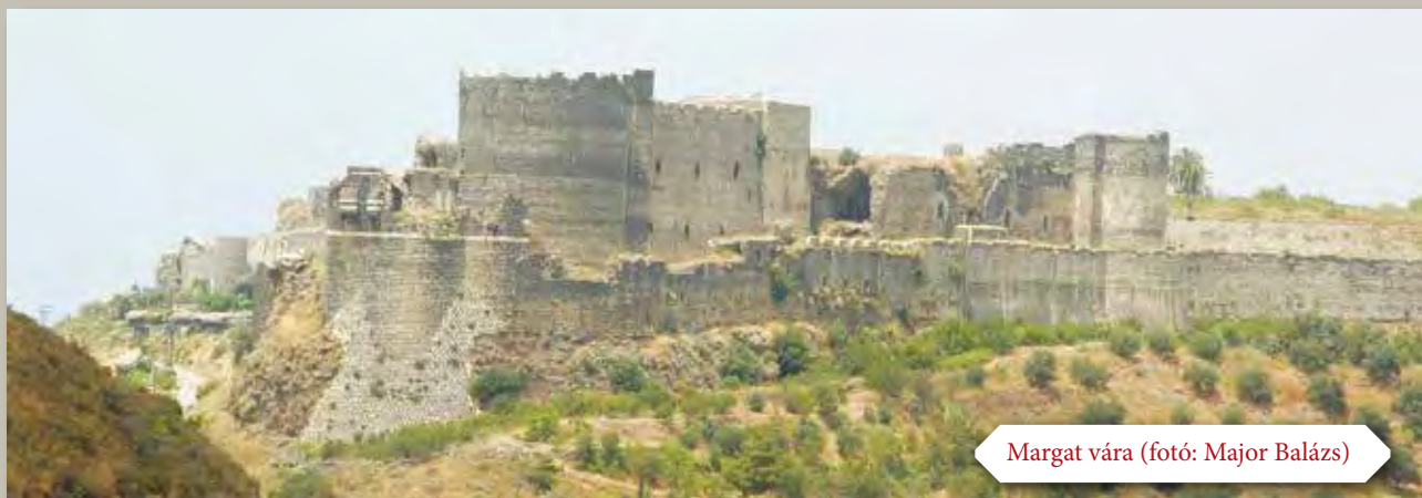
Margat vára

illusztrálja, hogy míg a vár maga egy vulkáni nyúlványra épült, a falfelületek túlnyomó többsége a távoli mészkőbányákban fejtett kváderkövekből épült.