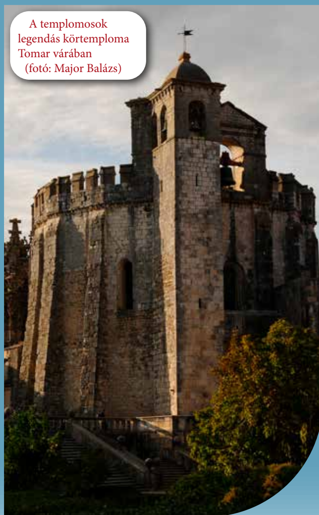
A templomosok legendás körtemploma Tomar várában

A legrövidebb várépítés (Chastellet/Vadum Jacob, ma: Gesher Benot Yaakov, Izrael) egyébként 5 hónapig tartott, bár maga a Jordán folyónál felépült vár is nagyon rövid életűnek bizonyult: Szaladin még az építés évében (1187) elfoglalta és részben lerombolta. Az egyik leghosszabb (át)építés pedig az említett Szafed erődjét jellemezte, amely egyúttal a legjobban dokumentált szentföldi várépítés-