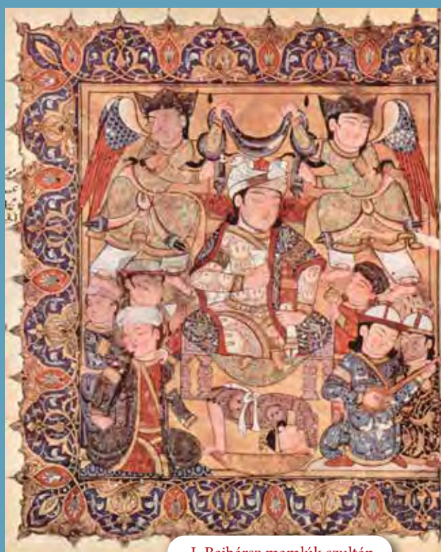
I. Bajbársz mamlúk szultán

nek is bizonyult. A vár eredendően még 1163 előtt épült, de Szaladin 1188-ban, sok más templomos és johannita erődítménnyel együtt elfoglalta, és védműveit vélhetően lerombolt(atta). Ahogyan a Zarándokvár felépítésére az V. kereszties hadjárat, illetve az azt övező felbuzdulás kínált lehetőséget, Szafed helyreállításának pénzügyi fedezetét a bárók kereszties hadjáratával (1239–1241) felerősödő mozgalom segített előteremteni. Az általános fellendülésen túl azonban egy konkrét támogatója is akadt a rendnek Aignan-i Benedek prelátus személyében. Marseilles püspöke az 1239–1240-es tűzszünet idején Damaszkuszba látogatott, és útja során meglátogatta Szafed romjait is. A látottak arra sarkallták, hogy hazafelé tartván Akkóban felkeresse a templomos nagymestert, és a rend generális káptalanját szólítsa fel a vár újjáépítésére. Bár direkt pénzügyi segítséget nem tudott ígérni, azt vállalta, hogy prédikációival győzi meg a zarándokokot, hogy adományaikkal vagy munkájukkal támogassák az újjáépítést. Pontosán nem rekonstruálható, hogy az önkéntes munkáskész volt-e elégtelen vagy más oka volt annak, hogy számos muszlim fogoly dolgozott az építkezésen, az bizonyos, hogy két évtizeddel később, amikor a püspök újra a Szent-