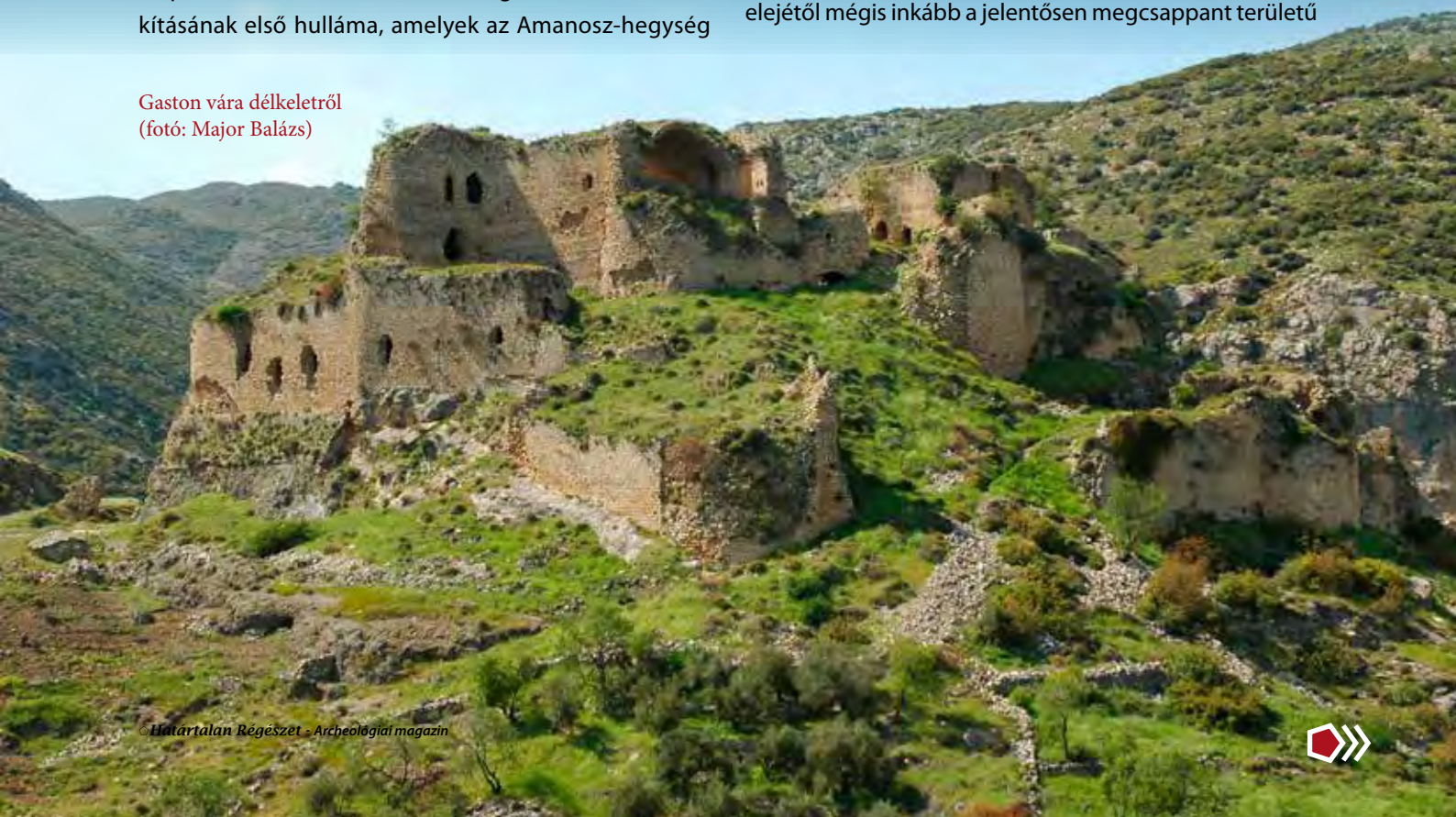
Gaston vára délkeletről

központjában olyan lakótornyokat emeltek, amelyek Európában már a 10. század vége óta épültek. A tehetősebbek már fallal is körbevették tornyaikat, sőt a régész szakma nagyjai úgy tartották, hogy a szentföldi várak a bizánci falak és az európai tornyok frigyéből jöttek létre. Ez tulajdonképpen a templomos várak esetében is megfigyelhető, hiszen az 1130-as évek végétől megjelenő objektumok elsősorban tornyok voltak, például a Jaffából Jeruzsálembé (pl. al-Burdzs, Kafr-rut), illetve onnan a Jordán folyóhoz vezető utak mentén (pl. Vörös ciszterna [ Cisterna Rubea ], ma: Bajt Dzsubr al-Tahtáni) emelt épületek. Ezzel egyidőben, tehát még az Edesszai Grófság (1098–1149) fennállásának utolsó éveiben indult meg északon a templomos várak (Roche Roussel [ma: Çalan, Töröko.], Darbsak [ma: Trapesak, Töröko.], Gaston [ma: Bağras, Töröko.]) kialakításának első hulláma, amelynek az Amanosz-hegység