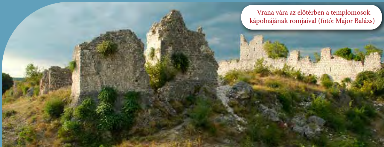
Vrana vára az előtérben a templomosok kápolnájának romjaival

nek is bizonyult. A vár eredendően még 1163 előtt épült, de Szaladin 1188-ban, sok más templomos és johannita erődítménnyel együtt elfoglalta, és védműveit vélhetően lerombolt(atta). Ahogyan a Zarándokvár felépítésére az V. kereszties hadjárat, illetve az azt övező felbuzdulás kínált lehetőséget, Szafed helyreállításának pénzügyi fedezetét a bárók kereszties hadjáratával (1239–1241) felerősödő mozgalom segített előteremteni. Az általános fellendülésen túl azonban egy konkrét támogatója is akadt a rendnek Aignan-i Benedek prelátus személyében. Marseilles püspöke az 1239–1240-es tűzszünet idején Damaszkuszba látogatott, és útja során meglátogatta Szafed romjait is. A látottak arra sarkallták, hogy hazafelé tartván Akkóban felkeresse a templomos nagymestert, és a rend generális káptalanját szólítsa fel a vár újjáépítésére. Bár direkt pénzügyi segítséget nem tudott ígérni, azt vállalta, hogy prédikációival győzi meg a zarándokokot, hogy adományaikkal vagy munkájukkal támogassák az újjáépítést. Pontosán nem rekonstruálható, hogy az önkéntes munkáskész volt-e elégtelen vagy más oka volt annak, hogy számos muszlim fogoly dolgozott az építkezésen, az bizonyos, hogy két évtizeddel később, amikor a püspök újra a Szent-