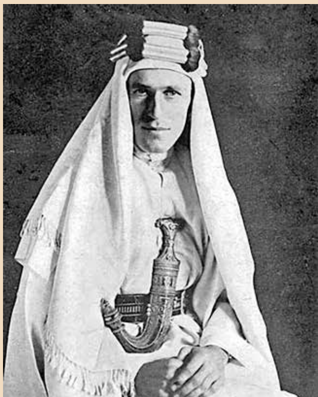
Arábiai Lawrence (Thomas Edward Lawrence), angol régész