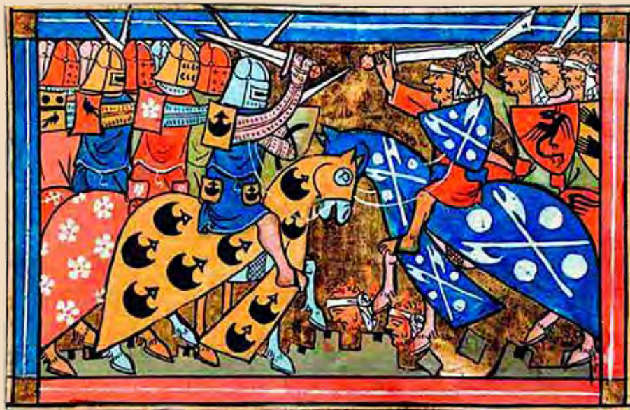
A második keresztes hadjáratot ábrázoló miniatúra (14. század)