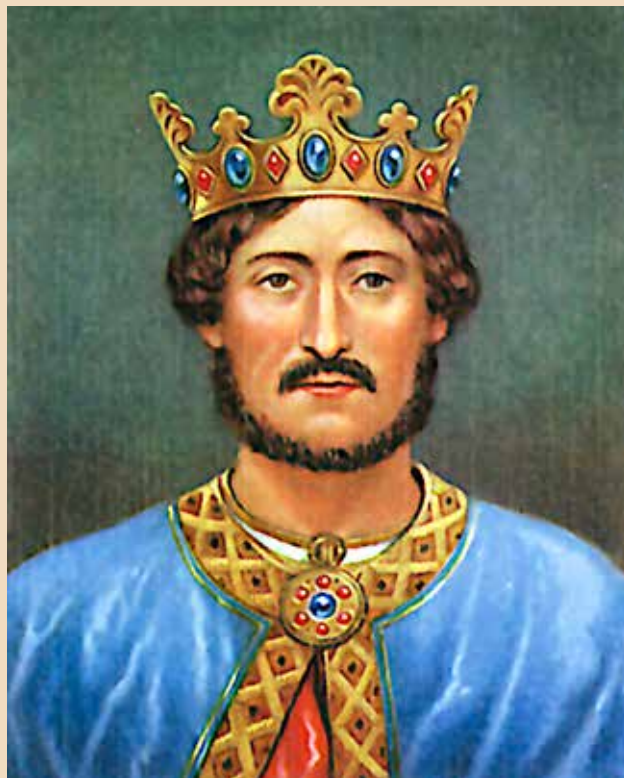
I. (Oroszlánszívű) Richárd (ur. 1189–1199)

Ugyanígy a hadjáratok, illetve a szentföldi keresztes jelenlét legnagyobb, legjelentősebb épített emlékei (zömmel a keresztések várai) voltak sokáig a régészeti érdeklődés középpontjában. Ugyanakkor, amikor az Európában található középkori várak és nagy egyházi építmények iránti érdeklődés megélnéült, akkor számolhatunk azzal is, hogy a szentföldi vagy a baltikumi épületek is érdekessé váltak. A 18–19. században számos esetben romantikus képzetek kapcsolódtak hozzájuk, más esetekben a nemzeti múlt gyökereit kezdték el bennük látni, mint például a Német Lovagrend hatalmas építményeiben. A várak, s különösen a hatalmas lovagrendi építmények viszont ebben a korszakban vagy az Oszmán-Török Birodalom területén helyezkedtek el, vagy a nyugati hatalmak gyarmati területeihez tartoztak. Az európai építmények pedig vagy az egyre erősödő birodalmak (így az egységesülő Németország, Oroszország) vagy az önállósulni vágyó nemzetállamok (Lengyelország, balti országok) területére estek. Így az első nagy kutatások, legyenek azok akár erődítmények, akár templomépületek, zömében ezen országok kutatóihoz kapcsolódtak. A francia, angol vagy német várkutatás például a saját területükön található erődítményekkel kapcsolatban tárgyalta a szentföldi vagy