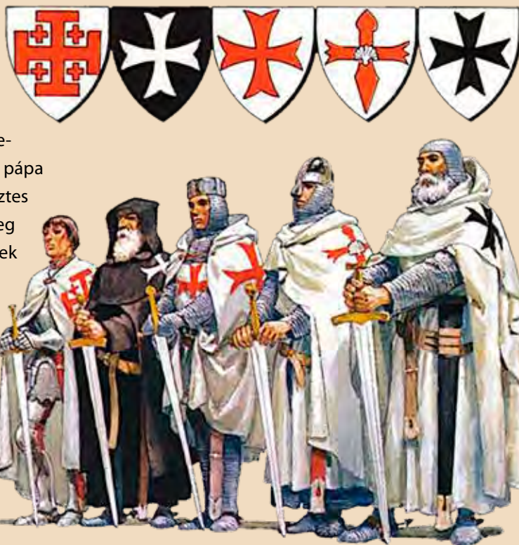
Lovagrendi egyenruhák (balról jobbra: Szent Sír Lovagrend, Máltai Lovagrend, Templomos Lovagrend, Santiago Lovagrend, Német Lovagrend)

Rögtön az elején érdemes azt leszögezni, hogy ez a két kifejezés (azaz a keresztes hadjáratok és a lovagrendek), bár szorosan összefügg egymással, valójában két külön dolgot jelentett abban a korban, amikor döntő szerepük volt a történelmi események sorában. A pápa által a 11. század végén meghirdetett első keresztes háború, majd az azt követő hadjáratok eredetileg az iszlám által elfoglalt szent területek és helyek visszafoglalására irányultak. De ezek a szent háborúk évszázadokon keresztül folytak, és nem csupán a Közel-Keleten, azaz a Szentföldnek nevezett „tengerentúli” részeken. Keresztes hadjáratokat számos más helyen is hirdettek (a Balkánon vagy Franciaországban különféle eretneknek nyilvánított mozgalmak ellen, a mai Spanyolország és Portugália területén a területet korábban megszálló muszlimok ellen vagy a Baltikumban egyes, „pogányok” tartott csoportok ellen), és a kései hadjáratok már a késő középkor vagy éppen a kora újkor időszakához tartoznak. Ezt azért is érdemes megjegyezni, mert a „keresztes régészet” alatt legtöbbször csak a korai hadjáratok által érintett, ma leginkább Izrael, Egyiptom, Libanon és Szíria területére koncentrált régészeti kutatásokat szokták érteni. Ugyanígy az úgynevezett „lovagrendek” fogalom mögött is többféle