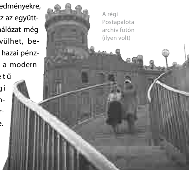
A régi Postapalota archív fotón (ilyen volt)

A hazai együttműködések mellett a múzeum már most élő kapcsolatokkal rendelkezik számos hasonló szemléletű külföldi szervezettel is. Az intézmény többek között évek óta részt vesz az európai jegybankok pénzmúzeumainak – ESCB's Money Museums Network – nemzetközi szakmai konferenciáin, és 2021 óta már a kontinens határain túllépve, a kambodzsai jegybank pénzmúzeumával (SOSORO Museum) is szoros partneri kapcsolatot ápol. Tekintettel a kezdeti eredményekre, a jövőben ez az együttműködési hálózat még tovább bővíülhet, bekapcsolva a hazai pénzmúzeumot a modern sz e m l é l e t ű g a z d a s á g i oktatás nemzetközi vérkeringésébe.