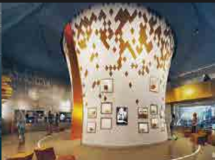
Látványtervek a kiállításról – A terveket készítette az MD Stúdió / NARMER Építészeti Stúdió. » A képek megjelenítése az MNB-Ingatlan Kft. hozzájárulásával.

a kiállítás bejárása után a látogatók valódi ajándékokra válthatják be azokat, melyek a múzeumból való távozás után is segíthetnek ébren tartani a megszerzett tudást és az átélt élmények emlékét.