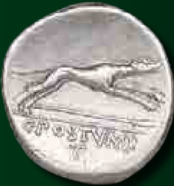
C. Postumius dénár, Kr. e. 74