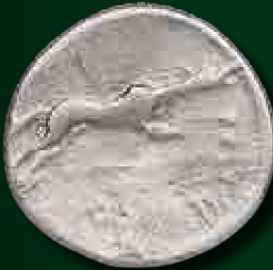
C. Postumius dénár eraviscus utánzata