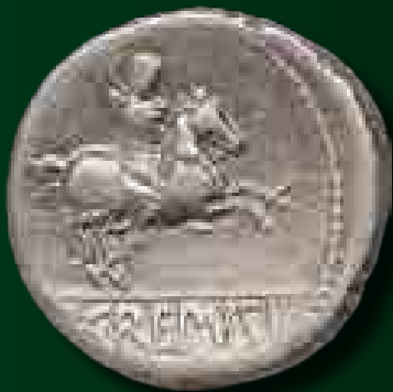
P. Crepusius dénár, Kr. e. 82