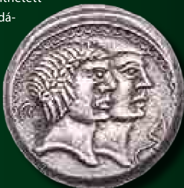
Boius hexdrachma előlapja