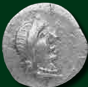
Eraviscus quinarius előlapja