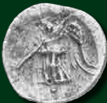
Eraviscus quinarius hátlapi típusai