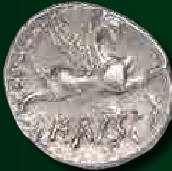
L. Papius dénár eraviscus utánzata