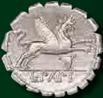
L. Papius dénár, Kr. e. 79