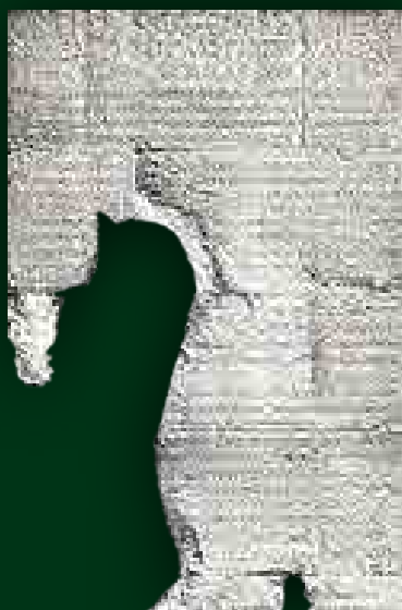
A Res gestae , Augustus saját beszámolója tetteiről, legteljesebb szövege egy Ankarában előkerült kőtáblán ( Monumentum Ancyranum ) maradt fenn