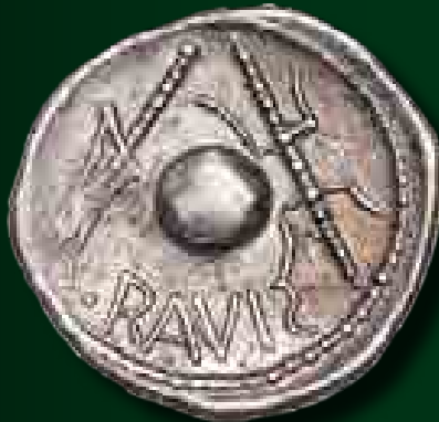
Cornelius Lentulus dénár eraviscus utánzata