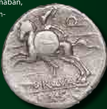
L. Manlius Torquatus dénár, Kr. e. 113/112

A kutatás azt feltételezi, hogy Róma valamiféle szövetségi viszonyt létesíthetett az eraviscusokkal Augustus uralkodása idején, és a törzs ennek fejében pénzbeli támogatást is kapott, majd az így kapott római pénzek mintájára kezdett el saját pénzerméket is veretni. Az eraviscus pénzek egyébiránt főként kisebb-nagyobb kincsleletekben kerülnek elő, településekről nem ismerjük őket. Úgy tűnik, ezek a pénzek a törzs belső pénzforgalmában