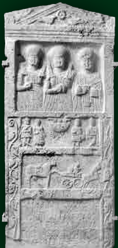
Eraviscus sírsztéle Demiuncus és családja számára, Magyar Nemzeti Múzeum

Az eraviscusokról a római történészi Tacitus azt írta, hogy a Duna túlsó partjáról költöztek ismert lakhelyükre egy osus nevű törzs szomszédságából. Sajnos az sem teljesen egyértelmű, hogy ők, mármint az osusok pontosan hol is laktak. Ezért az eraviscusok esetében éppúgy szóba jöhet egy észak–déli irányú, mint ahogyan egy keletnyugati vándorlás is: az eraviscusok tárgyi emlékműve, főként a női viselet alapján – egyesek vélekedése szerint – nyugat felől, a Lajta vidékről érkeztek. A törzs nevének araviscus változata alapján pedig az Arrabo (Rába) folyó környéki eredeti lakhely is felvetődött. Annyit azonban állíthatunk, hogy korábban a Dunántúl északi felét is uráló boius törzs fennhatósága alá tartoztak, akiknek központja