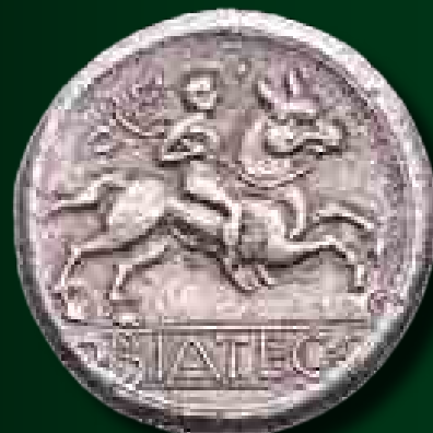
Boius hexdrachma hátlapja BIATEC felirattal