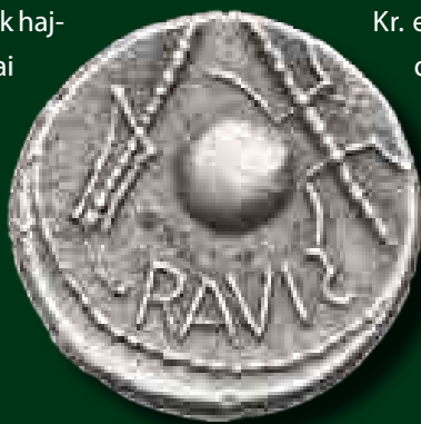
RAVIS feliratos eraviscus dénár

Az, hogy honnan és mikor érkeztek ide, homályba vész. Annyi bizonyos, hogy a már egyértelműen hozzájuk köthető régészeti emlékműanyag a Kr. e. 1. század közepe táján jelent meg a Dunántúlon. Elsősorban telepeiket ismerjük, köztük a Gellért-hegyen egykoron állt oppidumot (városias jellegű erődített település). A hegyen végzett sok-sok újkori építkezés miatt sajnos csak néhány apró nyoma őrződött meg az egykori erődített telepnek, amelyet lakói a római előrenyomulás időszakában békés körülmények között hagytak el (és ahonnan az eraviscusok végül különböző kisebb településekre költöztek). A Kr. u. 1. század első évtizedeiben a római jelenlétnek a Dunántúlon még alig van nyoma, noha Augustus (ur.