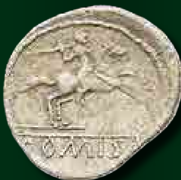
DOMISA feliratos eraviscus dénár