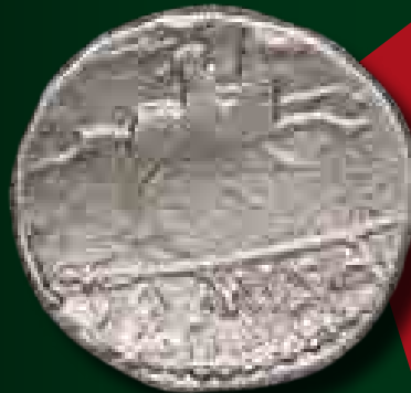
P. Crepusis dénár eraviscus utánzata

egy, a mai Pozsony területén található oppidum volt, amely valamikor a Kr. e. 1. század közepe táján háborús pusztítás áldozatául esett, amit rendszerint a dák előrenyomulással hoznak összefüggésbe.