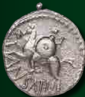
L. Manlius Torquatus dénár eraviscus utánzata