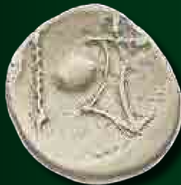
Eraviscus dénár kései változata