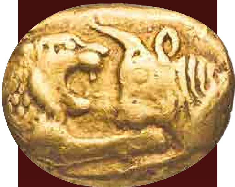
Lüd aranypéNZ, Kr. e. 6. század