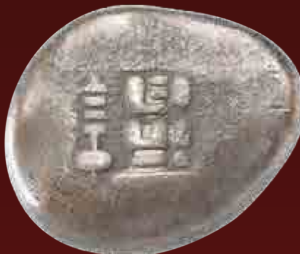
Babszem méretű „Mametta gin” elnevezésű japán fizetőeszköz ezüstitből, 19. század

Ezekből a feliratos öntvényekből a burmai és sziámi határra vezető út mentén kerültek elő példányok. A kínai feliratok egyike a kibocsátó bankházat nevezi meg, egy másik az ezüst elsőosztályú finomságát jelzi, míg egy harmadik arra utal, hogy szabadon átruházható, vagyis forgalomképes.