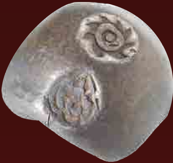
Tikálnak nevezett ezüstpénz Sziámból. A tikálok különféle méretben készítették. A bemutatott 15 grammos ezüstgömböcske a nagyobbak közül való. Felületén hitelesítő pecsétet helyeztek el