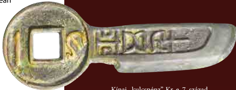
Kínai „kulcspénz”, Kr. e. 7. század

A fémekről mint fizetőeszközzel a legkorábbi forrásaink az ókori Mezopotámiából ismertek az Kr. e. 3. évezredből. Mezopotámiában az ezüstöt lemérték, majd pénzként való egyszerű használatát a központilag kialakított súlymértékegységek alapján tették lehetővé. A legkisebb mértékegység az árpaszem súlyaként meghatározott 0,04675 gramm volt, azután a 180 árpaszem súlya, a siklus (8,416 gramm), majd a 60 siklus , a mina (505 gramm) és a 60 mina , a talentum (30,3 kg). Hammurapi híres törvénykönyvében (Kr. e. 2. évezred első fele) ezekkel a súlyegységekkel fejezték ki a különféle szolgáltatásokért megfizetendő ezüst mértékét is. Egy orvosi műtétért például 10 siklus ezüstöt kellett fizetnie egy szabad embernek. A súlyegységek alapját képező árpaszem azt mutatja, hogy a gabonának is értékmérő szerepe volt Mezopotámiában, ahol az adónak terményben való be-