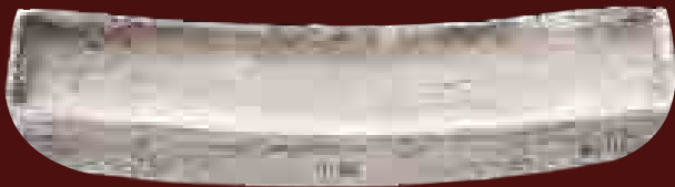
Csónak alakú ezüstrúd a Mekong folyó völgyéből, 19. század

A legszebb karkötőket Nigériából és Kongóból ismerjük. Ezeken a területeken a karkötők mellett a szövet is sokáig megmaradt fizetőeszköznek. Egy köpeny öt karkötőbe került.