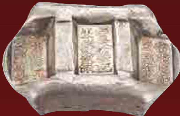
Kínai málhanyereg alakú ezüstöntvény, 19. század