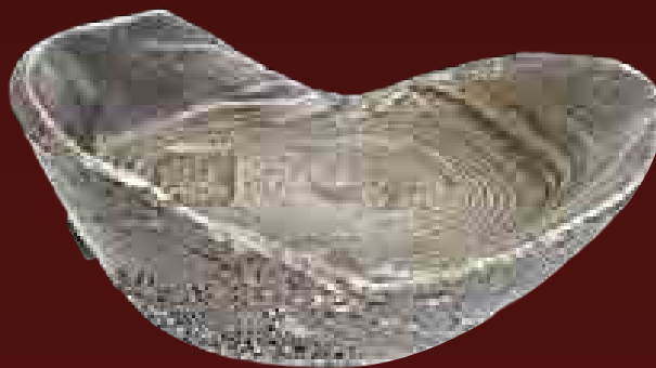
Kínai „cipópénz”, 19. század