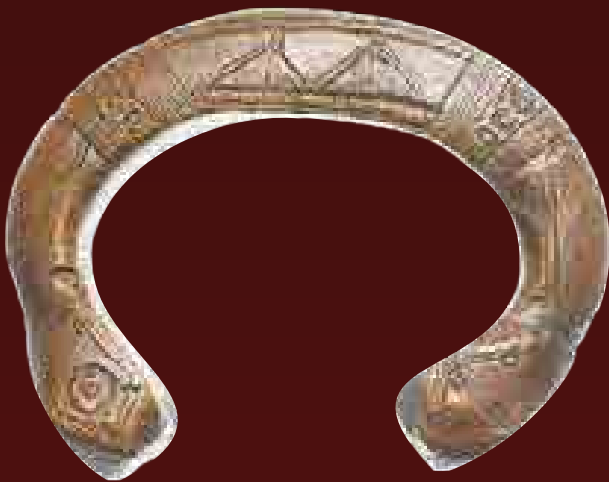
Bronzból készült karperec-pénzek Afrikából, 19. század