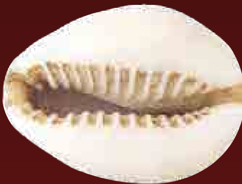
Kauri péNZ, 19. század

A Magyar Nemzeti Múzeumba 1861-ben kerültek be először kauri (azaz tengeri csiga) pénzek. A képen bemutatott példányt tizenheted magával Duka Tivadar, az 1848–49-es szabadságharc emigráns tisztje gyűjtötte Indiában, ahol mint brit katonáorvos dolgozott. Onnan küldött kaurikat Budapestre, azzal a megjegyzéssel, hogy Bengáliában (a mai Bangladesben) ezeket használják pénzként.