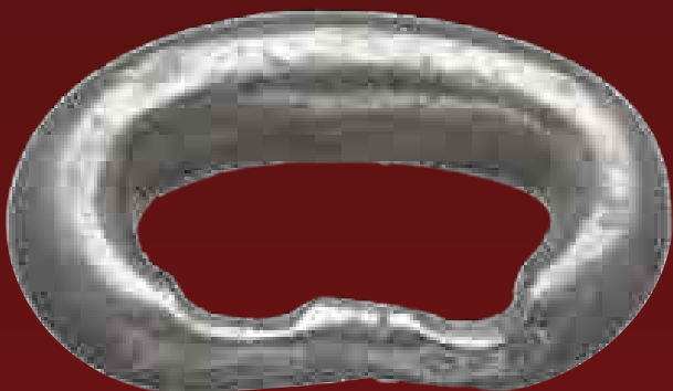
Kisméretű, 3,6 gramm súlyú ezüst karikapénz Jáváról, 19. század

A legszebb karkötőket Nigériából és Kongóból ismerjük. Ezeken a területeken a karkötők mellett a szövet is sokáig megmaradt fizetőeszköznek. Egy köpeny öt karkötőbe került.