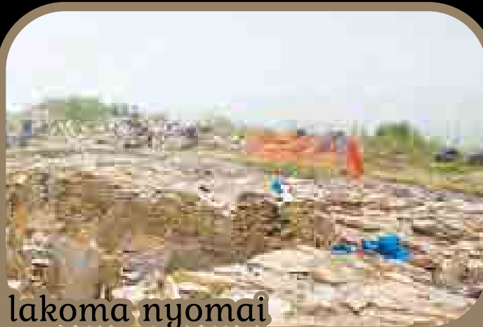
Egy lakoma nyomai

Orkney-szigetekhez tartozó South Ronaldsayn folyó ásatások során egy olyan gödröt találtak a régészek, melyben több mint 18.600 kagylóhéj feküdt. Ez a rengeteg kagyló valószínűleg egy nagyobb, közösségi lakoma része lehetett. A kagylókat megfőzték, majd a hús elfogyasztása után egy gödörbe dobták a héjakat. A lakomára – a radiokarbonos keltezés szerint – valamikor a Kr. u. 5–6. században került sor.