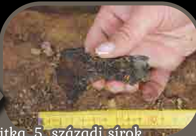
Ritka, 5. századi sírok Csehországban

(Csehország) közelében 6 sírt tártak fel a régészek 2019-ben, melyek a Kr. u. 5. századra keltezhetőek. Sajnos közülük 5 sírt korábban kiraboltak, azonban az érintetlenül maradt temetkezésből gazdag leletanyag került elő. Arany és ezüst ékszerek mellett textil-, bőr- és szőr-memaradványok is megmaradtak; ezek a 35–50 éves korában elhunyt nő ruházatáról árulkodnak. A kirabolt sírokban egy kard, kések, agancsból készített fésűk, gyöngyök és edények maradtak ránk. Utóbbiak kémiai elemzése szerint főképp húst készítettek bennük.