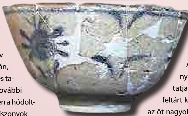
Perzsa fajanszcésze, Szekszárd-Új-Palánkról (16. század vége – 17. század)

dék került csupán elő, a közelben viszont, az oszmánok által épített Új-Palánkon azonban a hasonló jelentőségű településekhez képest jóval nagyobb számú porcelán- és fajanszleletanyagot rejtett a föld. Az edények összetétele nagyjából megfelel a budavári palota területén feltártaknak, tehát nem a legkiemelkedőbb és legdrágább darabok fordultak elő ezeken a helyeken, sokkal inkább a könnyebben hozzáférhető, valószínűleg olcsóbb tömegárunak tekinthető típusok, ami arra utal, hogy a különböző társadalmi csoportok esetleg különböző „árkategóriájú” edényeket engedhettek meg maguknak. Mindettől függetlenül a keleti díszkerámiát általában „luxuscikként” tartja számon a régészet, ugyanakkor valódi presztízsértékét nem ismerjük pontosan. Kétségtelen, hogy az átlagos kerámiatárgyknál nagyobb értékkel bírhattak, amit jól mutat egyrészt az is, hogy nincs minden lelőhelyen belőlük, másrészt régészeti bizonyítékai vannak annak is, hogy ezeket az edényeket néha megjavították, ha eltörtek. A magas minőségű izniki edények egykori magas értékét mutatja az Esztergom Vízivárosában feltárt kincslelet is. Ebben az esetben az öt nagyobb és két kisebb, 16. századra keltezhető izniki tányért egy faládba zárva rejtette a földbe a tulajdonosa, valószínűleg azzal a szándékkal, hogy később visszatér értékét, amit valamiért már nem tudott megtenni, így talál-