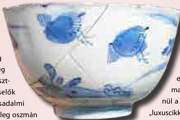
Kínai porceláncsésze, Szekszárd-Új-Palánkról (16. század vége – 17. század)