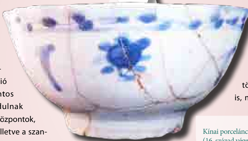
Kínai porceláncsésze a budavári palotából (16. század vége – 17. század eleje)

déli részében pedig a katonaság telepedett meg. Ezen írásos forrásokból ismert helyzetnek megfelelően a porcelán- és a fajansztöredékek megoszlása is, melyek közül a leletek,