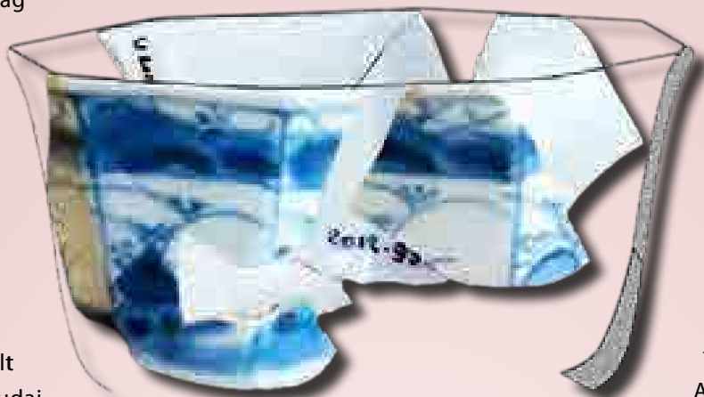
Nyolcszögletű kínai porceláncsésze az egri várból (17. század)

Ezt a képet némileg árnyalja viszont Szekszárd, ahol a város területéről elenyésző mennyiségű töre-