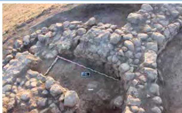
A kör alaprajzú torony nyugatról