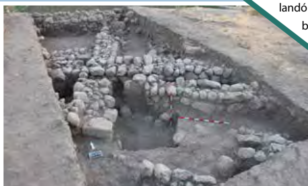
Több periódushoz tartozó falazatok az erőd területén