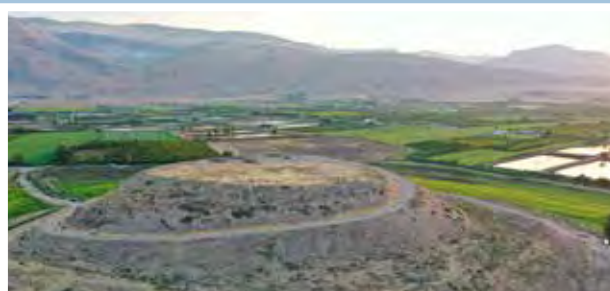
A domb tetejéről nyíló kilátás