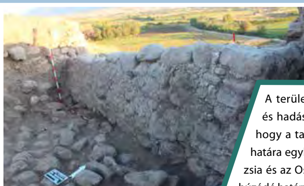
A korai erődfal a keleten megfigyelt falsarokkal