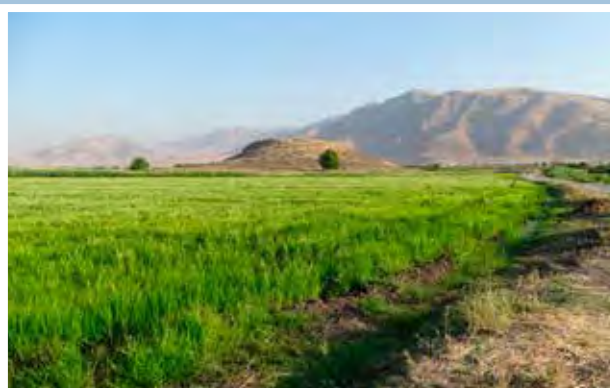
Grd-i Tle látképe délről

Ehhez a két erőd falhoz igazodtak a négy rétegbe sorolható épületmaradványok. A korábbi erőd falhoz az első periódusban két, arra merőleges épület tartozott. A második periódusban ezeknek a helyén, jobb megtartású falakkal alakították ki két újabb struktúrát. A fiatalabb erőd fal felépítése után az épületek elrendezésében jelentős változás állt be, ugyanis ezekben a rétegekben a körítőfallal párhuzamos falazatokat figyelhetünk meg, melyek lehetséges, hogy nem külön épületekhez, hanem egy második védelmi vonalhoz, avagy egy belső udvarhoz tartozhattak. Az egyik falon még egy egyértelműen azonosítható bejárat is megfigyelhető volt. Ezen épületek könnyűszerkezetesek lehettek, melyeknek csupán szárazon, illetve agyagba rakott kő alapozásait találtuk meg. Mivel ezek stabilitása nem volt igazán nagy, nem meglepő, hogy ezeket többször megújították és átalakították, ami magyarázza, hogy az építési rétegek miért követik ilyen szorosan egymást. Emellett az is megfigyelhető volt, hogy a későbbi épületekhez a korábbi épületek köveit is felhasználták, több helyen visszabontották azokat, vagy később gödröket ástak rá a korábbi falakra, hogy építőanyagot szerezzenek. Fontos megemlíteni, hogy a nagyszámú feltárt kemence alapján valószínűleg az erősség lakó- és főzőegységét is sikerült megtalálnunk.