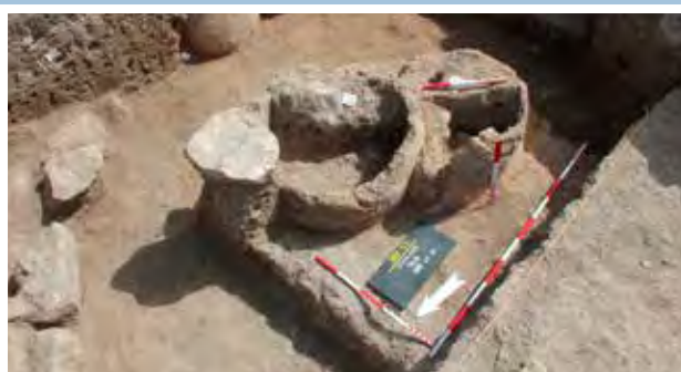
Az erőd területén feltárt kemencék

A területnek nagy történelmi és hadászati jelentőséget ad, hogy a tartomány déli és keleti határa egybeesett a Szafavida Perzsia és az Oszmán Birodalom között húzódó határvonallal: míg keleten a Zagrosz több ezer méteres vonulatai természetes elválasztóvonalat képeztek a birodalmak között, addig délen egy oszmán erődítérendszer biztosította a terület állandó védelmét a perzsa betörések ellen.