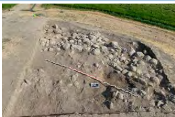
Az erőd fal a feltárárs kezdetén