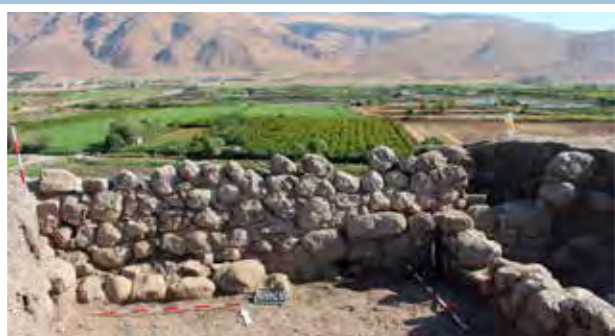
A későbbi erődfal déli irányból