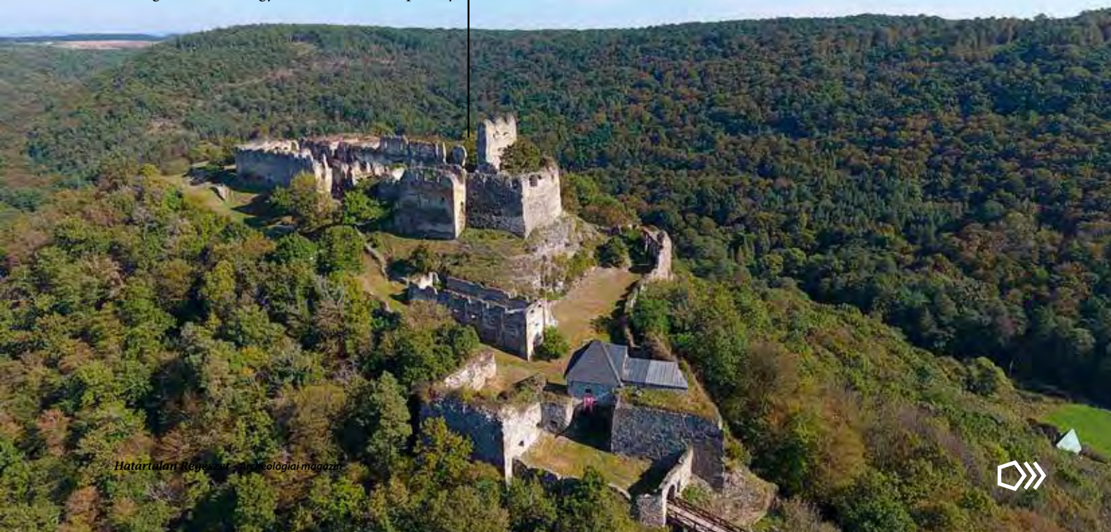
Csábrág vára

A két csoport két különböző kályhára enged következtetni, amelyek azonban – az előkerült darabokat tekintetbe véve – igencsak töredékesek. Az első csoportban párkánycsempem sem ismert, így az egykori tüzelőberendezést nemigen lehet rekonstruálni. A második csoporttal már szerencsésebbek vagyunk, de ezek a típusok is nagyon töredékesek. Az előkerült darabok alapján csupán egy sematikus rekonstrukciós rajz készíthető, hogy hozzávetőlegesen elképzelhessük, milyen kályha is állhatott egykor a 16. századi csábrági várban.