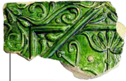
Négyzetes csempe Szécsényből, a csábrági típus párhuzama