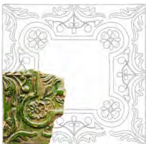
Négyzetes csempe Csábrágból, II. csoport (fotó, rajz: Rakonczay Rita)