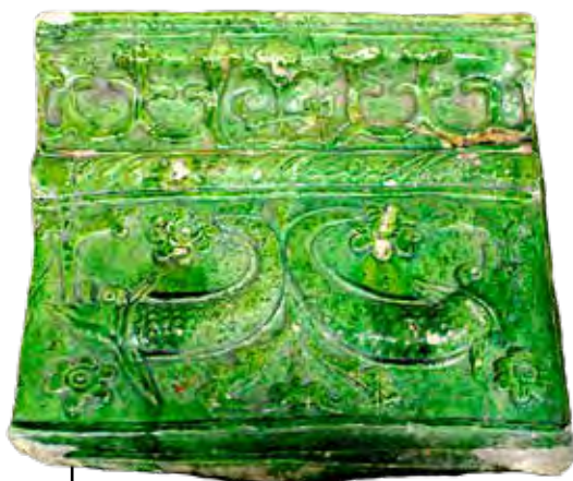
Delfines koronázópárkány Egerből