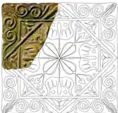
Négyzetes csempe Csábrágból, II. csoport (fotó, rajz: Rakonczay Rita)