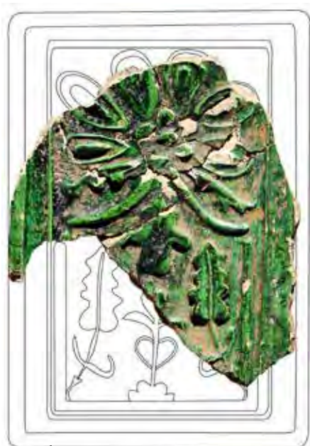
Téglalap alakú csempe Csábrágból, I. csoport (fotó, rajz: Rakonczay Rita)

Elsőként az egri vár ásatásai során figyeltek fel a Miskolci Miháli felirattal ellátott csempékre még a 20. század közepén. A feliratos darabok mellett megjelentek olyan csempék, amelyeken ugyan nem szerepelt a név, de stílusukban, formavilágukban hasonlítottak rájuk. Ezekre a kályhacsempékre jellemzőek a szimmetrikus növényi, valamint geometrikus díszítések, amelyeket zöld ólom-mázakkal fedtek, és fehér agyagból készültek. A levéltári kutatások jól kiegészítették az ásatások eredményeit, mivel a csempéken megjelent nevet az írott forrásokkal is össze lehetett egyeztetni. Miskolcon a 16. században több Fazekas Mihályt is említettek (a fazekas ekkor foglalkozásjelölő név volt), akik közül az 1570-es években működő Mihály nevű fazekast azonosították a kályhás mesterrel. Ezt elősegítette, hogy előkerültek 1574-es évszámmal ellátott kályhacsempék is, ami a forrásokból ismert Mihály működési idejére esik. Kezdetben tehát úgy tűnt, egyszerű a képlet: az előkerült kályhákat egy műhely, sőt egy mester, Miskolci Mihály készítette.