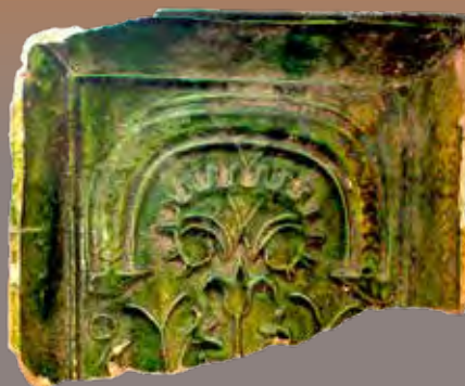
Miskolci Mihali feliratos kályhacsempe Eger várából (rajz: Rakonczay Rita)