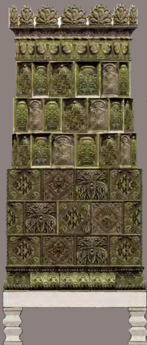
Téglalap alakú kályhacsempe Egerből