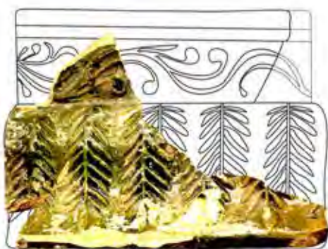
Párkánycsempe Csábrágból, II. csoport (fotó, rajz: Rakonczay Rita)