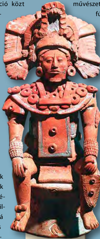
Maja uralkodó vagy helytartó szobra

Maják. Összeállította: Gimeno, D. Ford.: Kiss D. S. Nagy civilizációk sorozat. Kossuth Kiadó, Budapest, 2010. (A kiadás alapja: Grandes Civilizaciones de la Historia. Mayas. Editorial Sol 90, Barcelona 2008.)