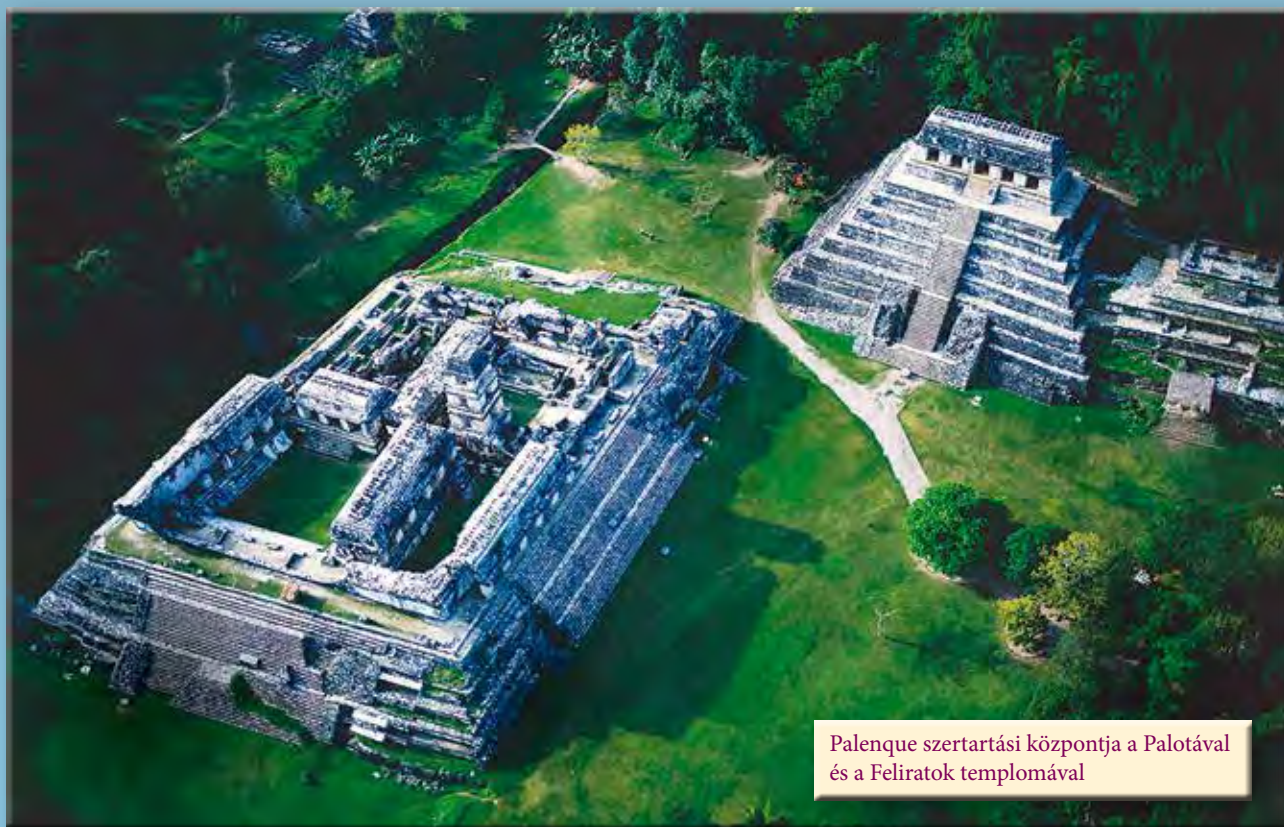
Palenque szertartási központja a Palotával és a Feliratok templomával

A történeti áttekintést követően a kötet a maja társadalommal foglalkozik. Más prehiszán társadalmakhoz hasonlóan, a maják is egymással jól meghatározott viszonyban álló, egymásnak alárendelt rétegekből épült fel, mely a preklasszikus kor végétől egészen a maja kultúra összeomlásáig konzerválódott. A maja társadalom rétegeinek jogait, mozgásterét ezért szigorú írott és íratlan szabályok határozták meg, melyek megsértése a vétkes mértéke szerint súlyos büntetést vont maga után. Vezető szerepet a katonai elit és a nemesség, valamint a papság játszott, de a legfőbb hatalom az uralkodók kezében koncentrálódott. A társadalomra oly jellemző hierarchia a hadsereg szerveződésében is tükröződött, melynek vezetője szintén az uralkodó volt.