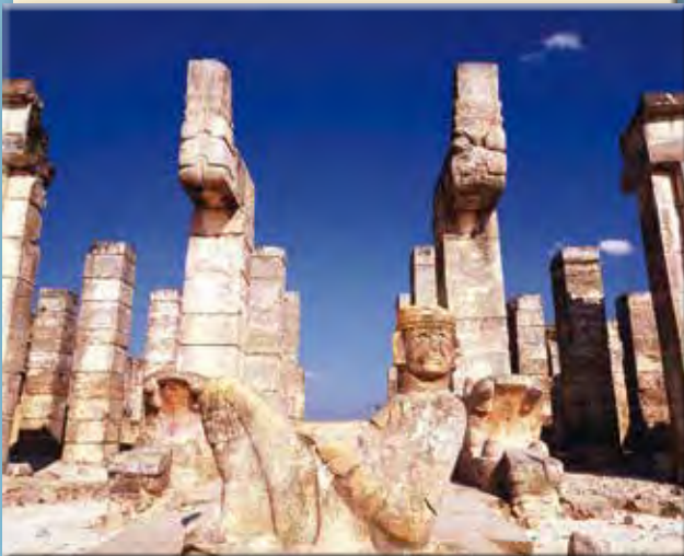
Chichén Itza, a szertartásoknak helyet adó Harcosok temploma

A társadalmi különbségek a viseletben is megmutatkoztak. A maja kódexek, falfestmények, domborművek és terrakottafigurák ábrázolásai szerencsére élethűen őrizték meg a maják egykori viseletét. Az előkelők a pamut textil mellett különböző nagymacskákból készült ruhákat hordtak, melyeket gyakran hímmel, madártollakkal is díszítettek. A státuszt, a rangot a rendkívül díszes és változatos fejfedőkkel is jelezték. Az ékszerek: a fogdíszek, a fül- és orrkorongok, a test különböző helyein viselt tűk, nyakékek legdrágább darabjai jádeközből vagy tengeri kagylókból készültek, később a könnyebben megmunkálható arany átvette ezek helyét. A nemesek fémékszereit a szegényebbek csontból vagy fából készült darabokkal utánozták.