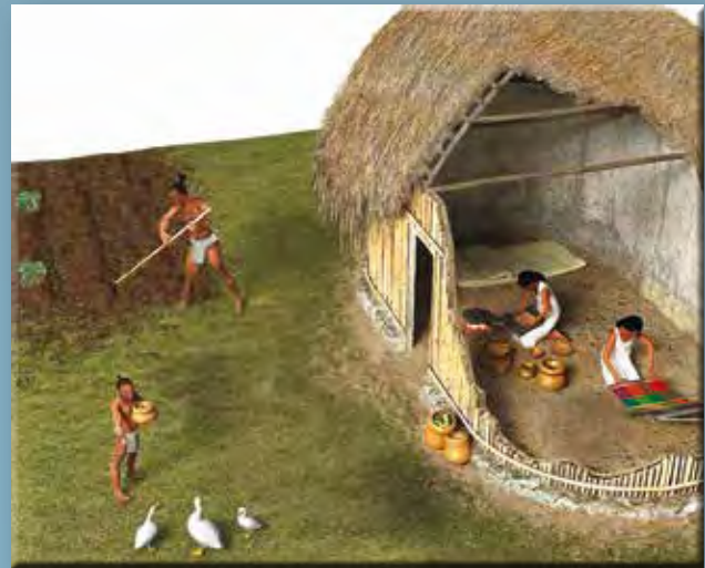
Egy maja ház rekonstrukciója

A ruházat és az ékszerek mellett nagy szerepe volt a tetoválásnak, testfestésnek is, ami szintén a társadalmi hovatartozás, a családi állapot és a hivatás mutatója, az uralkodóknál pedig a hatalom és a bölcsesség jelképe volt. A maja nők és férfiak csaknem a teljes testüket, a mellkast, a karokat és a lábakat harsány színekkel festették. E színek és egyszerű szimbólumok rengeteg információt nyújtottak. Ám voltak még extrémebb kifejezési módjai az előkelőségnek: mint a prekolumbián népeknél általában, elterjedt a koponyatorzítás szokása is, melynek fontos szerepe volt a maja társadalomban. Ez is az etnikai és társadalmi hovatartozás egyik jelzője volt. A különböző népcsoportok, országrészek és rivalizáló városok más-más megnyúlt fejformát alakítottak ki.