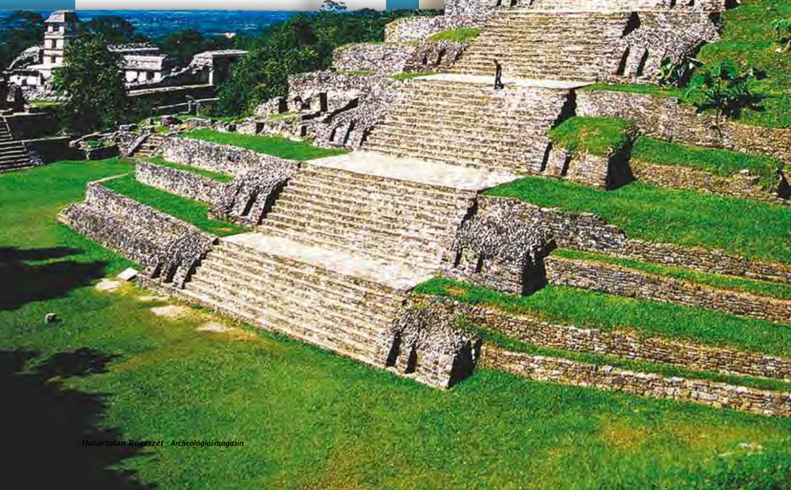
A palenquei lépcsős piramis