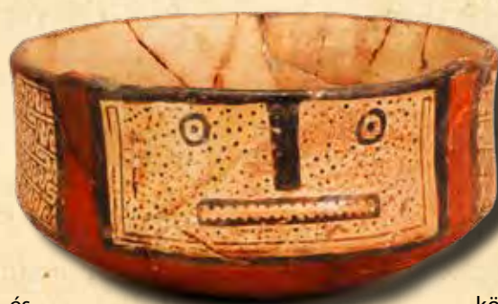
Rakovszky által begyűjtött chilei edény (Néprajzi Múzeum, ltsz.: 34588)

Ilyen körülmények között került sor a Donau látogatására, és vette rá a műemlékek és a gyűjtés iránt érdeklődő Rakovszky a Monarchia konzulját, hogy régészeti gyűjteményt vásároljon a bécsi múzeum számára. Az adományozás természetesen nem történt érdek nélkül, a rákövetkező évben a császár Ferenc József-érdemrenddel tüntette ki Wahlét, ami nyilvánvalóan jelentősen emelte presztízsét a távoli kis országban. Egy kitüntetés adományozása pedig a bécsi múzeum legolcsóbb módszere volt a gyűjteménye gyarapítására.