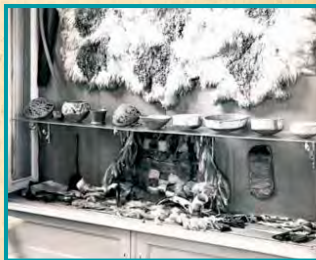
A Rakovszky által Chilében szerzett leletek a Nemzeti Múzeum Néprajzi Osztályának 1906-ban, a városligeti Iparcsarnokban megnyílt kiállításán

Azt itt elmondottak roppant mód jellemzik ezt a korszakot. A „nagy boom” korszakában a múzeumokba – beleértve a budapestit is – ezrével ömlöttek be olyan tárgyak, amelyeket nem szakemberek gyűjtöttek a terepen, és több közvetítőn keresztül, szinte minden információ nélkül vagy éppen hamis információkkal kerültek múzeumba. Erre az esetre is igaz tehát a „jereváni rádió híre”: azaz a gyűjtemény minden volt, csak nem kolumbiai, és