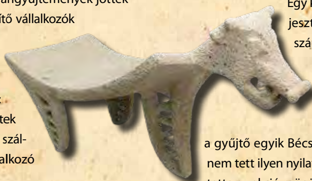
Díszes őrlőkő, ún. metaté Costa Ricából (Néprajzi Múzeum, ltsz.: 73.162.64)