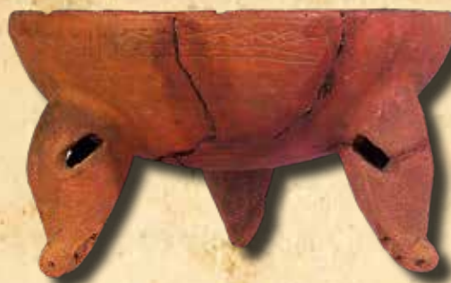
Háromlábú edény a Wahle-gyűjteményből (Néprajzi Múzeum, ltsz.: 35408)

Az egzotikus tárgyak, régészeti leletek iránti nyugati érdeklődés hullámát kihasználva a közép-amerikai kormányzatok saját kulturális örökségüket felhasználva törekedtek országuk nemzetközi elismertségének növelésére, olyannyira, hogy elnöki és miniszteri rendeletekkel engedélyezték a régészeti leletek exportját. A spanyol hódítás előtti múlt bemutatása a nemzetté válás részévé vált. Hasonló célokat szolgáltak a térség ezekben az években megalapított nemzeti múzeumai, és az országok bemutatkozása a különböző nemzetközi kiállításokon, az 1889-es párizsi világkiállításon, az 1892. évi madridi Exposición Histórico-Americana n, majd az 1893-as chicagói World's Columbian Exposition ön. Az Amerika felfedezésének 400. évfordulója alkalmából rendezett madridi kiállításon Costa Rica negyven vitrinben hétezer régészeti kerámiát, kőfaragványt stb. mutatott be.