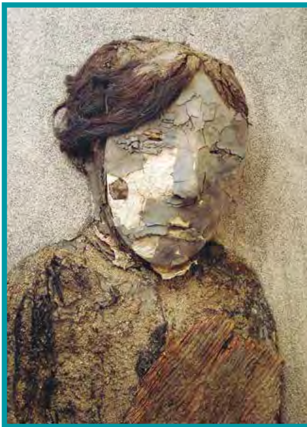
Konstruált chinchorro gyermekmúmia

Amikor egy chinchorro meghalt, a fejét leválasztották a testről, és mindkettőről lenyúzták a bőrt. Ezek után eltávolították a belső szerveket és a húst. A koponyából kiszedték az agyat és a szemeket. A kezeket és a lábakat, mivel ezeket igen nehéz megnyúzni, levágták, majd egészben kiszárították a megmaradt vázzal együtt. Ezek után nekiláttak a halottat „újraépíteni”. Ehhez ujjnyi vastag, megfelelő hosszúságú botokat használtak. Általában egyetlen, a gerincnél hosszabb botra húzták rá a koponyát, majd ehhez rögzítették a gerincoszlopot is. Ezután két hosszú botot rögzítettek a bokákhoz, amelyek végigfutottak a lábak mentén, át a medencén, fel a bordák között a nyak végéig. A karokat nádköteggel erősítették