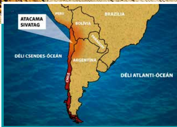
Chile és az Atacama-sivatag térképe

Az Atacama egy 100–160 km széles és 1000 km hosszú sivatag. Dacára, hogy a Csendes-óceán mentén húzódik, extrém szárazság jellemzi. A talaj sóartalma nagyon magas. Vannak részei, ahol több száz éve nem hullott csapadék.