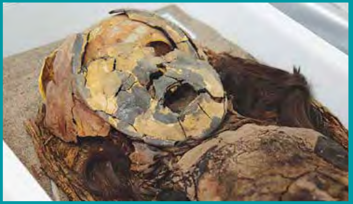
Konstruált chinchorro gyermekmúmia