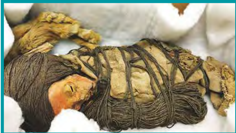
Konstruált chinchorro gyermekmúmia

A kecsua az Andokban élő indián nép, az egykori Inka Birodalom egykori uralkodó népe. Az aymarák talán még a kecsuáknál is ősbibb népcsoport, az utóbbiak hódították meg őket.