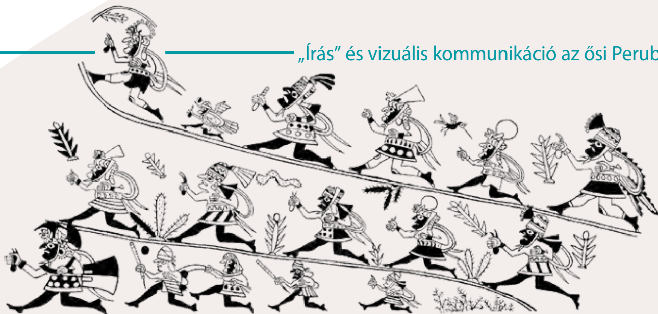
Futó alakok (Donna McClelland rajza a The Cleveland Museum of Art egyik moche kerámiájának ábrázolása alapján)

kontúrral megrajzolt figurákkal díszített edények, amelyek bepillantást engednek a moche ikonográfia összetett rendszerébe. Az ábrázolásokon megjelenített alakok a társadalom legkülönbébb szereplői, akik az interakcióikkal a közösség életéről, szokásrendszeréről vallanak. Többek között láthatunk szertartásokat, áldozati rítusokat, temetkezéseket, vadászatot, harcosokat csata közben, és nagyon sokszor feltűnnek futó férfiak is az edényeken. Rafael Larco Hoyle kutatásai alapján arra a következtetésre jutott, hogy ezek az alakok valójában a chasquik hoz hasonló hírnökök lehetnek, akik egymást követve, nagy sebességgel haladnak a legkülönbébb domborzatú terepeken. A mochica művészek a figurákhoz esetenként szimbolikus állati jellegeket is társítottak: madárszárnyakat kaptak, hogy szinte repüljenek, vagy a hátukból százlábúak törtek elő, ezzel is jelezvén, hogy számtalan lábuk kell ahhoz összehangoltan mozognia, hogy az üzenet célba érjen. Az alakok a kezükben kis méretű bőrszényt tartanak (az ásatásokon elő is kerültek ezekhez hasonló, cserzett lámabőrökből készített tarsolyok), amelyben Larco Hoyle feltételezése szerint az üzenet rögzítésére szolgáló tárgyakat, feltehetően babszemeket tároltak.