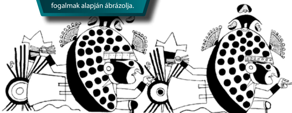
Babszem-harcosok (Donna McClelland rajza a Birmingham Museum and Art Gallery egyik moche kerámiájának ábrázolása alapján)

E babszemeket a morfológiájuk alapján a kutatók a pallaral (ejtsd: palyar, latinul Phaseolus lunatus , magyarul limabab vagy holdbab) azonosították, amely évezredek óta a perui partvidék élelmiszere az egyik legfontosabb terménye. A pallar különlegessége az, hogy a külső héja teljesen sima, és sok esetben fekete-fehér foltos mintázatot ölt. A babszemek a mochica edények gyakori díszítőelemei, s nemcsak a futás közben ábrázolt figurák körül tűnnek fel, de vallási és háborús kontextusban is megjelennek (akár harcosnak öltözött, antropomorf babszemek formájában is). Az ábrázolásokon a babszemeket természetesen és véletlenszerűen kialakult fekete-fehér foltok és mesterségesen bemetszett, illetve festett formák díszítik. Larco Hoyle összeállított egy regisztert a rendelkezésére álló moche edények ábrázolásairól, és arra a megállapításra jutott, hogy a mochicák számára a babszemek egyfajta mnemotechnikai szereppel bírtak: fogalmakat, gondolatokat tudtak rögzíteni velük, tehát ideografikus írásrendszert alkottak. A babszemeken tárolt információk megfejtése és értelmezése viszont csak a privilegizált/beavatott személyek számára volt lehetséges.