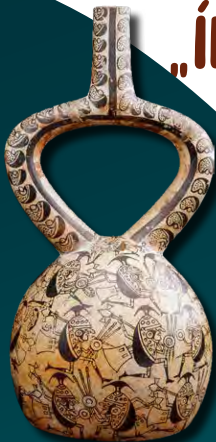
A bab-harcosok támadását ábrázoló edény, moche kultúra (The Art Institute of Chicago)