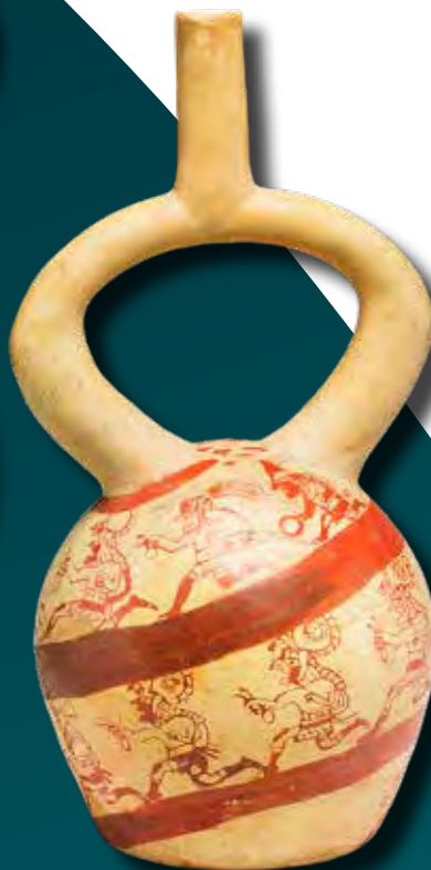
Futókat ábrázoló edény, moche kultúra (The Metropolitan Museum of Art, New York)