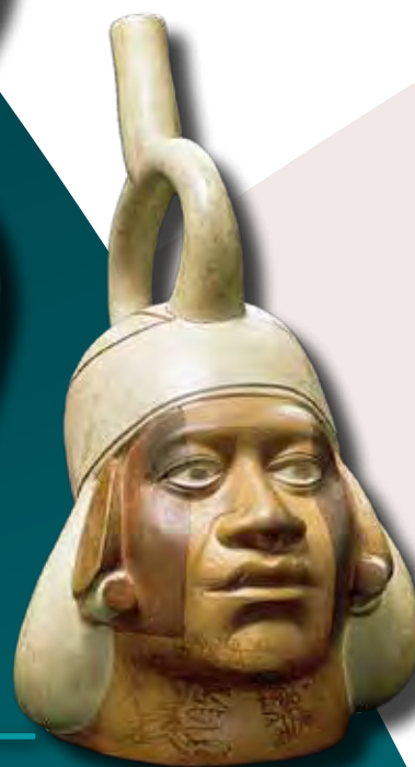
Portrédény, moche kultúra (Ethnologisches Museum Berlin)