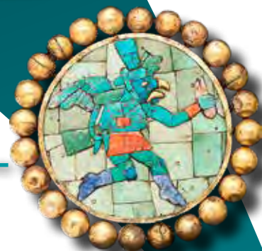
Futót ábrázoló fülédész, moche kultúra (The Metropolitan Museum of Art, New York)

Az írás az emberiség történetének az egyik legfontosabb és legnagyobb hatású vívmánya. Mérföldkő, amelynek segítségével lehetővé vált az információ tartós, időtálló rögzítése, az ismeretek és tapasztalatok átadása. A múlt eseményeinek megörökítése, a mítoszok, gondolatok, szabályok közvetítése a jelen és a jövő számára lehetővé teszi, hogy a kultúra, a tudomány és az ipar gazdagodjék és fejlődjék. A modern ember felfogása szerint egy népcsoport fejlettségének fokmérője az, hogy rendelkezett-e avagy sem írásnak tekinthető, grafikus jelekből álló jelrendszerrel.