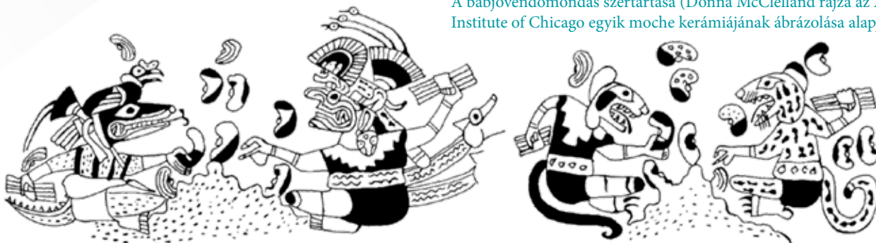
A babjövendőmondás szertartása (Donna McClelland rajza az Art Institute of Chicago egyik moche kerámiájának ábrázolása alapján)

Peru egyik legjelentősebb régészeti lelete volt a moche kultúrához tartozó „Sipán urának” 1987-ben feltárt, kivételesen gazdag sírja. A 35–45 év körüli férfi feltehetőleg uralkodó lehetett, akit négy férfi, három nő, egy gyermek kíséretében, mintegy 600 sírmelléklettel, köztük számos aranytárggyal és ékszerrel helyeztek egykoron végső nyugalomra.