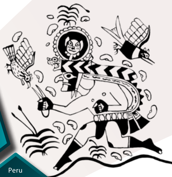
Futó alak erszénnyel a kezében (Donna McClelland rajza a The Cleveland Museum of Art egyik moche kerámiájának ábrázolása alapján)

tal a kerámiaakészítésben mutatkozott meg: az általában rituális célokat szolgáló edények és korsók változatosan és élénk vizuális kifejezőerővel tanúskodnak a mochicák hétköznapi életéről, vallási képzetéről és világnézetéről. Egyedinek mondhatók a megdöbbentő realizmussal elkészített szoborszerű portréedényeik is, amelyek nemcsak egyéni vonásokat, de arckifejezéseket is megörökí-