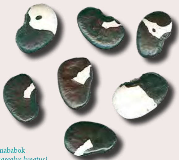
Límababok ( Phaseolus lunatus )

babszemekhez fordultak, amikor a politikai cselekedeteik szentesítéséhez az istenek hozzájárulását kérték, és akkor is, ha csak arra voltak kíváncsiak, milyen időjárás várható. (Az ún. El Niño éghajlati jelenség ugyanis bizonyos időközönként szélsőséges klimatikus viszonyokat idézett elő: túlzott szárazságot, erdőtüzeket vagy heves esőzéseket és árvizeket, szélviharokat okozott.)