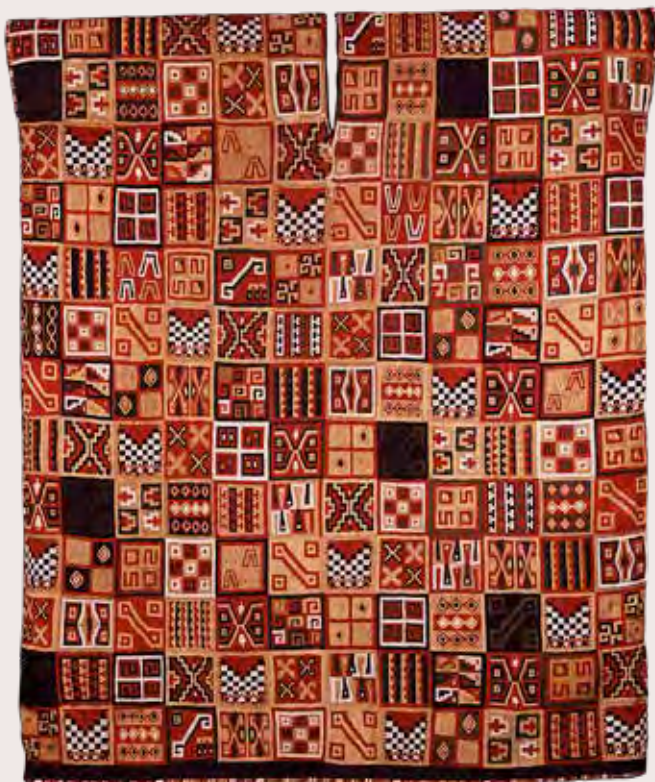
Tocapukkal díszített inka tunika (Dumbarton Oaks Library, Washington)

Bár Larco Hoyle elmélete kreatív és gondolatébresztő volt sokak számára, a moche kultúrával foglalkozó kutatók jelentős része nem fogadta azt el. Egyesek úgy vélekedtek, hogy a futóknak tartott, egymást követő alakok valójában táncosok, akik egy szertartás során rituális táncot lejtenek, mások úgy tartották, hogy egy, a termékenységgel összefüggő rituális versenyfutás résztvevői (hasonló azokhoz, amelyeket a krónikások szerint az inkák még a gyarmati időkben is rendeztek). Ugyanakkor egyes elméletek szerint a mochicák a mintás babszemeket jóslásra, és áldozati ajándékként is használhatták a termékenységi rítusok során. A vallási specialisták a babszemek segítségével meg tudták mondani, hogy mikorra várható, és mennyire lesz gazdag a termés. Ha a jóslat nem ígért bőséges termést, a babszemekkel rituális játékot játszottak, amelynek a célja az volt, hogy elősegítse a termények érését. A vallási vezetők akkor is a