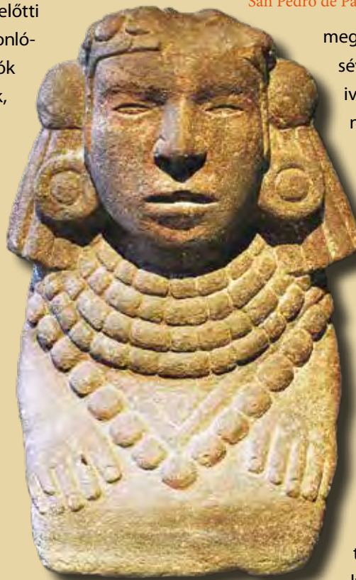
Tonantzin kőből faragott szobra (Museo Nacional de las Intervenciones, Mexikóváros)

meggyújtásával, a szentképek kihelyezésével, az áldozati ajándékkal és az imával. Az „istenek asztalán” gyakran színes papírokból kivágott emberszerű alakok is feltűnnek. Ezek az oltárhoz érkező természetfeletti lények képmásai, és abban segítik őket, hogy megtalálják a számukra kihelyezett felajánlást. Színük arra is utal, hogy a nahua univerzum melyik részéből érkeztek: a földről, az égből, a vízből, avagy a föld alatti világból. Az oltárokat felállíthatják a házban, a termőföldön, a forrásnál vagy éppen a hegyek tetején, ahova az esőistenek érkeznek.