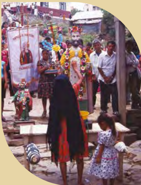
Egy körmenet során a forráshoz érve Szent Péter faszobrát vizes virágszirommal dörzsölik át, hogy felfrissüljön és legyen ereje dolgozni a faluért (a szerző felvétele, 1999)

Pachiquitlánban 1999-ben nyolc sámán dolgozott, mindannyian 50 éven felüli férfiak voltak, Nahuatlul tamatijketl („az a személy, aki tud, aki ismeretekkel rendelkezik”), illetve tepatijketl („az a személy, aki gyógyít”) kifejezéssel utaltak rájuk. Már születésükkor vagy gyermekkorukban feltűnhetnek olyan jelek, amelyek arra utalnak, hogy Isten erre a feladatra szánta őket (pl. vasárnap születnek, a családjuk által végzett rítusok alatt fel-