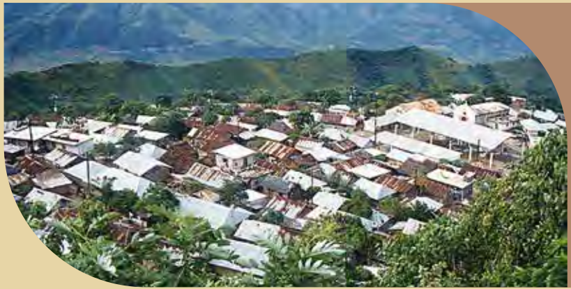
San Pedro de Pachiquitla látképe (a szerző felvétele, 2002)

A természetfeletti lényekkel való találkozás azonban sosem veszélytelen, és csak a tlamatijketl jelenléte adhat biztonságot. Ő képes arra, hogy szakrális teret hozzon létre az áldozati oltár kialakításával, a gyertya és a kopálgyanta füstölő