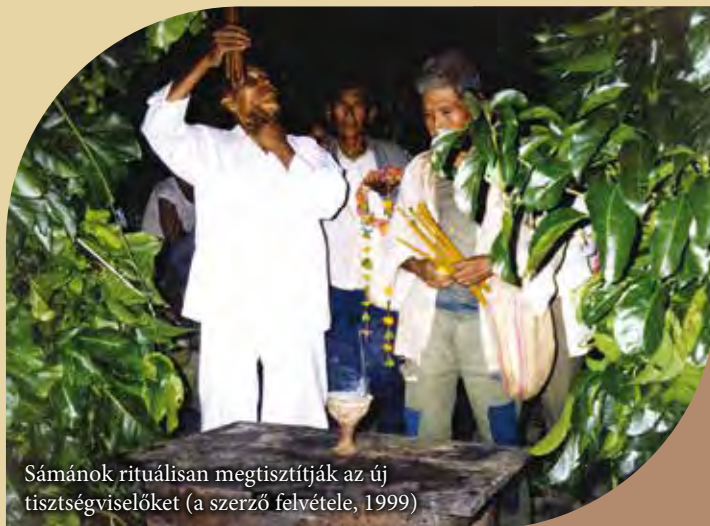
Sámánok rituálisan megtisztítják az új tisztviselőket (a szerző felvétele, 1999)

A helyiek szerint az orvosok csak a test betegségeit képesek meggyógyítani, a lélek betegségeit, melyek háttérben gyakran a természeti helyek őrzőinek vagy a halottak lelkeinek ártó tevékenysége áll, csak a sámán képes meggyógyítani.