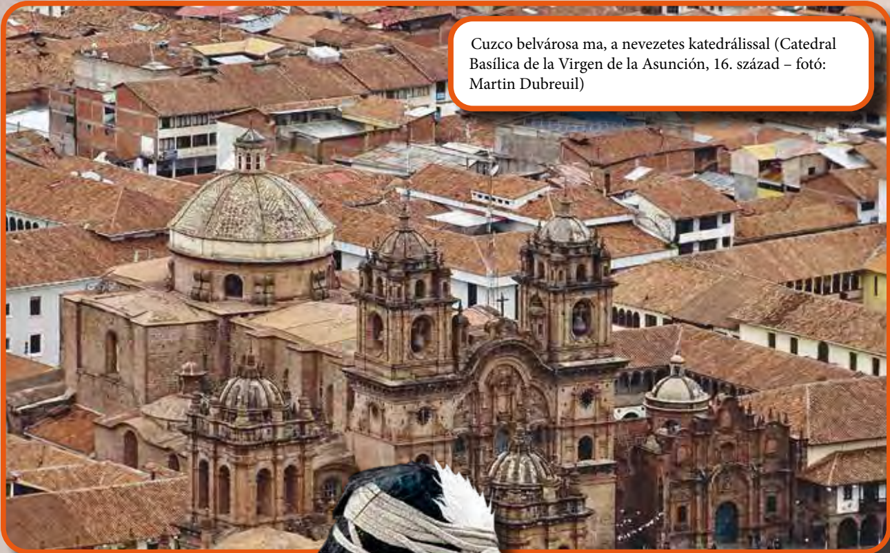
Cuzco belvárosa ma, a nevezetes katedrálissal (Catedral Basílica de la Virgen de la Asunción, 16. század)