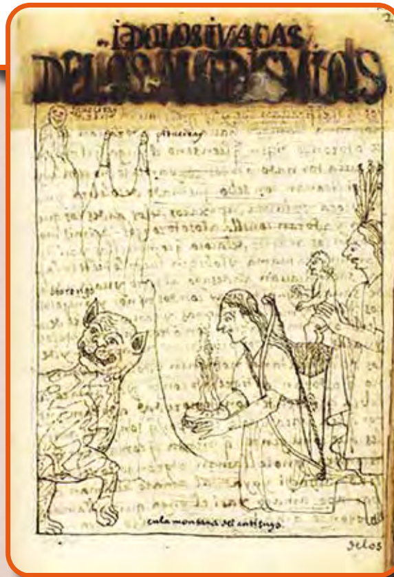
Gyermekáldozat az Otorongo nevű, puma alakú hegyi szellemnek – a hegycsúcsokról huacaszobrok figyelnek

Bár e szerzők egyike sem láthatott gyermekáldozatot a saját szemével – mindnyájan az Inka Birodalom bukása után születtek vagy kerültek Peruba –, mégis mind érintkeztek még olyanokkal, akik első vagy másodkézből be tudtak számolni e vallási gyakorlatról. Guaman Pomának sok száz naiv stílusú, fekete-fehér szabadkézi rajzot és kevert spanyol–kecsua nyelvű magyarázatot köszönhetünk a Pizarro előtti andoki kultúráról, vallási hiedelemvilágról, így egyebek mellett a gyermekáldozatról is; a gyermekáldozati színhelyeket feltáró Hernández Príncipétől pedig tudjuk, hogy a feláldozott és kis méretű föld alatti üregekben elhelyezett gyermekeket túlvilági közvetítőként használta a helyi közösség, melynek képviselője, a falusi vallási specialista – más néven „varázsló” ( hechizero ) – rendszeresen felkereste a feláldozottakat tanács vagy jóslat kérése céljából; végül Cristóbal de Molinától származik a gyermekáldozat központi, birodalmi megszervezésének szinte tudományos pontosságú leírása.