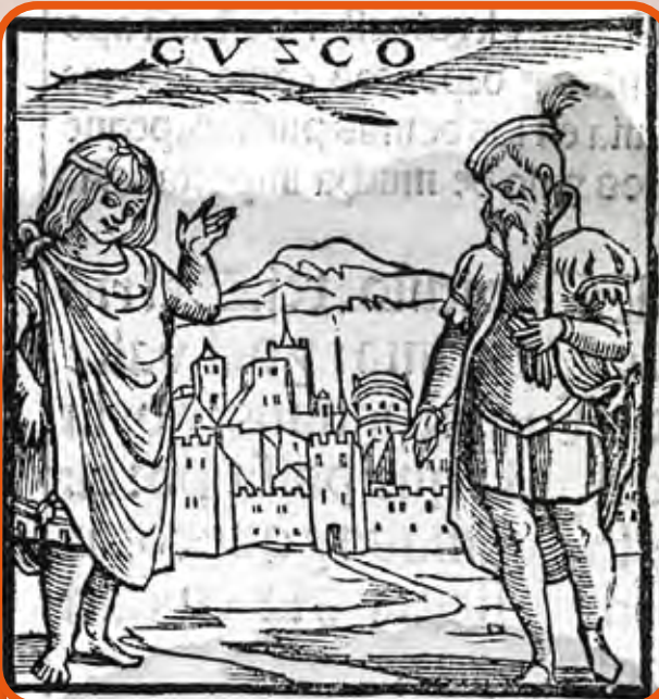
Cuzco első ábrázolása Pedro Cieza de León könyvéből