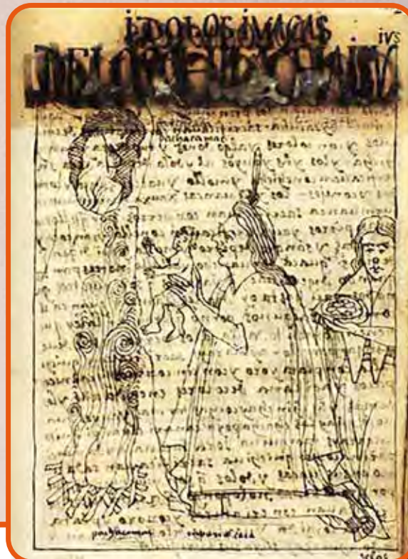
Gyermekáldozat felmutatása a hegy üregében elhelyezett szellemszobornak ( huaca ) Guaman Poma kéziratának 266. oldaláról (Dán Királyi Könyvtár)

gon illusztrált kéziratából, az El primer nueva coronica i buen gobiernó ból (Az első új krónika és jó kormányzat, 1612–1615); esetleg a bálványimádás ellen fellépő általános felügyelő, Rodrigo Hernández Príncipe Mitología andina ( Andoki mitológia , 1622) címen kiadott jegyzőkönyvéből, valamint a szintén visitador general , „általános felügyelői” címmel bíró Cristóbal de Molina (1529–1585) kéziratából, a Relación de las fábulas y ritos de los Incas ból ( Beszámoló az inkák meséiről és rítusairól , 1574–1575).