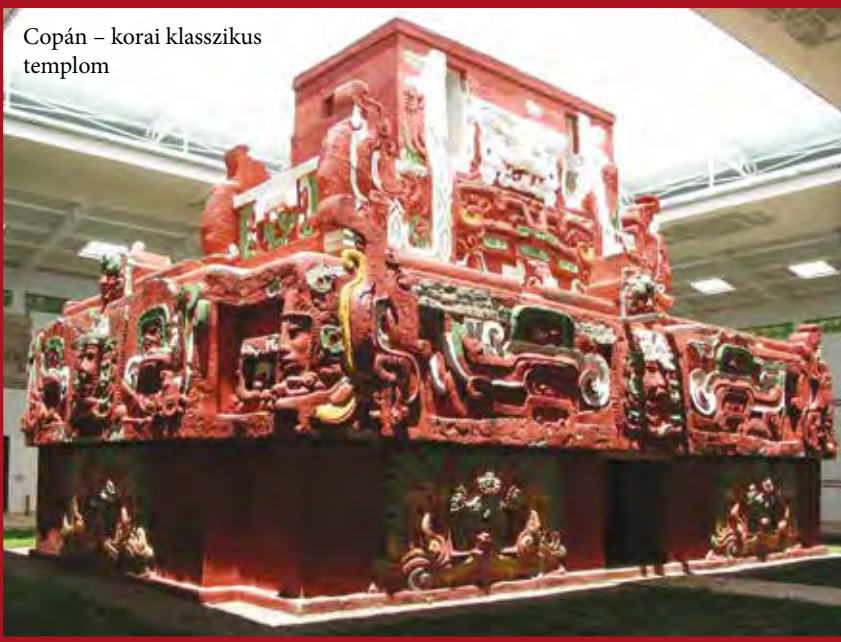
Copán – korai klasszikus templom

te egyszerre jelentek meg a korábbián lényegesen nagyobb településközpontok, melyeket nagyrészt kőből épült platformokra emelt, stukkómaszkokkal díszített templomok, labdajátékterek és hatalmas közterek jellemeztek. Később, Kr. e. 300 körül a tereken először állítottak faragott, ikonográfiai elemeket ötvöző emlékköveket, amelyekeken ekkor jelent meg előbb egy vélhetően szem-asiografikus, később pedig logoszillabikus írás (lásd keretes írás).