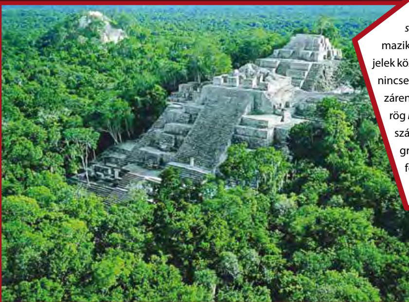
Calakmul (Piramisegyütes II.)

A szem-asiografikus kifejezés a görög szémaszia 'jelentés', 'jelölés' szóból származik, az ilyen írásrendszerekben a grafikai jelek közvetlenül utalnak bizonyos fogalmakra, és nincsenek semmilyen nyelvi struktúrához hozzárendelve. A logoszillabikus kifejezés a görög logosz 'gondolat', 'szó', 'értelem' szóból származik, az ilyen írásrendszerekben a grafikai jelek egyszerű vagy összetett fogalmakat is jelölhetnek és nyelvi struktúrákhoz rendelték. – a szerk.