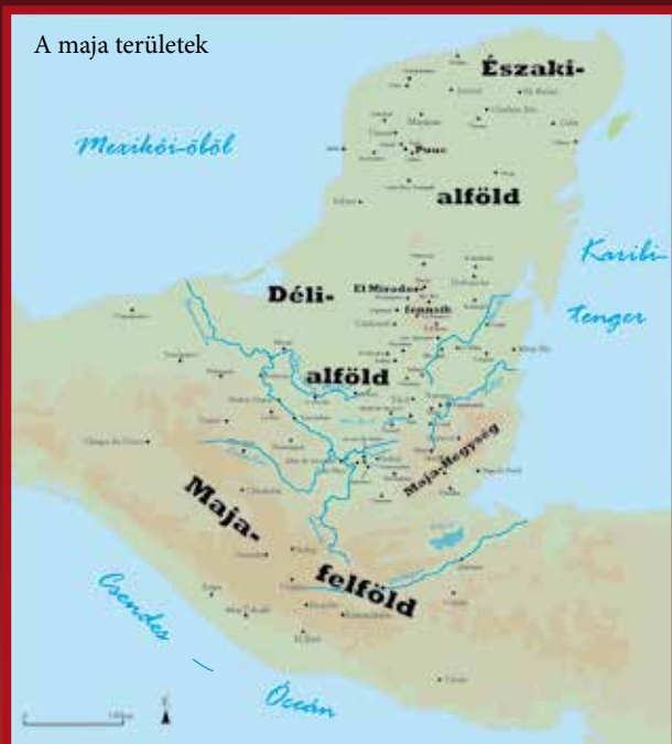
A maja területek

Az egész régió a Ráktérítőtől délre terül el, ám az Egyenlítő még majdnem 4000 kilométerrel délebbre van, ezért az éghajlat szubtrópusi, az erre jellemző száraz és esős évszakok váltakozásával. Természetesen különböző körülményeknek köszönhetően ez mikrorégióként eléggé eltérően jelentkezik. A tengerszint feletti magasság szerint a térség három nagy alterületre osztható: a Csendes-óceán partvidéke, a guatemalai felföld és a maja alföld vidéke, melynek tengerszint feletti magassága nem haladja meg az 1000 métert.