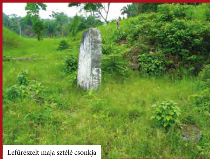
Lefűrészelt maja sztélé csonkja

se, amely párhuzamosan fejlődött a teotihuacáni befolyás mellett és az utóbbi megszűnésével még inkább kiteljesedett. Az epigráfiai bizonyítékok alapján az első hegemon városállam Tikal volt, ami a déli területeket Copán, Río Azul, Altar de Sacrificios és talán Palenque városokkal szövetségben ellenőrizte (Kr. u. 378–556). Ezt követően viszont Dzibanche