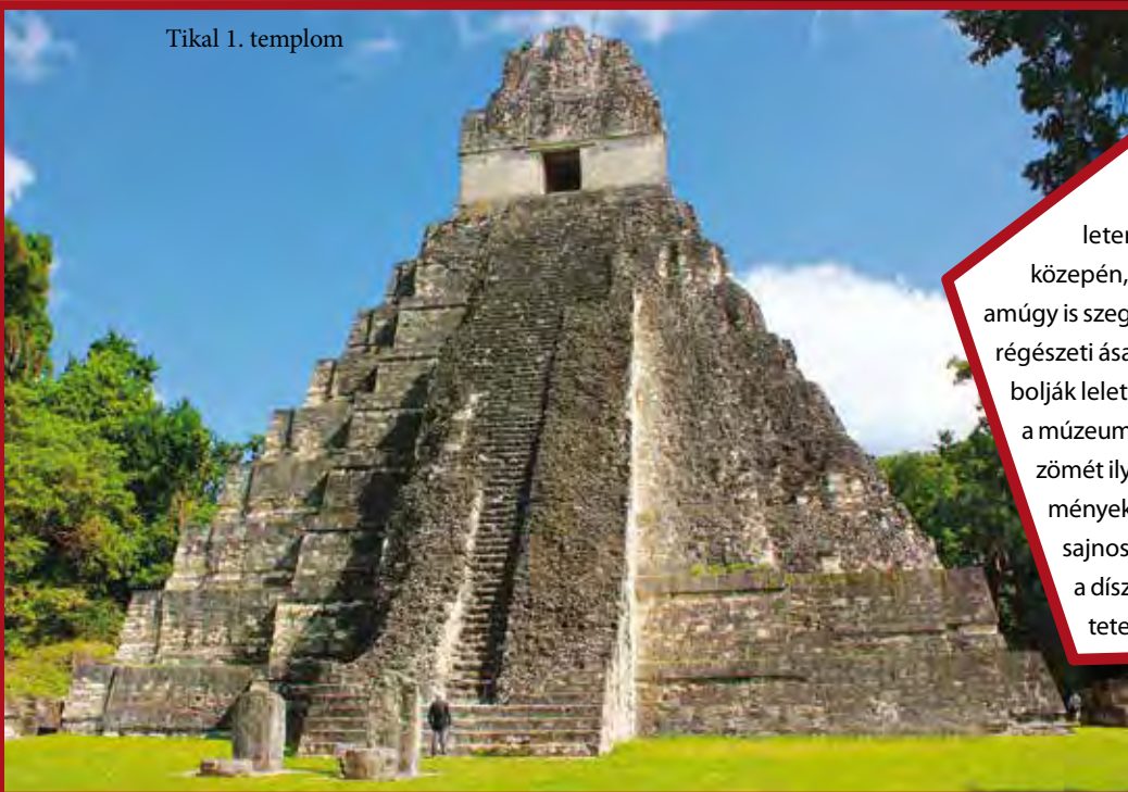
Tikal 1. templom

A maja lelőhelyek többsége ma elhagyott területen található, gyakran a dzsungel közepén, távol a lakott településektől, ezért az amúgy is szegény őslakók számos alkalommal illegális régészeti ásatásokat végeznek, miközben szétrombolják leletegyüttesek régészeti környezetét. Ma a múzeumokban kiállított színes maja kerámiák zömét ilyen ásatásokból veszik meg az intézmények. A kőből készült sztéléket is lopják sajnos; többnyire úgy, hogy lefűrészelik a díszesebb stukkókat a mészkölapok tetejéről.