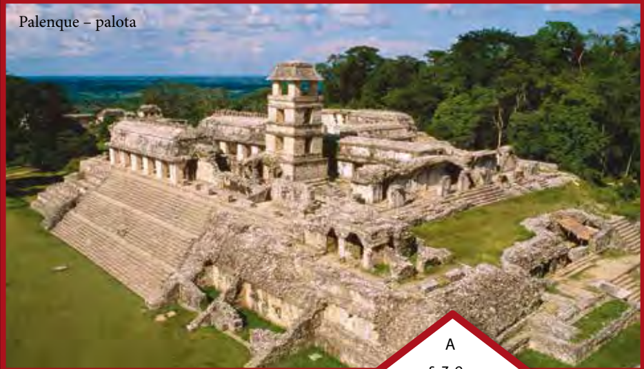
Palenque – palota

A szem-asiografikus kifejezés a görög szémaszia 'jelentés', 'jelölés' szóból származik, az ilyen írásrendszerekben a grafikai jelek közvetlenül utalnak bizonyos fogalmakra, és nincsenek semmilyen nyelvi struktúrához hozzárendelve. A logoszillabikus kifejezés a görög logosz 'gondolat', 'szó', 'értelem' szóból származik, az ilyen írásrendszerekben a grafikai jelek egyszerű vagy összetett fogalmakat is jelölhetnek és nyelvi struktúrákhoz rendelték. – a szerk.