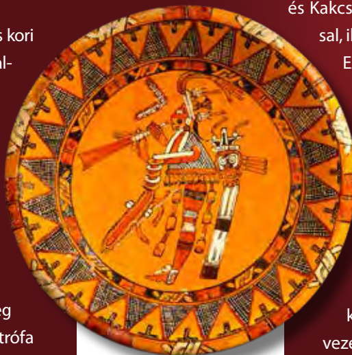
Trombitást ábrázoló maja tál (8. század)

A spanyol hódítók csak 1697-ben, azaz az Újvilágba érkezésüket követően több mint kétszáz évvel később tudták beolvasztani az utolsó független maja királyságot, noha még később is (19. század) az északi jukaték nép által kirobbantott úgynevezett Beszélő Kereszt felkelés remekül mutatja, hogy a maják függetlenségi mozgalmi később sem tűntek el, legutoljára a zapatisták lázadtak fel a mexikói állam ellen, és 1994-től lényegében ma is ők ellenőrzik Chiapas mexikói szövetségi állam felét.