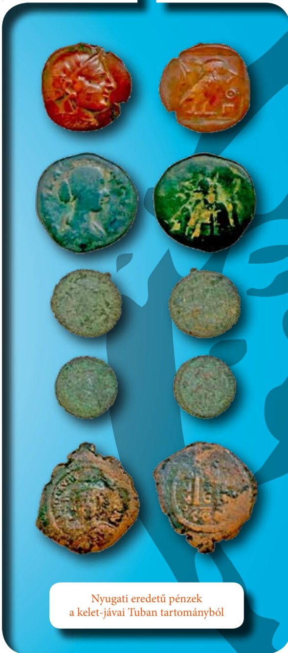
Nyugati eredetű pénzek a kelet-jávai Tuban tartományból

A kontextus nélküli leletek gyakori előfordulása a teljes délkelet-ázsiai régióra jellemző. Az illegális fémkeresés és a lelőhelyek kifosztásának következtében rendkívül kevés a hiteles, eredeti kultúrrétegből előkerült tárgy. Ráadásul csupán korlátozott számú