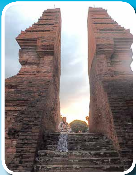
Trowulan lelőhely, a Majapahit Birodalom feltételezett fővárosa