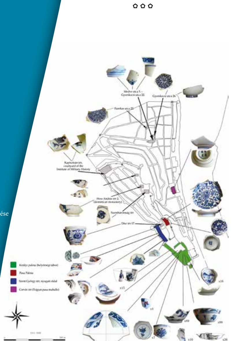
A 16–17. századi kínai porcelántípusok elterjedése a korabeli Budán

Az újabb régészeti kutatások azonban szerencsére kezdenek figyelmet fordítani a hasonló újkori kérdésekre is, így például a dániai Koppenhágából egy 18. századi szeméttelép emésztőgödöréből előkerült kínai porcelán leletgyűjtést is megismertünk nemrégiben. E porcelánok használata kétség kívül a helyi vagyonszámba kereshetőkhöz köthető. Mindez rendkívül jelentős lépés a porcelán kereskedelmének vizsgálatában, mivel megmutatja, hogy nemcsak az építészeti, de a töredékes régészeti anyaggal is érdemes foglalkozni, hiszen ezek sokat hozzátehetnek az kora újkori és újkori Selyemút történetéhez.