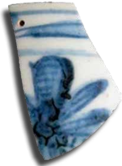
Javításra szolgáló fúrt lyuk egy kínai porcelántöredéken. Buda, 17. század

ciplináris vizsgálata egyelőre kisebb hangsúlyt kap, mint az ősi Selyemút kutatása. A 16–17. századi globális távolsági kereskedelmi hálózat, ezen belül pedig a kínai porcelán mozgásának kutatása azért is különösen érdekes, mert miközben ezen árutípus 18. századi mozgását, a nyugati világban való elterjedését a történettudomány és a művészettörténet is jól ismeri, az azt megelőző 16–17. századi időszokról alig tudunk valamit.