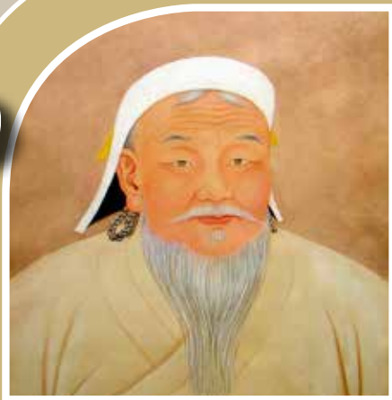
Dzsingisz kán (ur. 1206–1227)

Dzsingisz kán 13. század elején felemelkedő, majd az utódai által kiterjesztett mongol birodalma a világtörténelem legnagyobb egybefüggő területű hatalma volt. A Koreai-félszigettől Kelet-Európáig, a mai Ukrajna területétől Afganisztán, Irán, Irak területéig terjedő birodalom a Selyemutat majdnem teljes hosszában uralta. Mivel a mongolok érdekeltek voltak a kereskedelemben, ezért messzemenően támogatták azt. Ennek köszönhető, hogy a Selyemút történetének egyik legvirágzóbb időszakát élte uralmuk alatt. Tulajdonképpen a mongolok tették lehetővé először Európa és az általuk uralt Kína között a közvet-