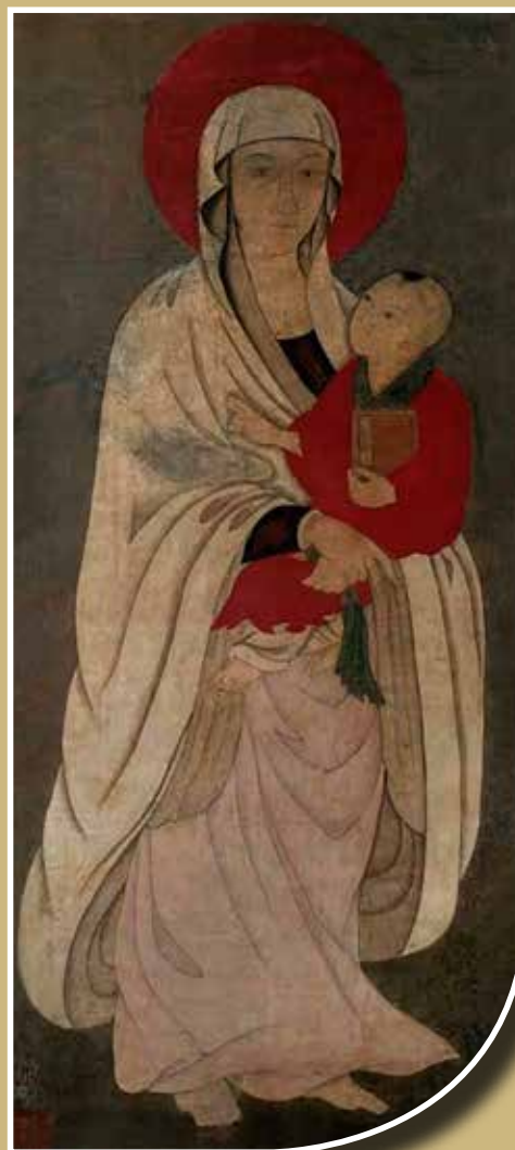
Tang Yin (1470–1524) festménye a gyerekhözó Guanyinról