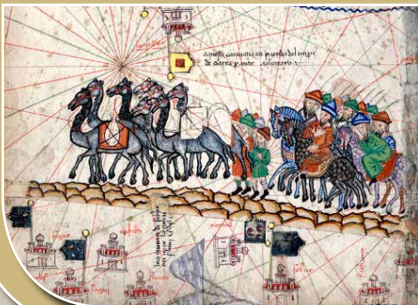
Marco Polo karavánja a Selyemúton (középkori térkép részlete)

Bár nem ismerjük az összes utazót, de a források alapján 1242 és 1448 között legalább 126 egyéni utazó vagy követség érte el Közép- és Kelet-Ázsiát a nyugati és keleti kereszténység területéről. De maradtak-e, és ha igen, akkor milyen tárgyi nyomai a nyugati keresztény kultúrának a Mongol Birodalom központi területein, azaz a mai Mongóliában, illetve a Selyemút keleti végpontján, azaz Kínában?