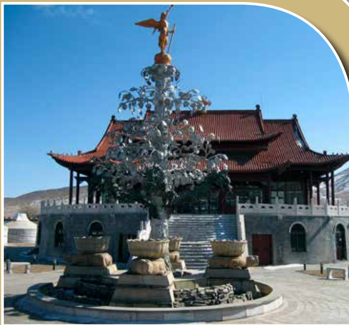
Karakorum, az ezüstfa mai rekonstrukciója

Rubruk szerint az ügyes kézműves mester Möngke nagykán (1251–1259) számára palotájának ajtajába egy olyan „italfát” készített ezüzből, melynek gyökereinél négy, kumiszt okádó ezüstoroslán, tetején egy trombitát tartó angyal volt, a fa belsejében pedig a négy beépített cső mindegyikén más-más ital folyt. A fa alatti fülkében egy ember szólaltatta meg az angyal trombitáját, a szolgálók pedig a csövekbe öntötték a megfelelő italt, ami a fa alá készített ezüstedényekbe folyt. Bár ez a különleges „italfa” sem maradt fent, de kultúrtörténeti hatása napjainkban is tetten érhető: Pierre de Bergeron francia rézmetsző 1637 előtt készült rekonstruált ábrázolása nemcsak a mongolok egyik pénzén, a 10 ezres tugrik hátlapján látható, de mását az egykori Karakorum területén fel is építették.