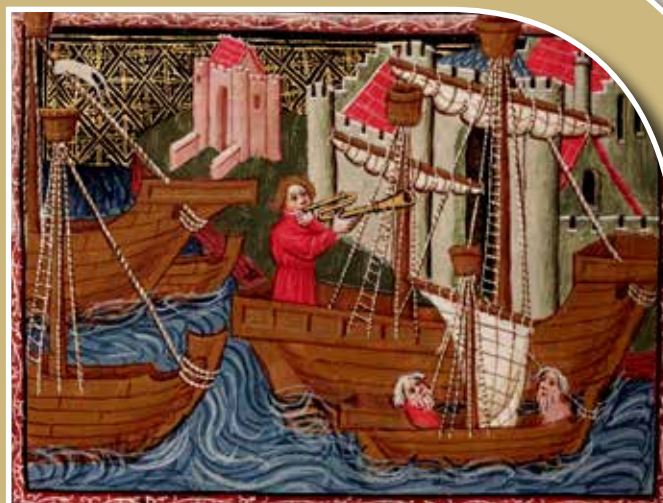
Zayton, ahogy Marco Polo könyvének egy 15. századi illusztrátora elképzelte