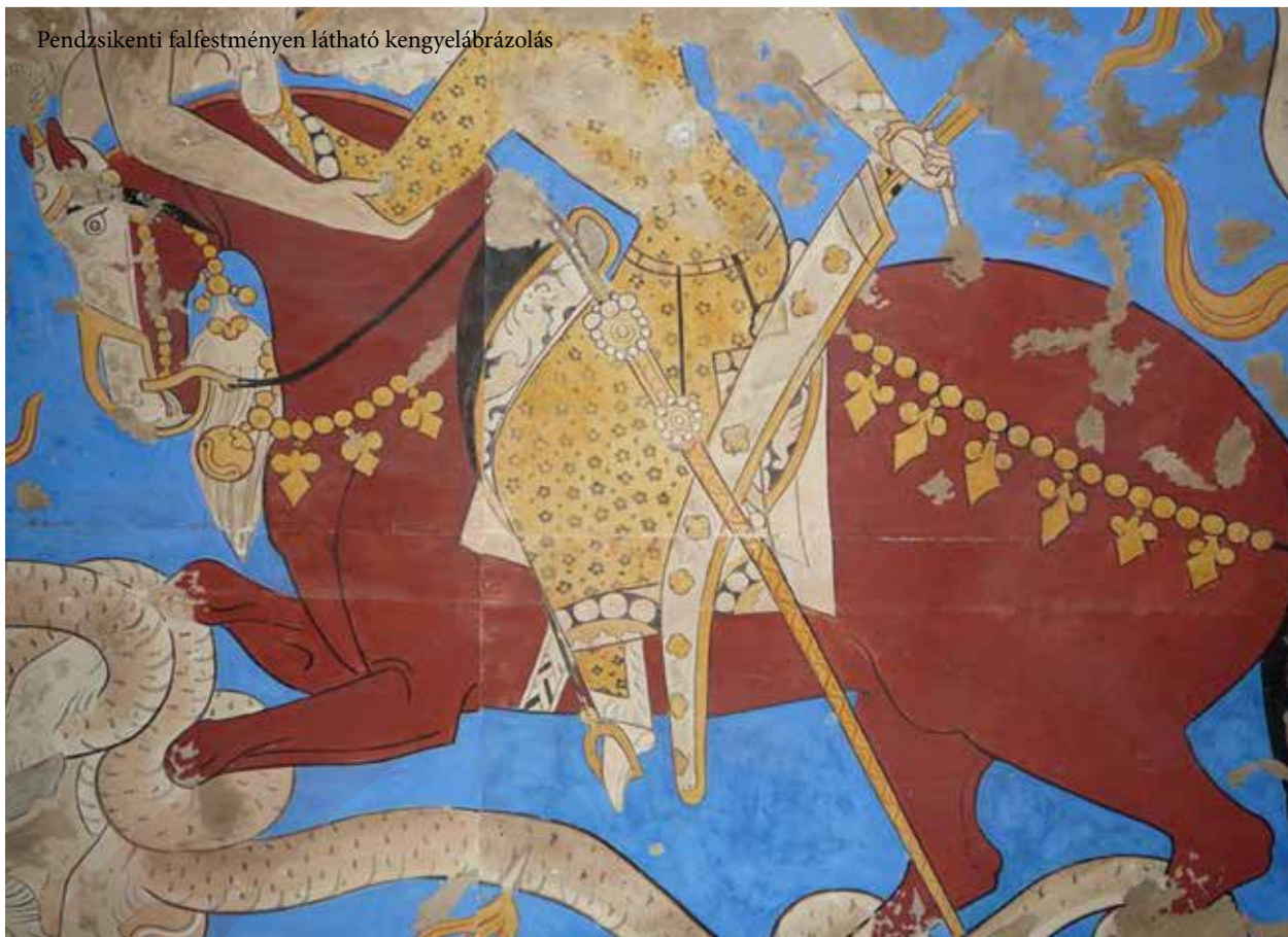
Pendzsikenti falfestményen látható kengyelábrázolás

két csoportjuk különíthető el: az egyik egy nyolcast formázó kengyel, melynek fülrészét hurokformájú fűzőlyukkal látták el, valamint egy másik, kerek vagy ovális formájú típus, téglalap alakú fűzőlyukkal. A két típus között nincs igazából kronológiai különbség.