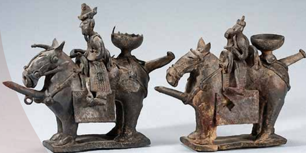
Kerámiából készült lovasszobrokon látható kengyelek (Silla királyság, 5-6. század)