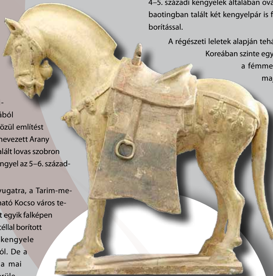
Kínai lószobor kengyellel

A Türk Kaganátusnak döntő jelentősége volt a kengyel elterjesztésében az eurázsiai sztyeppén. A türk kori sírokban jelentős számú kengyel került elő az orosz Altájban, valamint Tuva, a Középső-Jenyiszej, illetve az alsó Ob folyó tájékán. De kerültek elő kengyelek a Tien-san hegy-ségből, Közép- és Kelet-Kazahsztán területéről, avagy Szamarkand [ma Üzbegisztán – a szerk.] környékéről is. A birodalom hatalmas kiterjedése ellenére az előkerült kengyelek típusa egységesnek mondható. Alapvetően