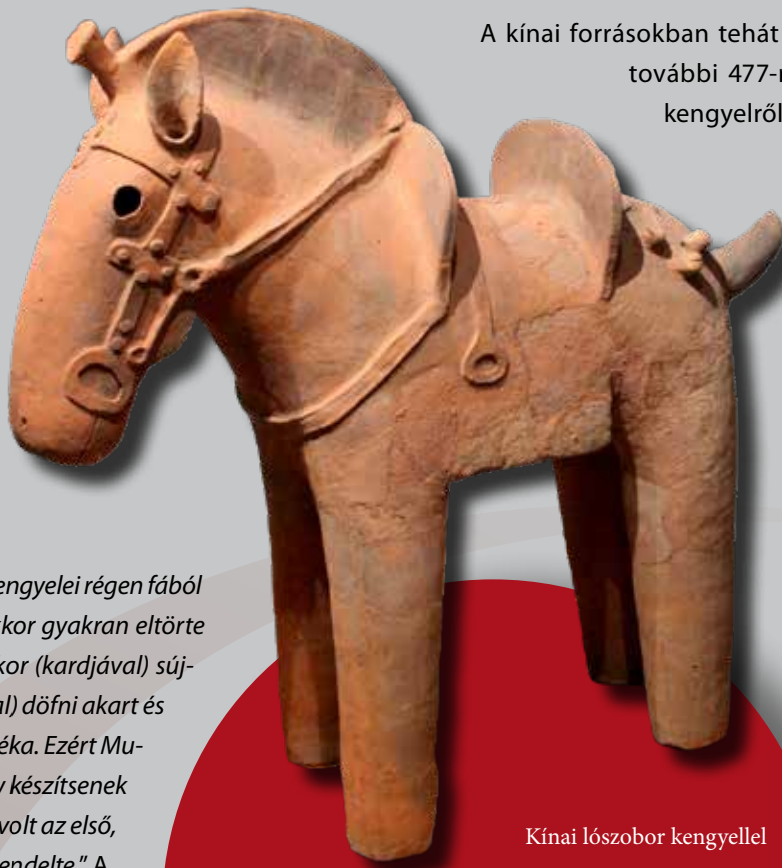
Kínai lószobor kengyellel

Az írott forrásoknál valamivel korábbiak ugyanakkor a kengyel képi ábrázolásai. A kínai Nanjingból származó, 322 tájára korhatározható lovas ábrázolás esetében a ló mindkét oldalán látható egy-egy kengyel. A keleti