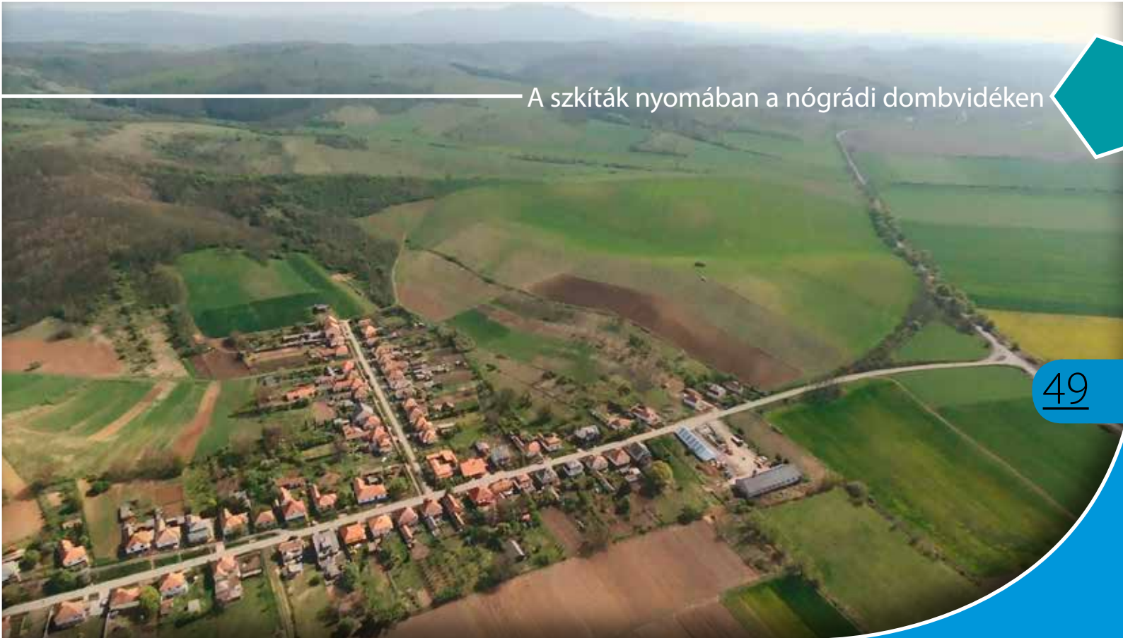
Légi fotó Piliny községről, a háttérben a Borsós és a Leshegy

„Pilin határban az ásatást meg- kezdtem. Mint mindig, úgy most is szép eredményt tudok felmutat- ni, kivált, ha tekintetbe vesszük, hogy csak két nap ásattam” – írta báró Nyáry Jenő 1869- ben, a magyar régészet első, rendszeresen megjelenő folyóiratában. A szűksza- vú leírásából csupán az derül ki, hogy egy hamvasztásos urna- temető sírjait talál- ta meg az ún. Bor- sós-dűlőben, amely később a pilinyi kultúra né- vadó lelőhelyeként lett európai hírű. A feltárásokat a báró több alka- lommal is folytatta, az újabb eredményekről az Archaeologiai Értesítő 1870-es évfolyamában számolt be, megjegyezve, hogy a sírok egy részébe nem a korábban is ismert, jellegzetes bronzkori tárgya-