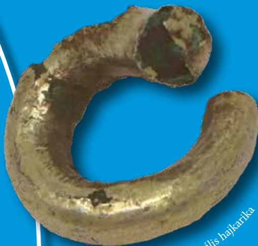
Elektronból készült spirális hajkarika