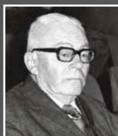
Huszár Lajos (1906–1987)