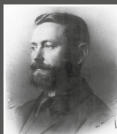
Harsányi Pál (1882–1929)