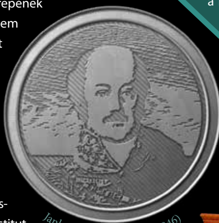
Jankovich Miklós (1772–1846)

szerte Európában, és csupán a 16. század során ezernél is több pénztörténeti vonatkozású kiadvány jelent meg. Magyarországon az éremgyűjtés a 15–16. században kezdődött, első nagy fénykorát a 18. században élte, amikor nem létezett olyan főúri könyvtár, amelynek ne képezte volna részét numophylacium , ahogy akkortájt az éremgyűjteményt nevezték. A numizmatika rövidesen tért hódított az oktatásban is: gombamódra szaporodtak az iskolai éremgyűjtemények. A legrégebben alapított és napjainkig fennmaradt numizmatikai közgyűjtemény 1753-ban Nagyszombatban jött létre, a nagyjából 20.000 darabos gyűjteményt jelenleg az ELTE Régészettudományi Intézete őrzi. Az éremtan történeti és régészeti oktatásban betöltött szerepének jelentőségét jelzi, hogy az egyetem Budára költözését és újjászervezését követően 1778-ban a bölcsészeti kar tizenegyedik tanszéke Érem- és Régiségtani Tanszék néven ( Cathedra Archaeologico-Numismatica ) jött létre. Hazánkban jelenleg az egyetemi oktatásban nem létezik önálló numizmatikai szakirány – a legközelebbi ilyen Bécsben működik (Universität Wien – Institut für Numismatik und Geldgeschichte) –, ennek ellenére a régészeti képzésben résztvevő, főként a római és a középkorra szakosodott hallgatóktól elvárt, hogy legalább numizmatikai alapismeretekre szert tegyenek. Magyarországon nincsenek „okleveles” numizmatikusok, a tudományágat művelő kutatók zömmel régész, kisebb