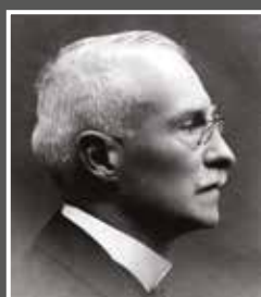
Gohl Ödön (1859–1927)