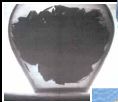
A leletet rejtő kerámia-edényről készült röntgenfelvételen jól látszik, hogy a pénzeket eredetileg egy vászonzacskóban helyezték az edénybe