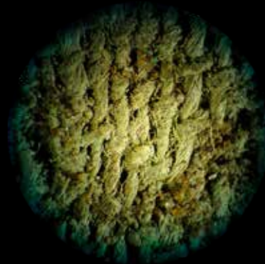
Nagykálló-Harangod lelőhelyen előkerült, 40 db 12. századi anonim denárt tartalmazó, szövetbe csomagolt éremlelet, amelyet tulajdonosa feltehetőleg véletlenül veszített el

kutatói bázisát tekintve is jelentős mértékben eltér a többi történelmi diszciplínától, így a régészettől is. A csekély számú, főként múzeumokban és egyetemeken működő „hivatásos” numizmatikus mellett komoly létjogosultsággal bírnak azok a gyűjtők és kereskedők, akik, bár csak elvétve rendelkeznek szakirányú képesítéssel, az évek-évtizedek során megszerzett hatalmas anyagismeret birtokában jelentős eredményekkel tudnak hozzájárulni ennek a tudományágnak a fejlődéséhez.