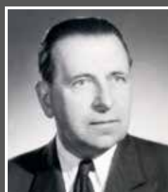
Pohl Artur (1899–1981)