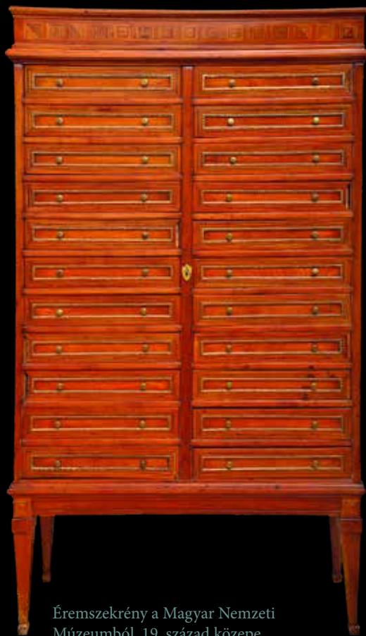
Éremszekrény a Magyar Nemzeti Múzeumból, 19. század közepe