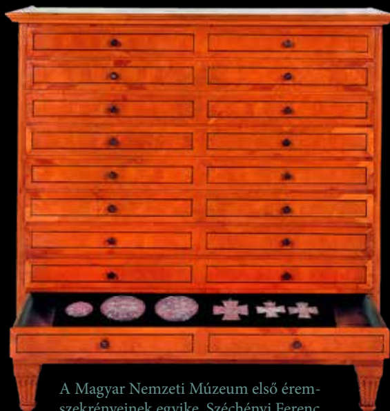
A Magyar Nemzeti Múzeum első éremszekrényeinek egyike, Széchényi Ferenc ajándéka, 19. század eleje

Szabatosan a (pénz)érme (többes szám: érmék) alatt a fémből készült fizető-eszközt értjük, míg a különleges alkalmazásra, vagyis nem a mindennapi pénzforgalom céljából előállított veretek neve az (emlék)érem (többes szám: érmek). Bár ezzel a finom különbségtétellel nem árt tisztában lenni, jó tudni, hogy az évszázadok során kialakult tradicionális terminológia szerint éremképről, éremletről, éremmellékletről és éremtárról beszélünk, annak ellenére, hogy a felsorolt összetett szavak első tagja voltaképpen érmét, és nem érmet takar.