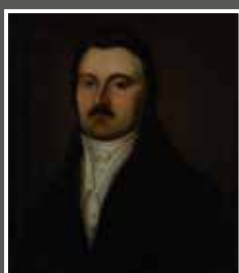
Weszerle József (1781–1838)