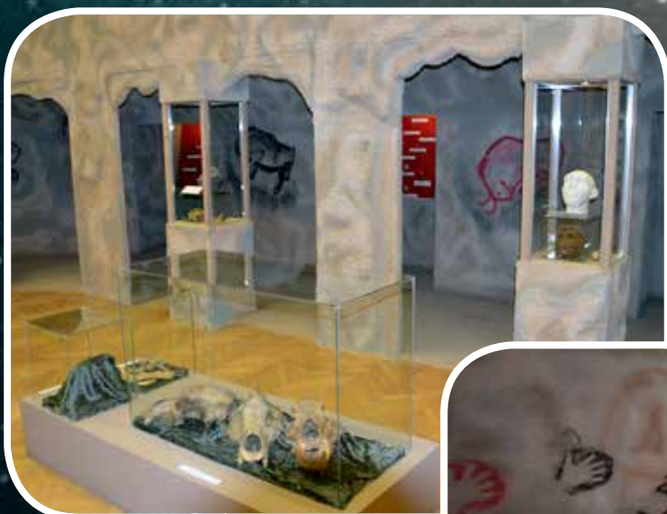
Részlet a Móra Ferenc Múzeumban 2013-ban megrendezett Egyszer volt az... Ősember című kiállításból

A szegedi Móra Ferenc Múzeum hosszú évek óta törekszik arra, hogy legalább kétfévente tudjon egy-egy „nagykiállítást” rendezni. Büszkék vagyunk arra, hogy 2011–2018 között Csontváry és Munkácsy gyönyörű festményei mellett Egyiptom és a tragikus sorsú Pompeji kincseit, valamint egy nagyszabású, az Egyesült Államokból érkezett, a dinoszauruszok világát bemutató kiállítást is meg tudtunk valósítani. Az érdeklődésre mi sem mutat rá jobban, minthogy ezek a tárlatok összesen közel 400.000 látogatót vonzottak!