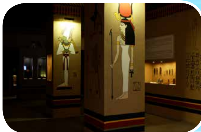
Részlet a Móra Ferenc Múzeumban 2014-ben megrendezett A fáraók Egyiptoma című kiállításából

ményeknek nevezzük. Ide bekerülni úgy lehet, ha valaki tudományos (pl. régész, néprajzos, történész, restaurátor), szakmai (pl. teremőr, gondnok, éjjeliőr) vagy technikai (pl. gazdasági dolgozó, könyvelő, pénztáros) állást kap. A magyar múzeumokban mindenki közalkalmazotti státuszban dolgozik, a létszámot pedig a múzeum fenntartója – a városi közgyűlés vagy országos múzeumok esetén a minisztérium – határozza meg. Ettől a számtól eltérni