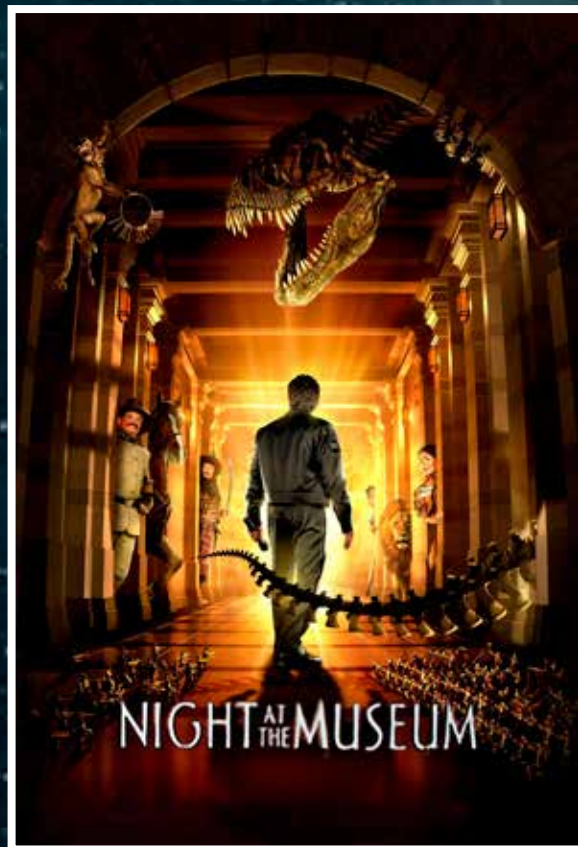
A 2006-ban bemutatott, Éjszaka a Múzeumban című film plakátja

Az országos és a vidéki (megyei és városi) múzeumok esetében többnyire nem a gyűjtőkör, hanem a földrajzi gyűjtőterület az elsődlegesen meghatározó, így ezekben több területre is koncentrálnak. (Pl. régészet, néprajz, helytörténet, képzőművészet.) Ahogy a nevükben is szerepel, az országos múzeumok az egész országra kiterjedően, a megyei és a területi/városi múzeumok pedig a saját területük határain belül gyűjtik a néprajzi, régészeti, történeti stb. emlékeket.