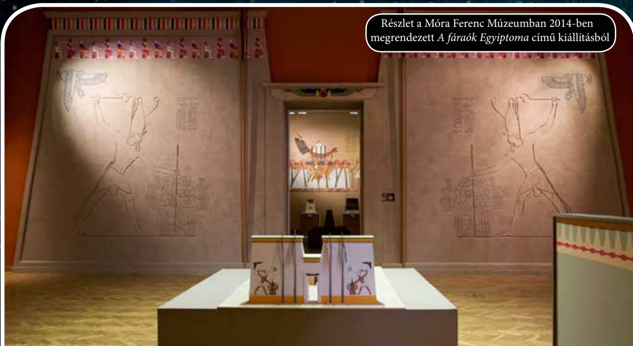
Részlet a Móra Ferenc Múzeumban 2014-ben megrendezett A fáraók Egyiptoma című kiállításából

A múlt legkülönbözőbb emlékei többféle módon kerülhetnek be egy múzeumba. A legáltalánosabb gyarapodást a tudományos gyűjtőmunkáknak – régészeti feltárások, néprajzi, természettudományi gyűjtések stb.