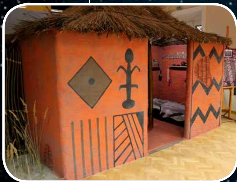
Részlet a Móra Ferenc Múzeumban 2015-ben megrendezett Csak a jó meleg Afrika című kiállításból

A muzeális értékekkel való foglalatosságok azonban korántsem érnek véget ezzel. A különböző kiadványok és előadások ugyanúgy fontos szerepet játszanak a közzétételi tevékenységünkben. Magas tudományos igénye és sok évre vissza-